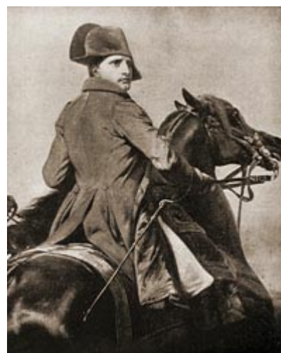
Наполеон въезжает в покоренную Иену

Наполеон предполагал, что главная масса прусской армии сосредоточивается в районе Веймара, чтобы продолжать отход к Берлину, и что генеральное сражение произойдет у Веймара 15 октября. Он послал маршала Даву к Наумбургу и далее на тылы прусской армии, Бернадотт получил приказ присоединиться к Даву, но выполнить его не мог. Наполеон с маршалами Сультом, Неем, Мюратам двинулся на Иену. К вечеру 13 октября Наполеон въехал в г. Иену и, смотря с высот окружающих гор, увидел крупные силы, отходившие по дороге в Веймар. Князь Гогенлоэ знал, что французы вошли в Иену, но он понятия не имел, что и сам Наполеон с несколькими корпусами находится тут же. В ночь с 13-го на 14-е Гогенлоэ остановился по дороге и неожиданно для Наполеона решил принять бой.