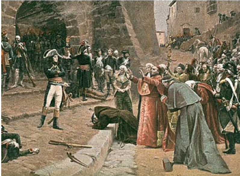
Расправа над непокорной Павией

в руках прежних государей, но с фактическим подчинением их Франции. Бонапарт организовал эту Цизальпинскую республику так, что при видимости существования совещательного собрания представителей из состоятельных слоев населения вся фактическая сила должна была находиться в руках французской оккупационной военной власти и присланного из Парижа комиссара. Ко всей традиционной фразеологии