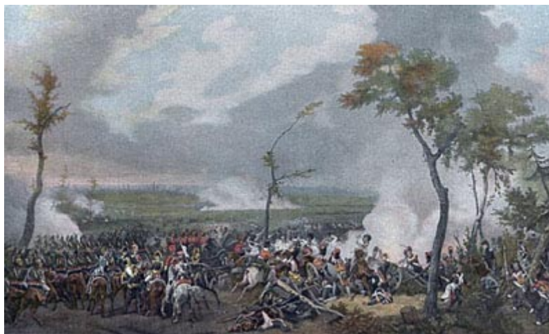
Битва при Гане

Наполеон еще не складывал оружия. Он думал о новой предстоявшей стадии борьбы, и когда заговаривал с маршалами, прерывая свое угрюмое молчание, то делал это затем, чтобы отдать новые распоряжения. Он решил теперь отпустить папу в Рим; он позволил испанскому королю Фердинанду VII, которого держал в плену пять лет, вернуться в Испанию. Понадобились 125 тысяч потерянных обеими сторонами людей на лейпцигском поле, и главное понадобилось отступление от Лейпцига, чтобы Наполеон наконец примирился с мыслью, что уже не поправить ему одним ударом всего, что случилось, не загладить Бородину, московского пожара, гибели великой армии в русских снегах, отпадения Пруссии, Австрии, Саксонии, Баварии, Вестфальского королевства, не ликвидировать Лейпцига, испанской народной войны, не сбросить Веллингтона с англичанами в море. Еще в июне, июле, августе этого страшного 1813 года он мог кричать на Меттерниха, топтать на него ногами, спрашивая, сколько он денег получил от англичан, оскорблять австрийского императора, провоцировать Австрию, срывать мирные переговоры, впадать в бешенство от одной мысли об уступке Иллирии на юге или ганзейских городов на севере, продолжать жечь английские конфискованные товары; расстреливать гамбургских сенаторов, - словом, вести себя так, будто он вернулся в 1812 г. из России победителем и будто речь идет теперь, в 1813 г., лишь о наказании