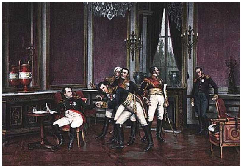
Наполеон оглашает маршалам текст своего отречения от власти

Он почти не ложился в эту ночь. Настало утро 6 апреля 1814 г. Он велел созвать маршалов и сказал им: «Господа, успокойтесь! Ни вам, ни армии не придется больше проливать кровь. Я согласен отречься. Я бы желал для вас, так же как для моей семьи, о б е с п е ч и т ь престолонаследие за моим сыном. Я думаю, что эта развязка была бы для вас еще выгоднее, чем для меня, потому что вы жили бы тогда под властью правительства, соответствующего вашему происхождению, вашим чувствам, вашим