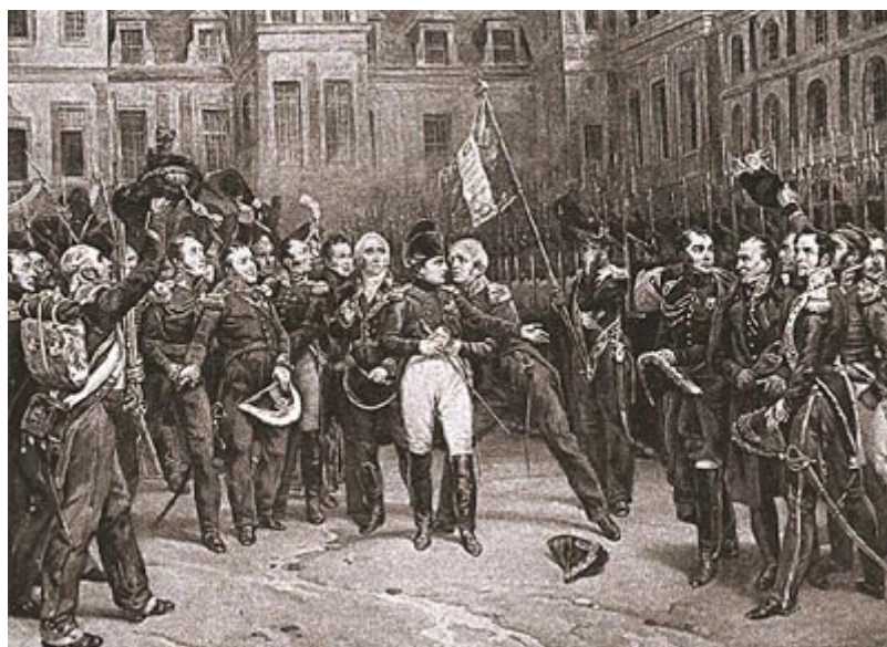
Император прощается с гвардией

Сборы постепенно заканчивались. По условиям с союзниками, император мог взять с собой на остров Эльбу один батальон своей гвардии.