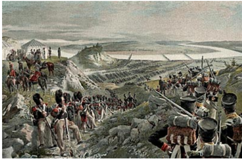
Великая армия переходит Неман. Война 1812 года началась.

границу, и несравненно больше, чем в Дрездене, понимать особенности и трудности затеянного дела. И это тотчас же отразилось на его политике: к великому разочарованию поляков, он не присоединил к Польше Литвы (под Литвой подразумевались тогда Литва и Белоруссия), а создал для Литвы особое временное управление. Это означало, что он не хочет предпринимать ничего, что могло бы в данный момент помешать миру с