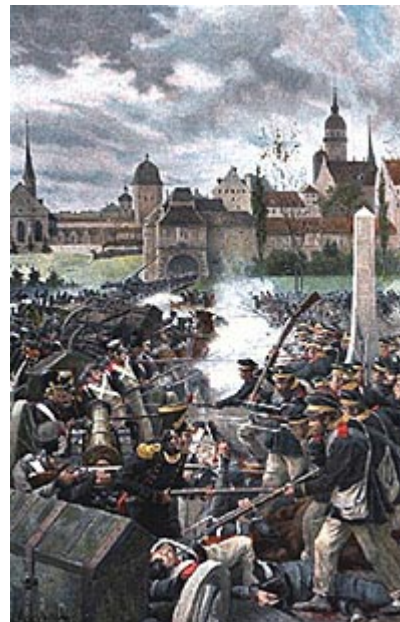
Французская армия покидает Лейпциг

Весь день 17 октября прошел в уборке раненых, в приготовлениях к продолжению битвы. Наполеон после долгих колебаний решил отойти к линии реки Заале. Но он не успел привести это намерение в исполнение, как разгорелось на рассвете 18 октября новое сражение. Соотношение сил еще более круто изменилось в пользу союзников. Потеряв 16 октября около 40 тысяч человек, они получили огромные подкрепления 17-го и в ночь на 18-е, и в битве 18 октября у них было почти в два раза больше войск, чем у Наполеона. Битва 18 октября была еще страшнее, чем та, которая происходила 16-го, и тут-то, в разгаре боя, вдруг вся саксонская армия (подневольно сражавшаяся в рядах Наполеона) внезапно перешла в лагерь союзников и, мгновенно повернув пушки, стала стрелять по французам, в рядах которых только что сражалась. Но Наполеон продолжал бой с удвоенной энергией, несмотря на отчаянное положение.