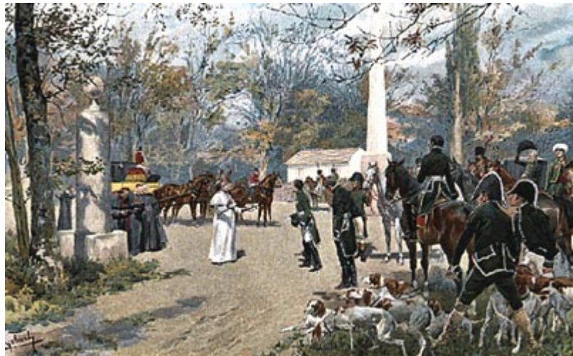
Наполеон встречает папу Пия VII

отхваченных в свое время Наполеоном папских владений на севере Церковной области в Италии. Но папе Пию VII, кардиналу Консальви и всему конклаву кардиналов было не под силу перехитрить первоклассного дипломата, каковым всегда был Наполеон. Папа много лукавил, горько жаловался, снова лукавил, снова жаловался,- ничего не выторговал и отправился в Париж в надежде, которую в нем охотно поддерживал Наполеон, что когда он приедет в Париж, то здесь, может быть, что-нибудь и получит. Он приехал в Париж - и ровно ничего не получил.