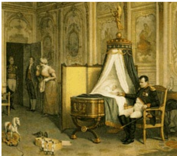
Последнее свидание с сыном

В ночь с 24 на 25 января 1814 г. Наполеон должен был выехать к армии. Регентшей империи он назначил свою жену, императрицу Марию-Луизу. В случае смерти Наполеона на императорский престол должен был немедленно вступить его трехлетний сын, римский король, при продолжающемся регентстве матери. Наполеон так любил это маленькое существо, как он в своей жизни никогда никого не любил. Зная Наполеона даже и не подозревали в нем вообще способности до такой степени к кому бы то ни было привязываться. Барон Меневаль, один из личных секретарей Наполеона, говорит, что был ли занят император у своего стола, писал ли, читал ли у камина,- ребенок не сходил с его колен, не хотел покидать его кабинета, требовал, чтобы отец играл с ним в солдатики. Он один во всем дворце нисколько не боялся императора и чувствовал себя в кабинете отца полным хозяином. 24 января Наполеон весь день провел у себя в кабинете за срочными делами, которые нужно было устроить перед отъездом на эту решающую войну, перед грозной боевой встречей со всей Европой, поднявшейся против него. Ребенок со своей деревянной лошадкой был, как всегда, около отца, и так как ему, по-видимому, надоело наблюдать