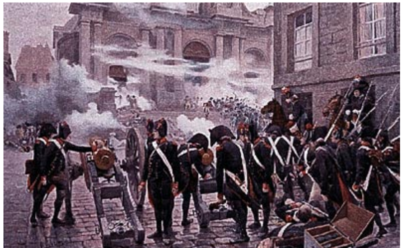
Пушки генерала Бонапарта против мятежников-роялистов

момент. Они отвечали ружейной пальбой. К середине дня все было кончено. Оставив несколько сот трупов и увлакивая за собой раненых, мятежники бежали в разных направлениях и скрылись по домам, а кто мог и успел, покинул немедленно Париж. Вечером Баррас горячо благодарил молодого генерала и настоял, чтобы Бонапарт был назначен командующим военными силами тыла (сам Баррас немедленно сложил с себя это звание, как только восстание было разгромлено).