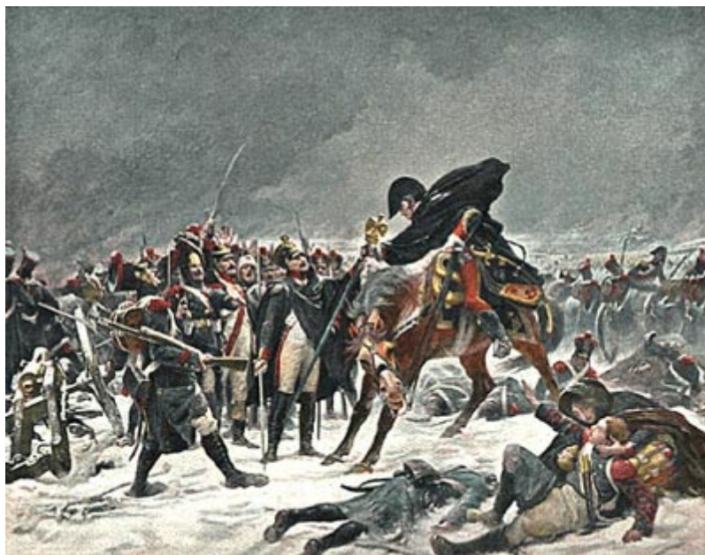
Фрагмент битвы при Прейсиш-Эйлау

Наполеон и окружавшие его видели, что только личное присутствие императора удерживает пехоту в этом ужасающем положении. Император остался неподвижно на месте, отдавая новые и новые приказания через тех редких адъютантов, которым удавалось уцелеть при приближении к тому страшному месту, где стоял окруженный несколькими ротами пехоты Наполеон. У его ног лежало несколько трупов офицеров и солдат. Пехотные роты, вначале окружавшие императора, постепенно истреблялись русским огнем и заменялись подходившими егерями, гренадерами гвардии и кирасирами. Наполеон отдавал приказания хладнокровно и дождался в конце концов удачной атаки всей французской кавалерии на главные силы русских. Эта атака спасла положение. Кладбище Эйлау осталось за французами, центр боя перенесся