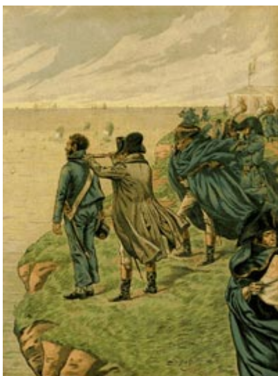
Наполеон рассматривает побережье Англии из Булонского лагеря

Вильям Питт решил пойти на что угодно, лишь бы предотвратить высадку Наполеона на берегах Англии.