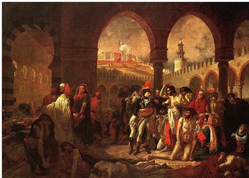
Наполеон в городе Яффа

Поход в Сирию был страшно тяжел, особенно вследствие недостатка воды. Город за городом, начиная от Эль-Ариша, сдавался Бонапарту. Перейдя через Суэцкий перешеек, он двинулся к Яффе и 4 марта 1799 г. осадил ее. Город не сдавался. Бонапарт приказал объявить населению Яффы, что если город будет взят приступом,