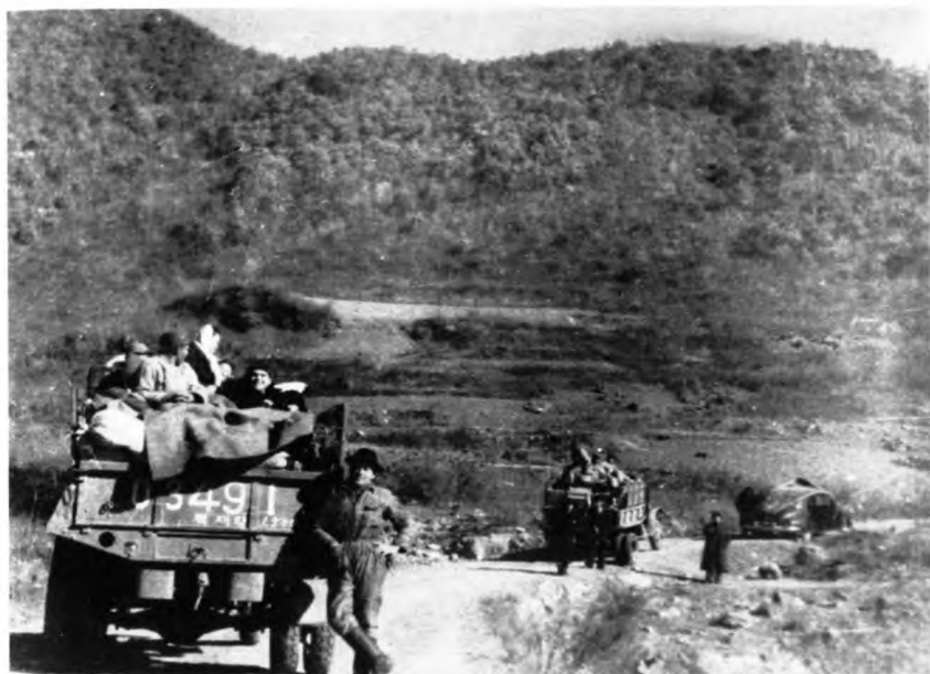
Эвакуация советского посольства