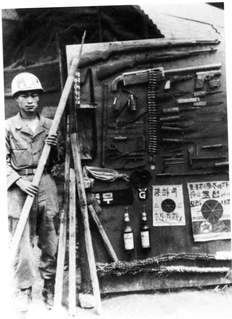
Трофеи начального этапа