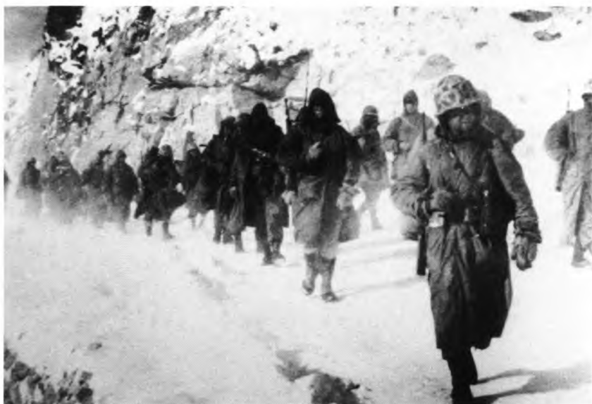
Южнокорейские солдаты ... на марше