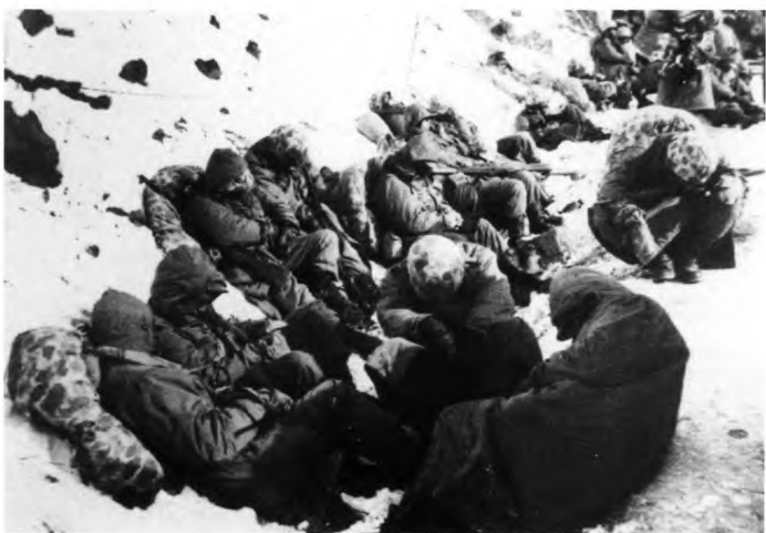
... на привале