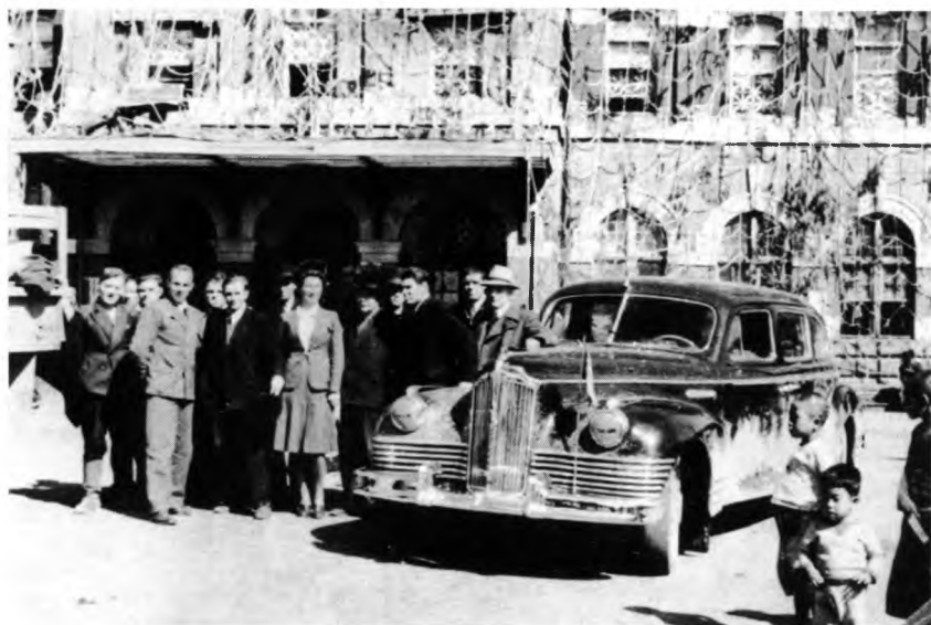
Советские дипломаты перед зданием советского посольства в Пхеньяне в разгар боевых действий