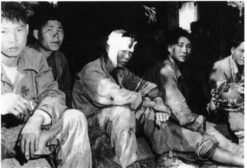
Солдаты Северной Кореи в плену