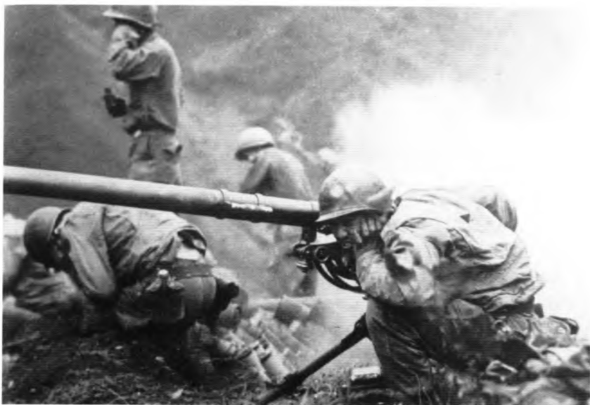
... на передовой