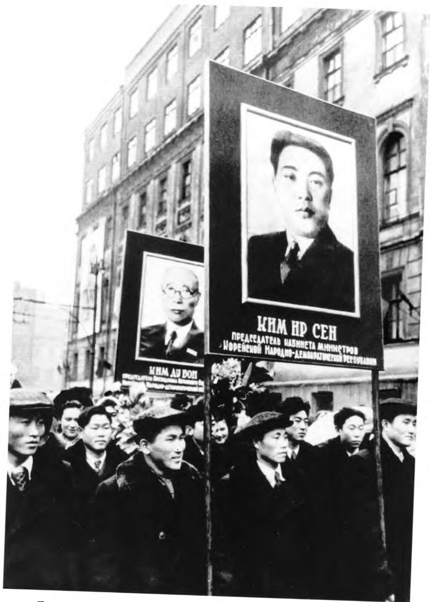
Демонстрация в Москве в поддержку Северной Кореи