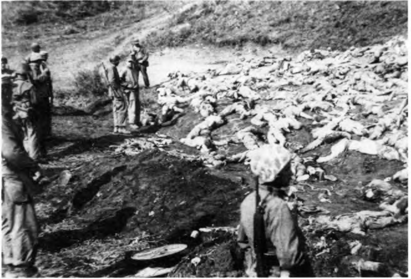
Ужасы войны. Жертвы массовых расстрелов