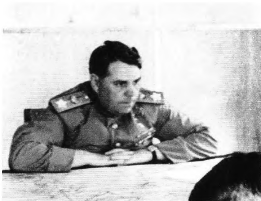
Маршал Советского Союза А.М.Василевский над картой боевых действий