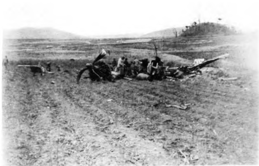
Сбитый американский самолет