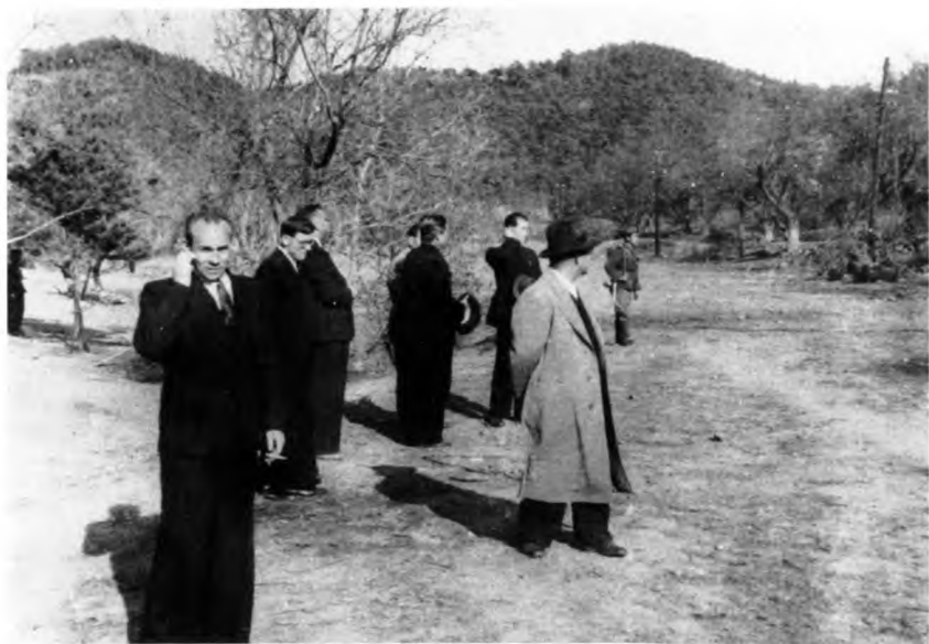
Пак Хен Ен на территории советского посольства в Пхеньяне. 15.08.1951 г.