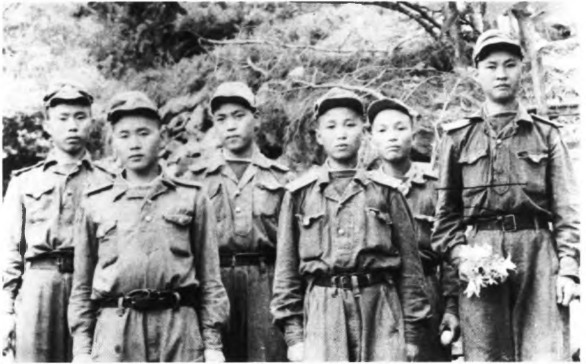
Солдаты Северной Кореи