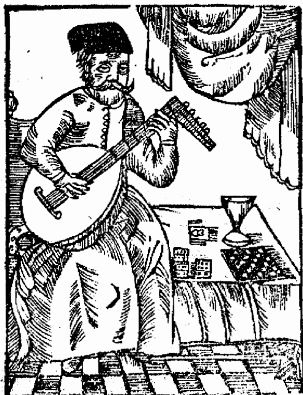
Суп. Оссия. & Ружилато S B M.