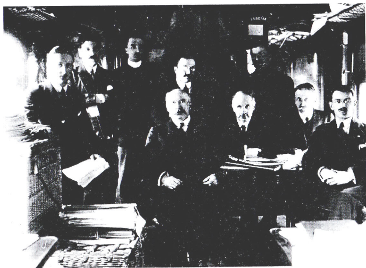
Сотрудники французского посольства в салон-вагоне на ст. Вологда. В центре – посол Ж. Нуланс. Апрель 1918.