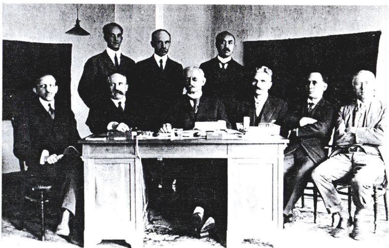
Последнее совещание глав посольств и миссий в здании американского посольства в Вологде, июль 1918 г.