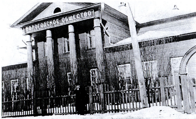
Здание посольства США в Вологде, март 1918. (Бывший клуб приказчиков)