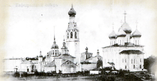
Вологда. Соборы, Стрелки