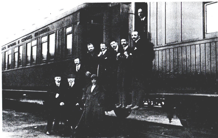
Посольство Франции у вагона на ст. Вологда. В нижнем ряду – посол Д. Нуланс с супругой. Апрель 1918.