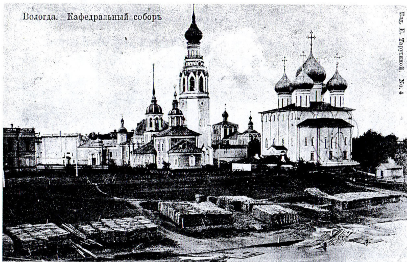
Вологда. Кафедральный собор