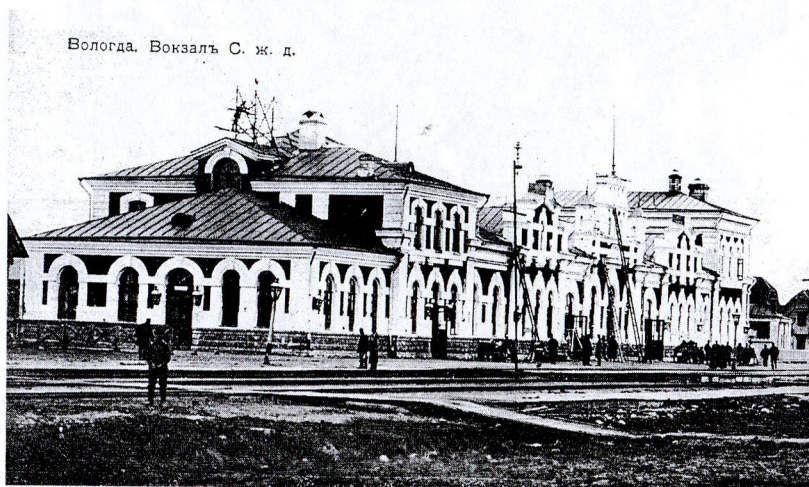
Вологодский вокзал – начало и конец дипломатической истории в Вологде, фото начало XX в.