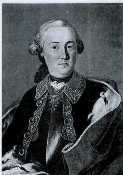
Неизвестный художник второй половины XVIII в. (круг Ф.С. Рокотова): Портрет А.И. Глебова. 1770-е гг.

Но даже такой педантичный мемуарист, как А.Т. Болотов, ошибается, утверждая, что лишь с сентября 1762 г. Манифест о вольности вступил в силу. Уже 27 марта 1762 г. Герольдмейстерская контора оформляет отставку сорокалетнего прапорщика З.Т. Дурасова, владельца 240 ревизских душ, на основании нового положения о службе 30 .