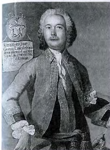
Г. Гроот (?) Портрет секунд-майора кирасирского полка Т.Ю. Лесли. 1749 г.