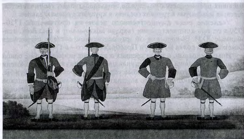
Неизвестный художник. Бомбардир артиллерийского полка. 1731 г. Фузелеры артиллерийского полка. 1731 г.

достаток имели, чем себя, будучи в гвардии, чисто содержать; а с прочими надлежит так поступать, кто не весьма в гвардии быть способен, тех представлять в выпуск в другие полки" 28 . Преимущества в чиновпроизводстве состоятельных слоев дворянства обеспечивала и появившаяся еще при Петре I и особенно широко распространившаяся в 1740–1750-е гг. система сверхкомплектного (без жалованья) прохождения дворянами службы в низших чинах. Она создавала, с одной стороны, резерв для пополнения полков дворянами, а, с другой – ускоряла карьеру состоятельных помещиков, поскольку в этом случае для получения следующего чина не требовалось вакансии 29 . Известно, например, что