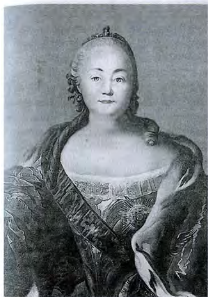
И.П. Аргунов. Портрет императрицы Елизаветы Петровны. 1760-е гг.