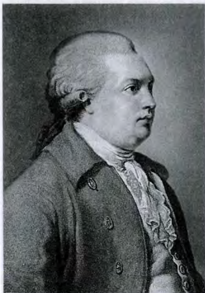
Неизвестный художник первой половины XIX в. Портрет Д.И. Фонвизина