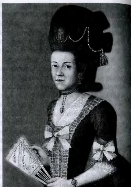
Неизвестный художник. Портрет дамы. 1770-е гг.

ничего в предмете" 75 . После отставки он около года жил и кормился у приятеля, затем несколько лет скитался в поисках места и заработка, попал под суд и был сослан в Оренбург, где и провел остаток жизни 76 .