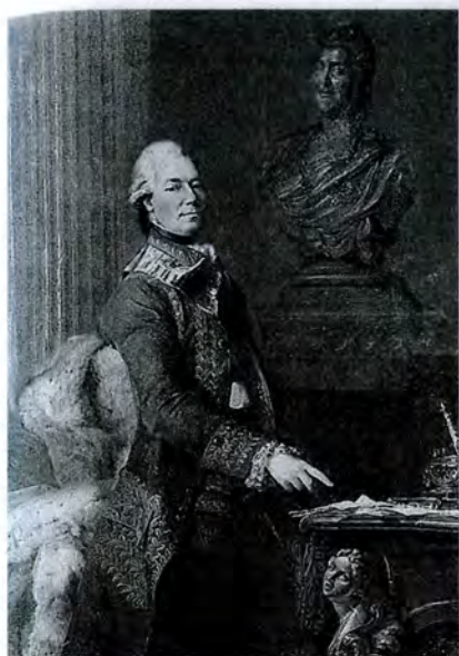
А. Рослен. Портрет генерал-фельдмаршала. З.Г. Чернышева. Ок. 1776 г.