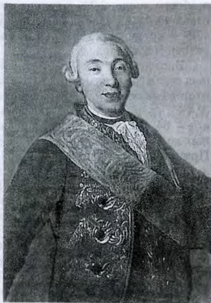
К.И. Головачевский. Портрет великого князя Петра Федоровича (Петра III) 1758 г.

вий. В дальнейшем это сыграло важную, если не определяющую, роль в процессе формирования аппарата управления, тесно связанного с интересами класса феодалов, с одной стороны, и в значительной степени зависевшего от государственного жалования – с другой, который обеспечил постоянное усиление относительной независимости и самостоятельности верховной власти и живучесть феодализма и его институтов в России.