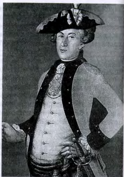
К. Христинек. Портрет майора армейской пехоты. 1766 г.

Для понимания реалий дворянской службы чрезвычайно важным представляется решение вопроса о частоте отставок служащих различных имущественных групп, то есть о соотношении количества отставных той или иной категории с количеством пребывавших на службе дворян. Провести необходимый анализ возможно при наличии данных о соотношении интересующих групп дворян в составе военных и чиновников. Однако таких сведений нет. Зато существуют материалы об их соотношении в составе всего российского дворянства. Опираясь на теорию вероятностей, можно предположить, что частота появления на свет мальчиков в различных слоях дворянства была примерно одинаковой. А если учесть, что обязанность нести государственную службу для всего господствующего класса была единой, то следует заключить, что в составе служащих соотношение различных категорий дворянства было примерно таким же, как и в составе всего сословия. При этом в среде военных, очевидно, несколько меньшим был процент средних и крупных помещиков, имевших больше шансов быть определенными в статскую службу. Таким образом, выяснить сравнительную частоту отставок служащих можно путем сопоставления соотношений имущественных групп отставных с аналогичными данными об имущественном составе дворянства в изучаемом году. В данном случае предметом нашего внимания будут материалы за 1753 и 1755 гг. Сведения о составе дворянства за эти годы нами рассчитаны на основе имеющихся в литературе данных по I и III ревизиям 50