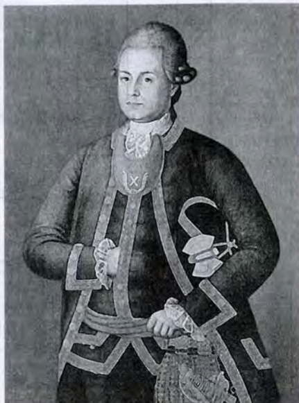
Неизвестный художник. Портрет офицера артиллерии. 1750-е годы.

А.В. Суворов прошел все низшие чины на службе в Семеновском полку, числясь сверхкомплектным 30 . Убедительные факты зависимости карьеры в гвардии от имущественного положения приводит Ю.Н. Смирнов. В 1740 г. в Преображенском полку владельцы 101–500 душ м.п., как ему удалось установить, составляли самую многочисленную группу среди унтер-офицеров (45,6%) и офицеров (41,1%), а владельцы более 500 ревизских душ – соответственно 15,1% и 32,1% 31 . Подобное же положение, по наблюдению исследователя, сохраняется и в середине XVIII столетия. "Помещики, владевшие 100 душами м.п. и менее, составляли в гвардейских полках 83–96% рядовых дворян, 68–80% капралов, 42–72% унтер-офицеров и только 15–16% офицеров-дворян... Если беспоместные и наименее обеспеченные мелкопоместные дворяне в большинстве своем заканчивали военную карьеру в нижних чинах гвардии, то большинство средних и крупных помещиков, наоборот, продолжало ее офицерами армии" 32 . По своему имущественному положению верхушка гвардейских полков принадлежала к богатым и средним слоям российского дворянства 33 .