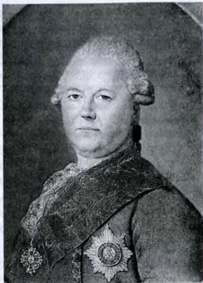
Неизвестный художник. Портрет генерала. Ок. 1796 г.

(см. табл. 11). Поскольку сведений об удельном весе беспоместных дворян в литературе не имеется, при анализе пропорциональных соотношений эта группа не учитывалась, что потребовало скорректировать соотношения имущественных групп отставных (см. ниже примеч. 6 и табл. на с. 96).