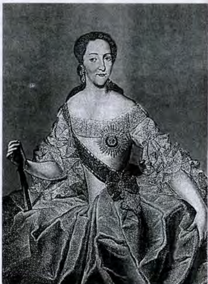
Неизвестный художник XVIII в. Портрет великой княгини Екатерины Алексеевны

Социальная эволюция дворянства, активно проходившая на протяжении 1720–1760-х гг. отразилась и на процессе имущественной дифференциации привилегированного сословия.