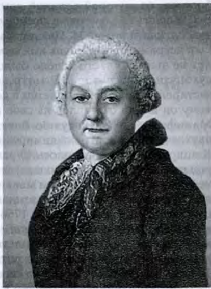
Неизвестный художник XVIII в. Портрет А.Т. Болотова