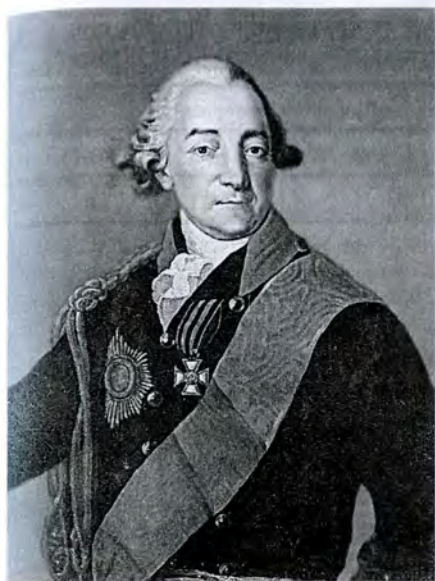
Д. Людерс. Портрет офицера конной гвардии князя И.И. Лобанова-Ростовского. 1758 г.