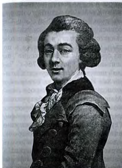
Д.Г. Левицкий. Портрет Н.А. Львова. 1794 г.