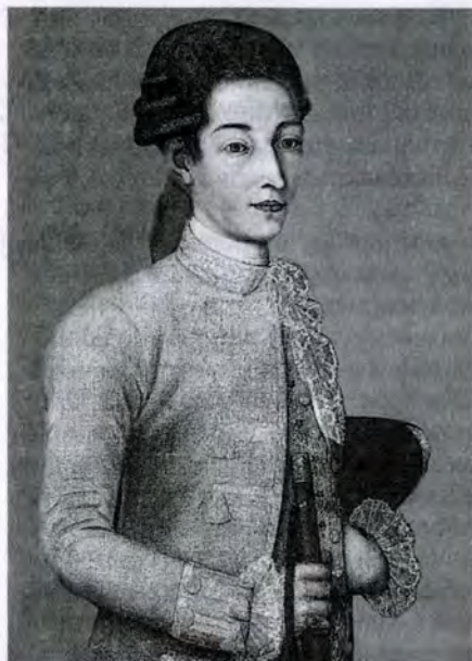
Неизвестный художник. Портрет молодого человека. 1770-е гг.