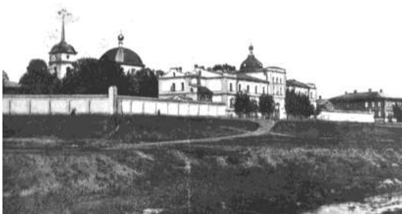
г. Тамбов. Вознесенский женский монастырь

Синод в указе моголевскому архиепископу поручил ему «...предложить женским монастырям вверенной ему епархии озаботится принятием мер к осуществлению предположения об устройстве при них учебных заведений для девочек, преимущественно духовного звания, и других