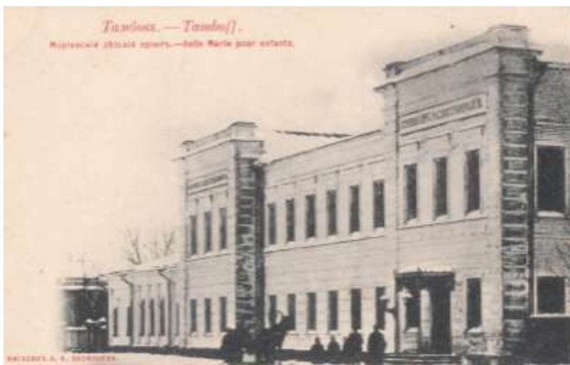
г. Тамбов. Мариинский детский приют (из фондов Тамбовского областного краеведческого музея)