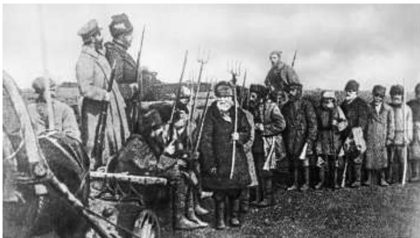
Тамбовское восстание 1918–1922 гг. под руководством А.С. Антонова