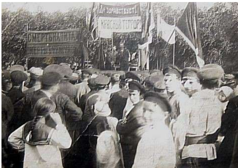
Празднование первой годовщины Октябрьской революции в г. Тамбове

которому содержание всех приютов для малолетних детей было отнесено к общегосударственным расходам, а сами они, а также санатории, колонии, учреждения для больных и дефективных детей и другие учреждения для несовершеннолетних переходили в распоряжение коллегии призрения несовершеннолетних 358 . Государство обещало взять на себя всю ответственность и расходы в деле заботы о детях-сиротах и других слабо защищенных слоях населения. Многим казалось, что, наконец, наступает обещанный большевиками «социальный рай», и все нуждающиеся и страдающие обретут поддержку, почувствуют заботу родного советского государства.