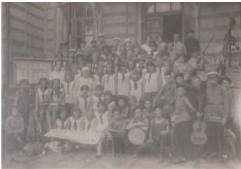
Пионеры детского дома № 4 имени Н.К. Крупской в лагере. 1929 г. (из фондов Тамбовского областного краеведческого музея)

рами, библиотекарями и пр. 391 В воспоминаниях Н.И. Сомова указывается, что «...в детских домах было плохо с питанием и материальным обеспечением» 392 .