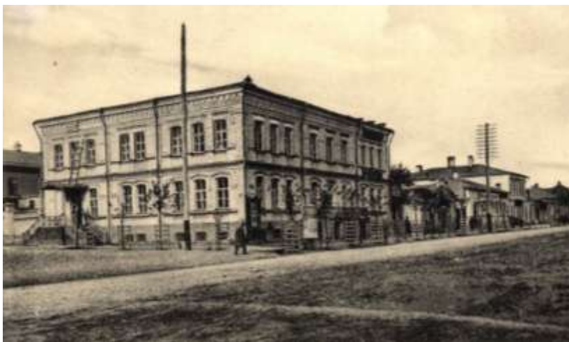
г. Тамбов. Уездное земство

Традиции по социализации, обучению и воспитанию детей-сирот активно развивались тамбовскими земскими учреждениями с момента их создания. Еще в 1867 году губернская управа при разработке правил сиротских приютов специально указала, что сироты должны обучаться первоначально в самих сиротских домах, и затем в мужской или женской гимназиях, «а тех из них, которые окажутся неспособными к учению, определять... в обучение ремеслам, для чего губернская управа полагает избрать из живущих в Тамбове ремесленников или мастериц, пользующихся хорошою репутацией, и заключить с ними контракты для обучения воспитанников или воспитанниц, с платою или бесплатно» 80 .