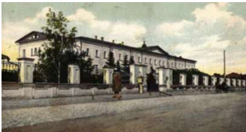
г. Тамбов. Губернская больница. Приют для подкинутых детей (из личного архива М. Климковой)

В 1899 году в приюте для подкидышей, судя по отчету тамбовского губернатора, было 185 детей, из них вновь поступивших 137. В течение года отдано на воспитание 19 человек, возвращено родителям 28, умерло 97 и остался на 1900 год 41 ребенок. Процент смертности составлял 52,4 % 69 .