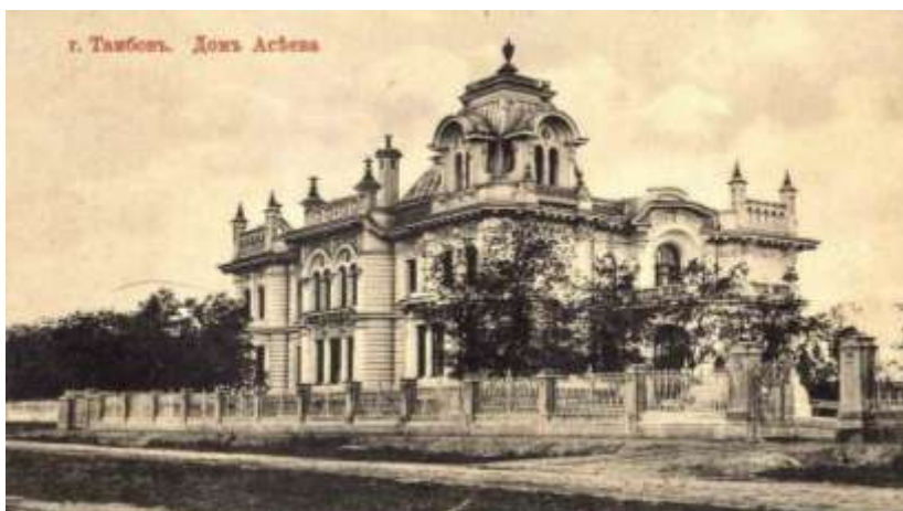
Детский дом в доме Асеевых

часто их воспитатели не знали, но понимали, что это что-то важное и имеющее значение для их судеб.