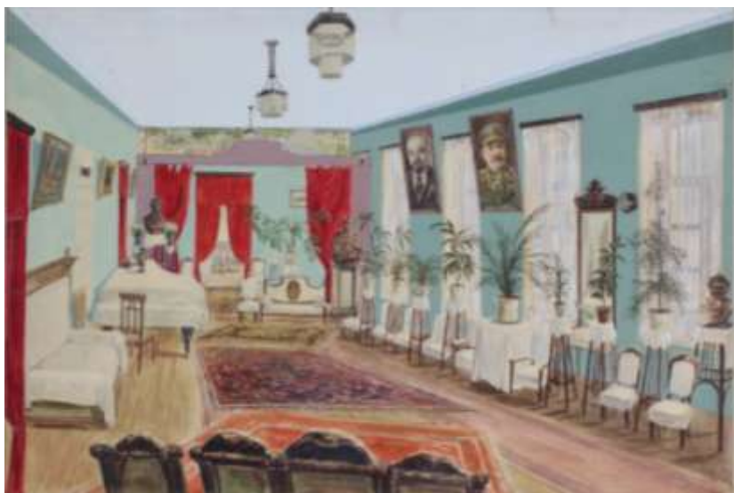
г. Тамбов. Детский дом № 8. Зал (из фондов Тамбовского областного краеведческого музея)