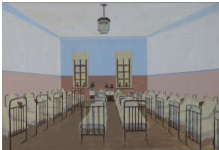
г. Тамбов. Детский дом № 8. Спальня