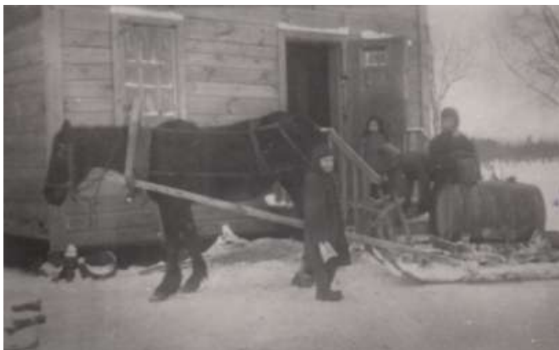
Колонисты привезли воду. Канищево. 1923 год