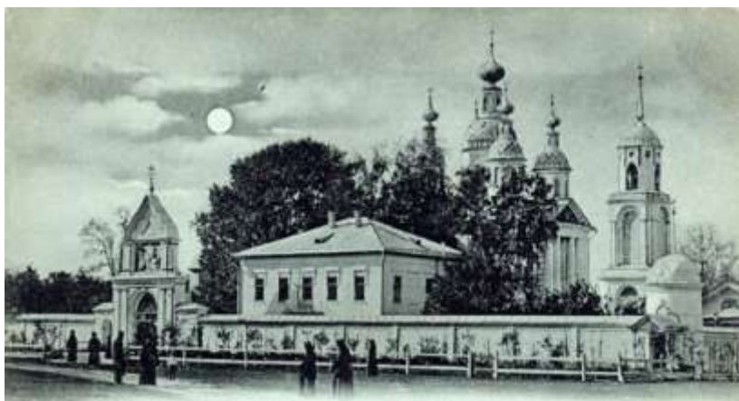
г. Тамбов. Трегуляевский Иоанно-Предтеченский мужской монастырь