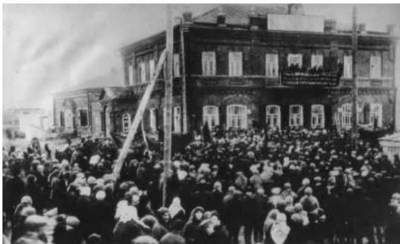
Провозглашение советской власти в Елатомском уезде Тамбовской губернии. 11 декабря 1917 г. г. Сасово, Елатомский уезд, Тамбовская губерния (ГАСПИТО. Ф. П-9248. Оп. 1. Ед. хр. 5022)

С 26 апреля 1918 года изменилось и название комиссариата, который теперь стал – Народным комиссариатом социального обеспечения РСФСР. Решения, принятые Наркоматом в 1918 году, заложили основы новой, господствовавшей в стране в течение семи последовавших десятилетий, системы государственного социального обеспечения, в которой не оставалось места для частной или общественной благотворительности.