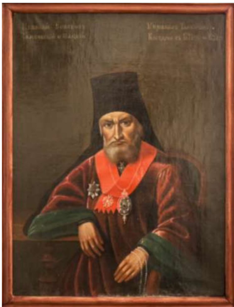
Неизвестный художник. Портрет епископа Николая (Доброхотова)

Епархиальное женское училище в Тамбовской губернии содержалось на средства духовенства и на средства своекоштных и приходящих воспитанниц. В целом содержание училища обходилось в конце 70-х гг. XIX века в