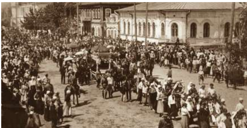
Похороны красноармейцев, погибших от рук антоновцев

ские учреждения системы социального воспитания. Всего лишь несколько лет прошло после прихода к власти большевиков, которые поставили во главу угла «классовый принцип» и пролетарское сознание. Были забыты земские правила о всесловном приеме в детские учреждения, советские лозунги о том, что «Революционная власть признала всех детей детьми Республики», «Дети – цветы жизни». Становилось очевидно, что не все дети являлись «цветами», которые произрастали на пролетарских грядках. Начали формироваться «особые» списки, в которых указывались только самые приемлемые кандидаты для домов социального воспитания.