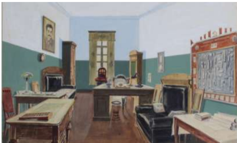
г. Тамбов. Детский дом № 8. Кабинет директора