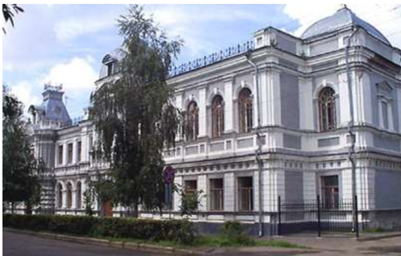
г. Тамбов. Школа-приют для слепых детей