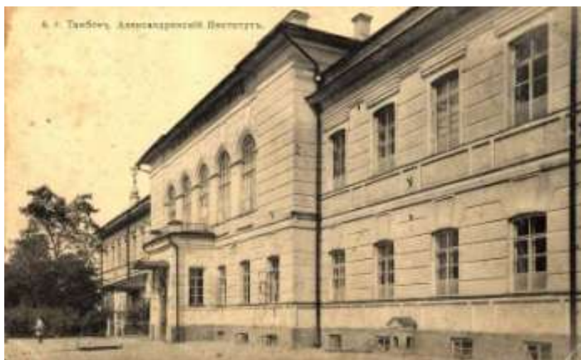
Детский дом имени Ленина (№ 1)

Но места уволенных сотрудников все же надо было кем-то заполнять. Власти пытались изначально использо-