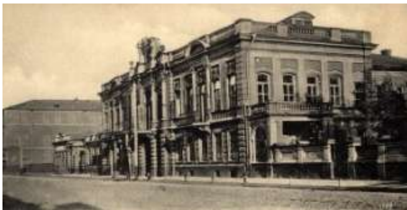
г. Тамбов. Городская управа

В Городовом положении от 12 июня 1870 года проблемы благотворительности специально не выделялись, а существовала прямая ссылка на закон о земстве. В главе 1 п. 2 «Общие положения» указывалось: «К предметам ведения городского общественного управления принадлежит: ...г) устройство за счет города благотворительных заведений и больниц и заведование ими на основаниях, указанных для земских учреждений...» 114 .