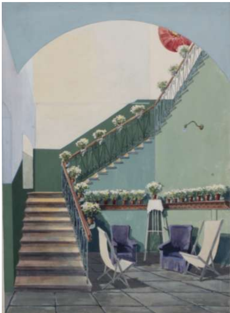
г. Тамбов. Детский дом № 8. Лестница