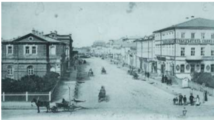
г. Тамбов. Носовская улица

В 1914 году в газете «Тамбовские отклики» был опубликован специальный сюжет о яслях: «Ясли в Тамбове были открыты 18 ноября 1904 года. Так что текущий год является годом десятилетнего существования их и, следовательно, юбилейным годом. Свою определенную физиономию ясли утратили еще в 1907 году, превратившись в особого вида трудовое убежище. При яслях был открыт небольшой интернат, существующий и по сей час, для призрения брошенных бесприютных детей. Но наряду с открытием интерната, в яслях принимались и принимаются и проходящие дети. Интернат этот не служит постоянным, до совершеннолетия воспитанника или воспитанницы, приютом, а является лишь временным пристанищем. При первой же возможности дети-интернаты размещаются по разным местным благотворительно-воспитательным учреждениям, или же, — когда удастся выхлопотать для детей-подкидышей сословный вид, — «в дети» к частным лицам. Так, за семь лет существования интерната в нем перебывало 37 детей. Все они уже размещены таким образом: 15 де-