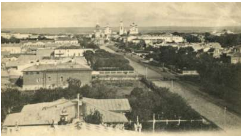
г. Тамбов. Общий вид с запада

В целом, в годы Первой мировой войны 1914–1918 гг. в Тамбовской губернии действовала разветвленная и вполне эффективная система социальной поддержки детей-сирот. Происходило удивительное сочетание и взаимодействие столичных благотворительных инициатив и региональных проявлений милосердия в отношении осиротевших детей. Можно констатировать, что общественные благотворительные и социальные мотивы по поддержке сирот были успешно реализованы и достаточно успешно выдержали испытания в условиях тотальной Первой мировой войны.