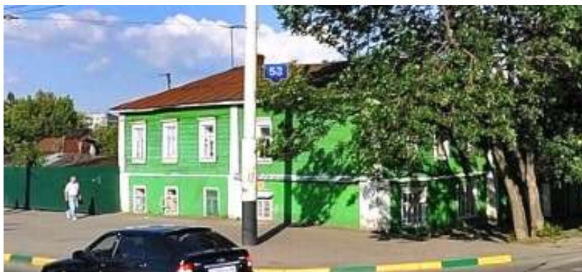
г. Тамбов. Александровский приют для арестантских детей (современное фото)

вало из приюта, когда их родители освобождались из заключения в городской тюрьме 120 .