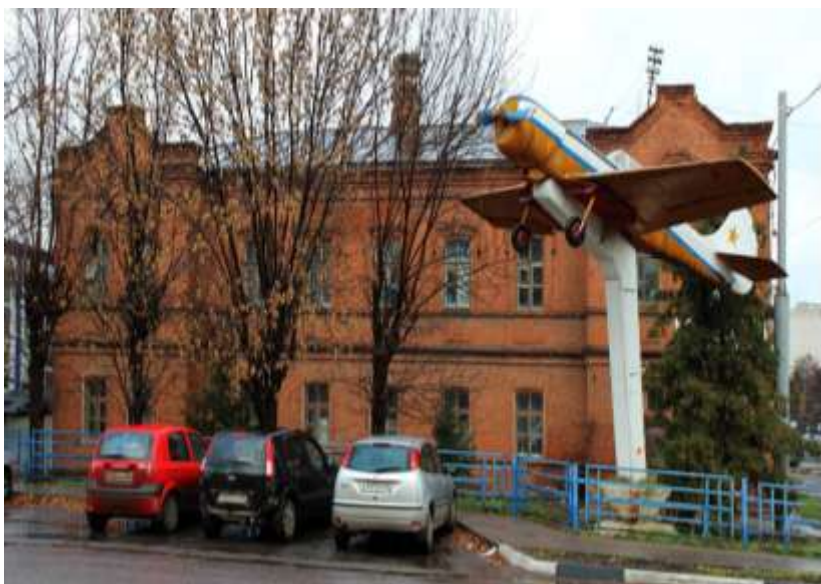
г. Тамбов. Здание дома трудолюбия

сийских благотворительных организаций, съездов, совещаний, направленных на улучшение качества социальной работы и распространение передового опыта работы наиболее эффективно действующих Московских и Санкт-Петербургских благотворительных организаций и учреждений. В целом, курирование в городах благотворительных учреждений различными ведомствами или частными лицами создавало большее разнообразие их форм и методов управления. По мнению Е.В. Барановой, пространственно благотворительные учреждения в пореформенной России стали неотъемлемой частью любого городского района 132 .