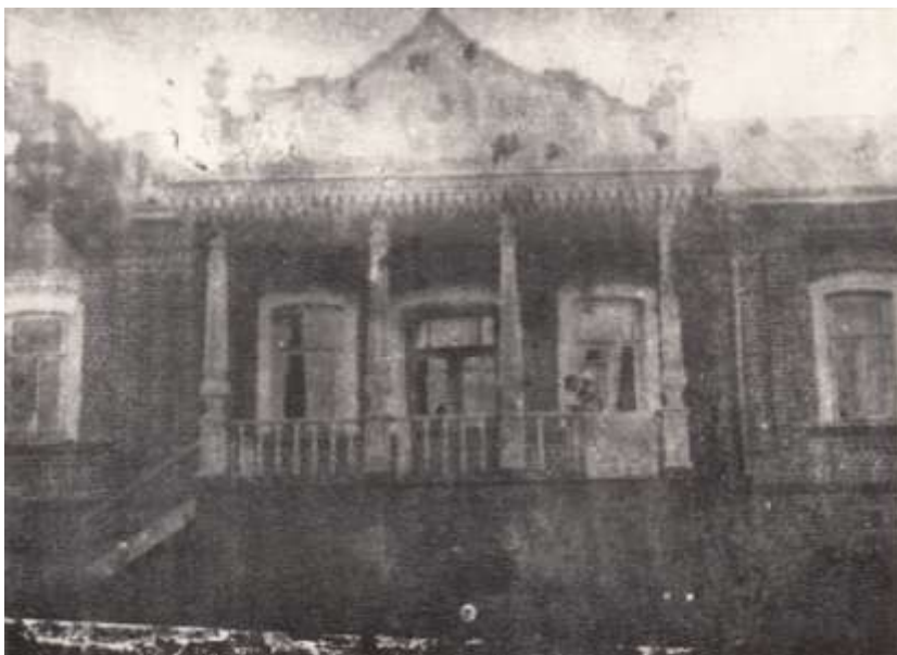
Дом, в котором жили колонисты в Канищеве. 1920 год

Все же новые власти прилагали усилия по подготовке кадров для детских домов и дошкольных учреждений. Так, в начале 1919 года уездный отдел народного образования в г. Лебедянь открыл курсы для подготовки работников по дошкольному образованию. Лицам, которые успешно оканчивали курсы, предоставлялись места в детских учреждениях 397 . Аналогичные курсы открывались в других уездах Тамбовской губернии.