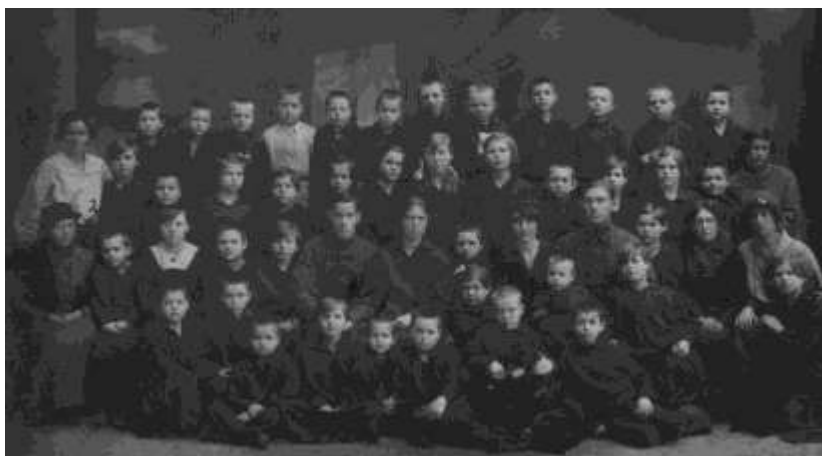
Шефы, воспитатели и воспитанники детского дома им. Чичканова. 1921 г. г. Тамбов

лись дополнительные средства для открытия детских домов. И уже 10 марта 1921 года председатель комиссии Сололова направила телеграмму в Москву в Наркомпрос с просьбой дополнительной организации шести домов ребенка и шесть детских домов для детей пострадавших от бандитизма. Всего на 1200 человек в возрасте от 0 до 17 лет...» 430 . Однако из столицы не было ни ответа, ни дополнительных средств. В результате, 16 марта 1921 года в г. Кирсанове был организован приемник для 15 детей 431 . В Тамбове в детском доме № 1 Карла Либкнехта было размещено 39 детей от 1 до 15 лет 432 .