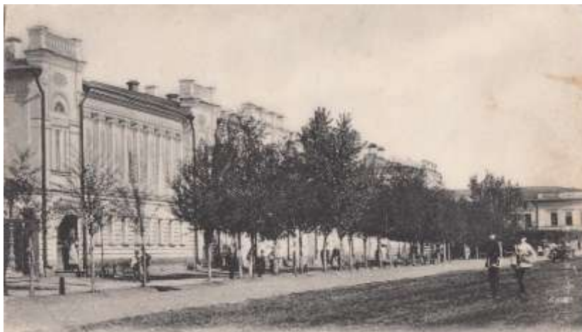
г. Тамбов. Сиротский дом