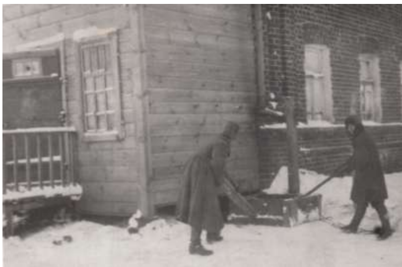
Канищево. Работа по хозяйству. 1924 год