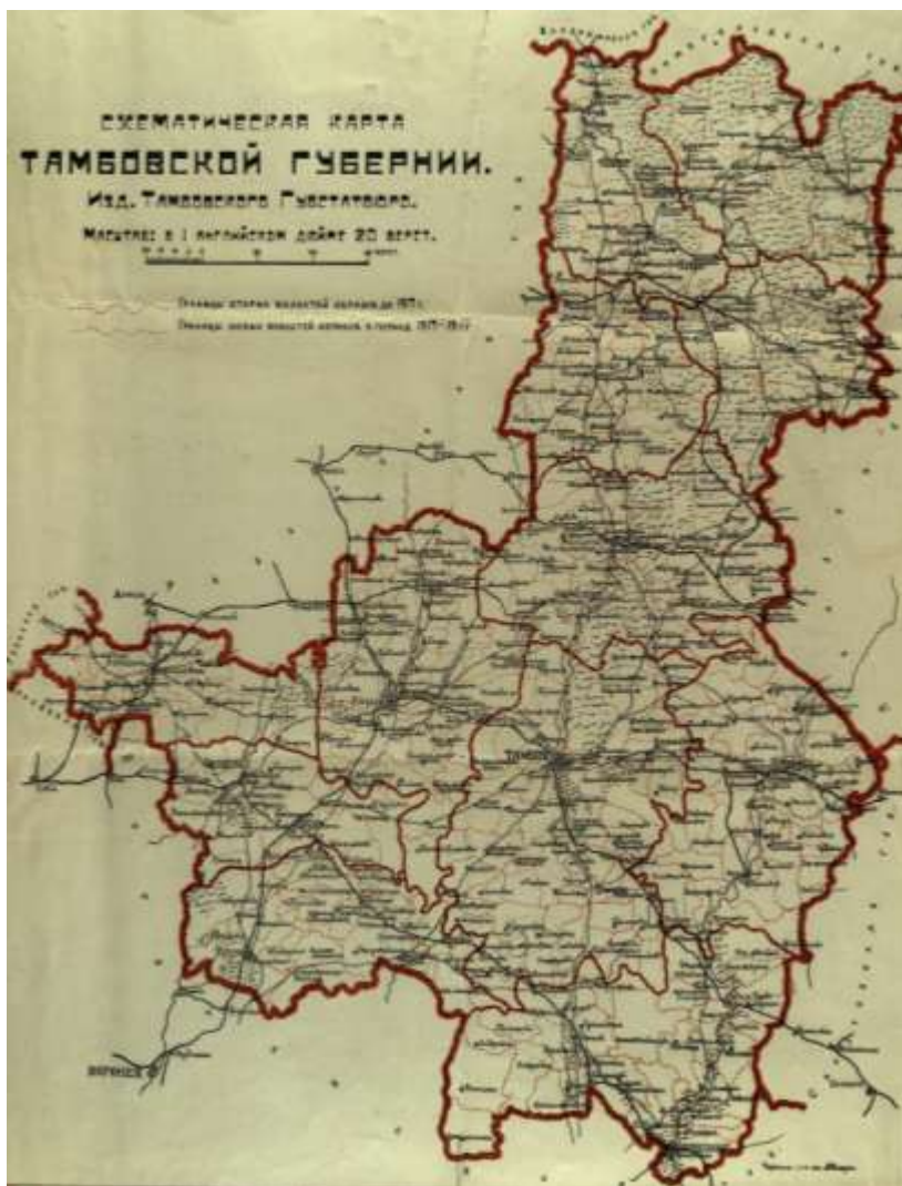
Карта Тамбовской губернии, 1919 год (из фондов ГАТО. Ф. Р-4881. Оп. 1. Д. 2)