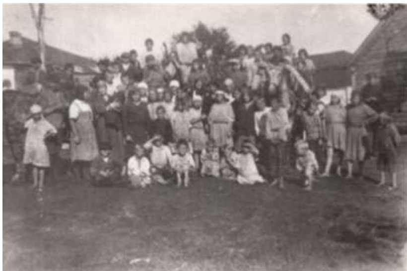
Колонисты в Канищеве. 1925 год