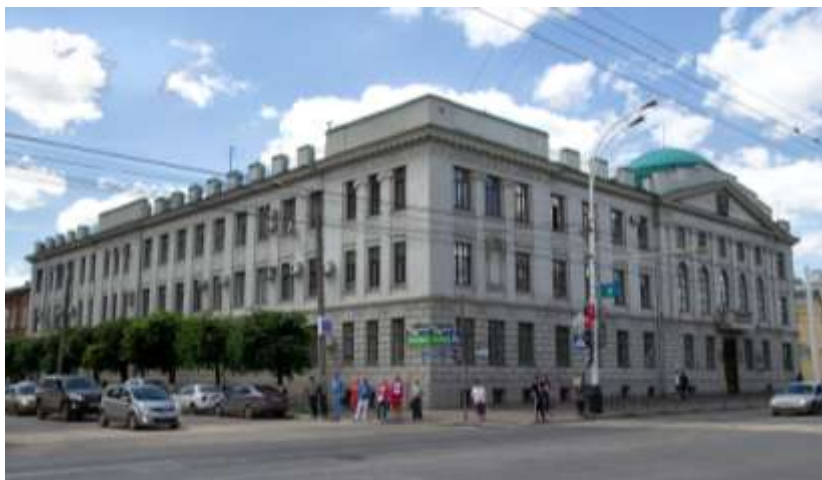
г. Тамбов. Здание Тамбовского губернского земства

Можно выделить несколько наиболее существенных направлений деятельности Тамбовского земства по поддержке детей-сирот в Тамбовской губернии в 1866–1917 гг.: