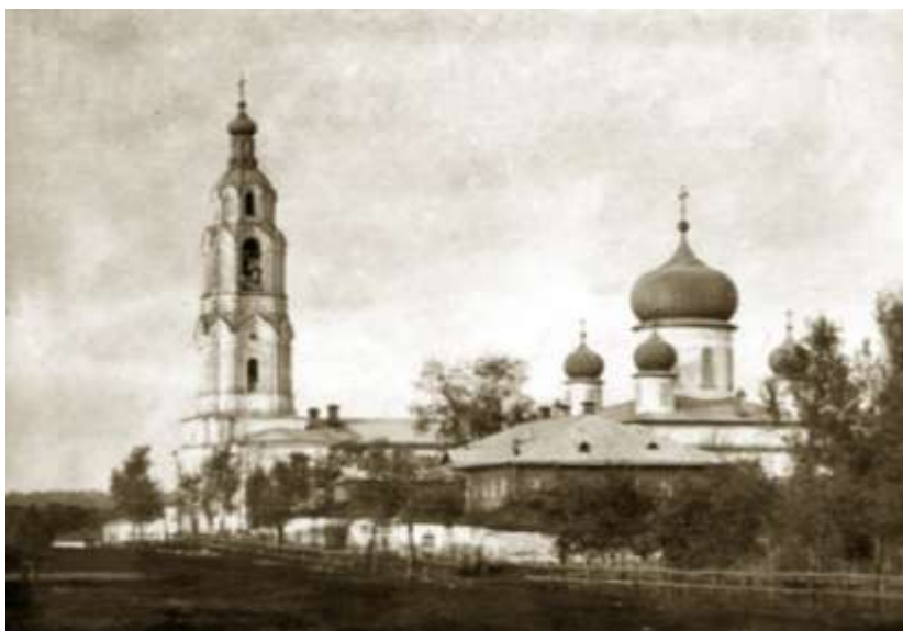
Кирсановский Тихвино-Богородицкий монастырь

Тамбовская духовная консистория, рассмотрев рапорты настоятельниц женских монастырей, приняла решение о шестилетнем курсе воспитания девиц-сирот, которые должны были поступать в училище в возрасте от 10 до 12 лет. Преподавание образовательных предметов было возложено на священнослужителей, состоящих при женских монастырях, и не должно было быть менее двух часов в день.