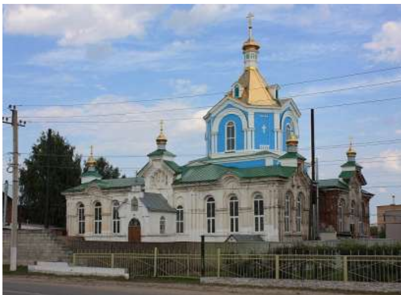
г. Кадом. Милостиво-Богородицкий женский монастырь

Примечательно, что в регионах Российской империи существовали и успешно реализовывались возможности церковной (монастырской) благотворительности, в частности приюты для детей-сирот при женских монастырях. Особенности этих приютов на всем протяжении их существования заключались в том, что они предназначались, прежде всего, для сирот из духовного ведомства, но постепенно туда стали принимать и девочек из других сословий. Заметим, что это были едва ли не единственные возможности получения девочками-сиротами образования и перспектив трудоустройства, поэтому очень важно учитывать значение этих заведений для провинциального социума.