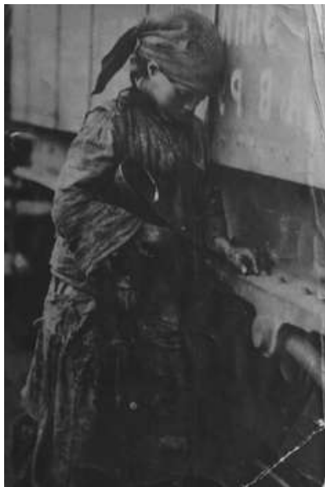
Голодающий ребенок, 1921 г., Тамбов

губздравотдела, крестьянское население многих волостей, отчаявшись выжить в условиях голодовки, покидало целыми деревнями свои насиженные места и двигалось в поисках хлеба. Главная тяжесть голода падала на детей, которые гибли в этой обстановке сотнями 443 .