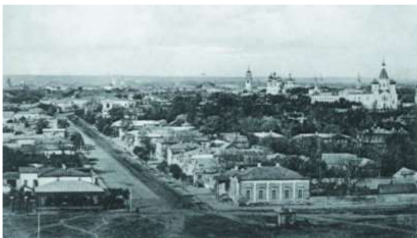
г. Тамбов. Общий вид