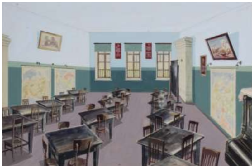
г. Тамбов. Детский дом № 8. Учебный кабинет