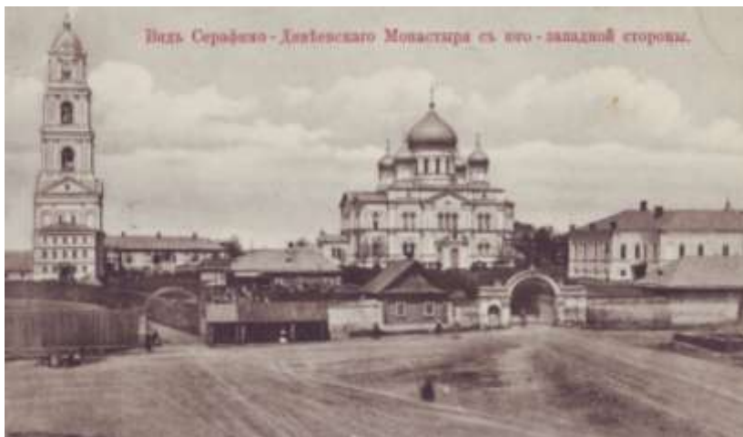
Серафимо-Дивеевский монастырь с юго-западной стороны

ница Тамбовского Сухотинского монастыря, изъявив согласие открыть монастырское училище только на 7 девочек 142 .