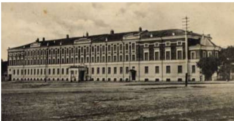
г. Тамбов. Епархиальное женское училище

иначе она не могла бы пользоваться уважением среди тех прихожан, которые обучали своих детей грамоте. Епархиальные училища являлись учреждениями, в которых девицы духовного звания получали специфическое, не имевшее аналогов, образование и воспитание, сообразное их дальнейшему образу жизни 169 . Училища для девочек духовного сословия состояли в ведении Святейшего Синода под управлением архиереев и были вверены попечению местного духовенства. Содержались они на средства, выделенные из епархиальных сумм, или на средства благотворителей 170 .