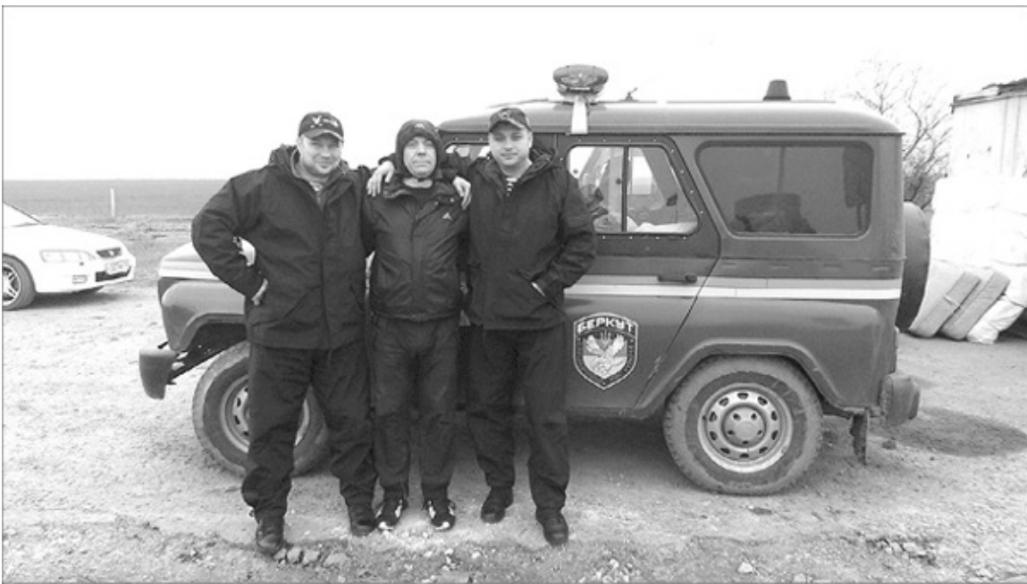
Севастопольские ополченцы на блокпосту.