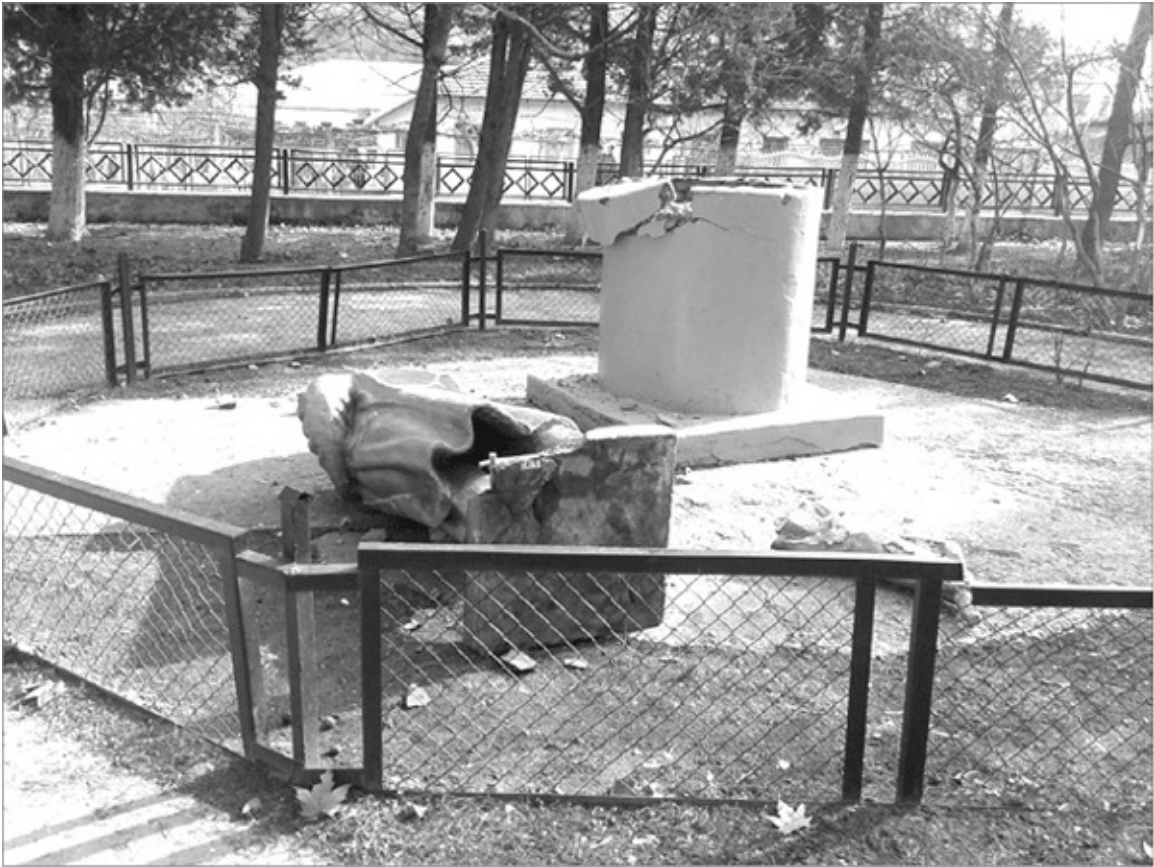
Разрушенный 22 февраля 2014 г. памятник Ленину под Алуштой