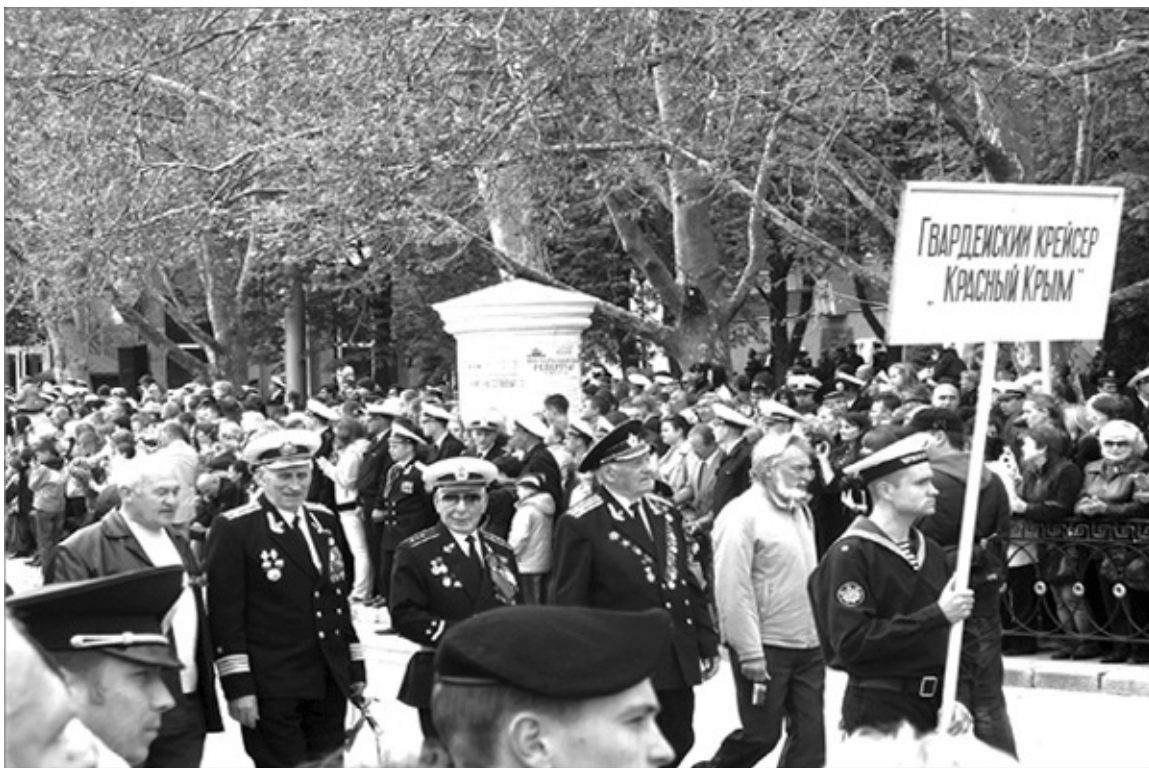
Парад в Севастополе 9 мая 2012 г.