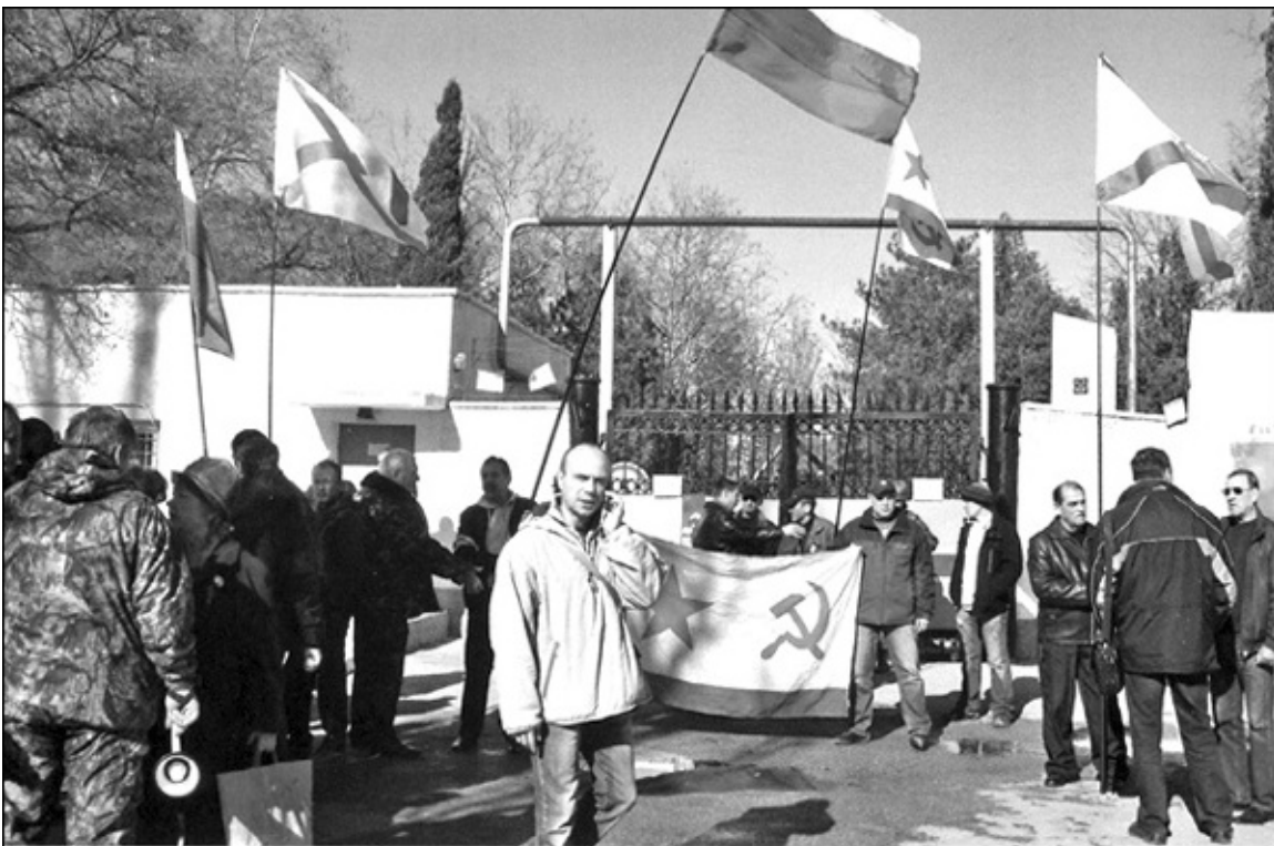
Севастопольцы у штаба ВМСУ. 3 марта 2014 г.