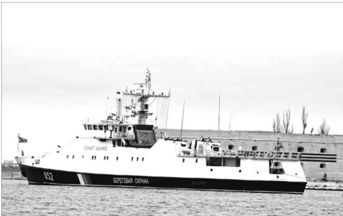
ПСКР «Жемчуг» 9 мая 2015 г. на фоне Константиновской батареи.