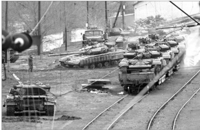
Вывод украинской бронетехники из Крыма. 27 марта 2014 г.