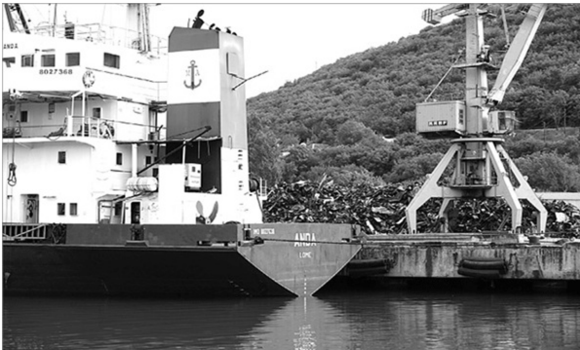
Блокадопрерыватель-сухогруз «Анда» под флагом Того, порт приписки Ломе, грузит железный лом в Инкермане. 12 мая 2015 г.