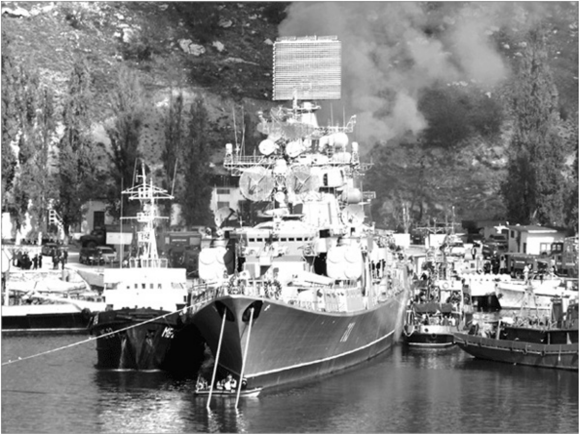
Пожар на БПК «Керчь» 4 октября 2014 г.