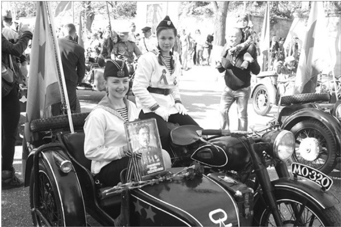
Участницы акции «Бессмертный полк». Севастополь. 9 мая 2015 г.