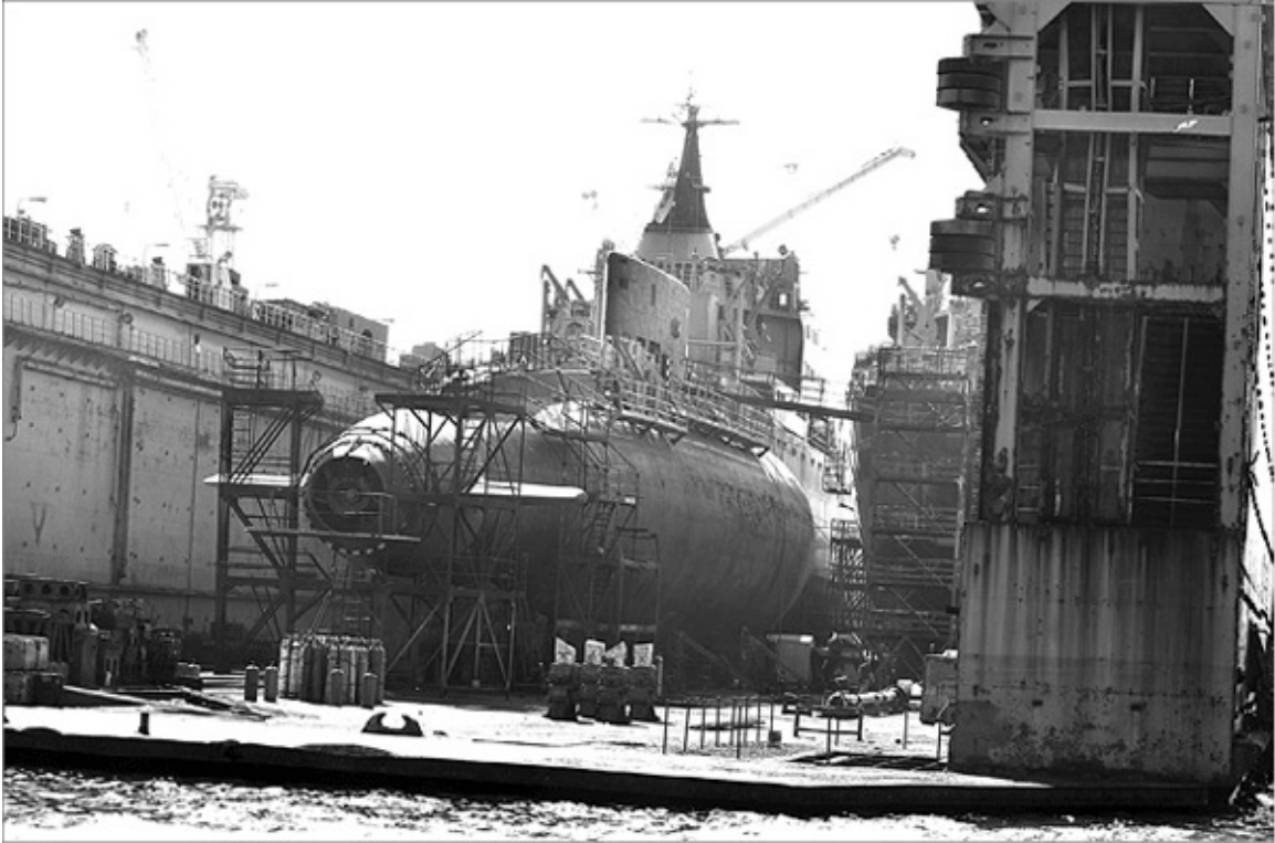
Подводная лодка «Алроса» в бесконечном ремонте в плавдоке ПД-30.