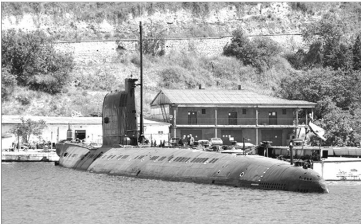
Подводная лодка «Запорожье».