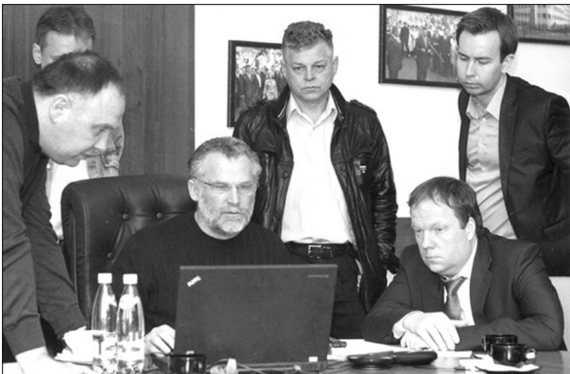
Работа в Координационном совете. 4 марта 2014 г.