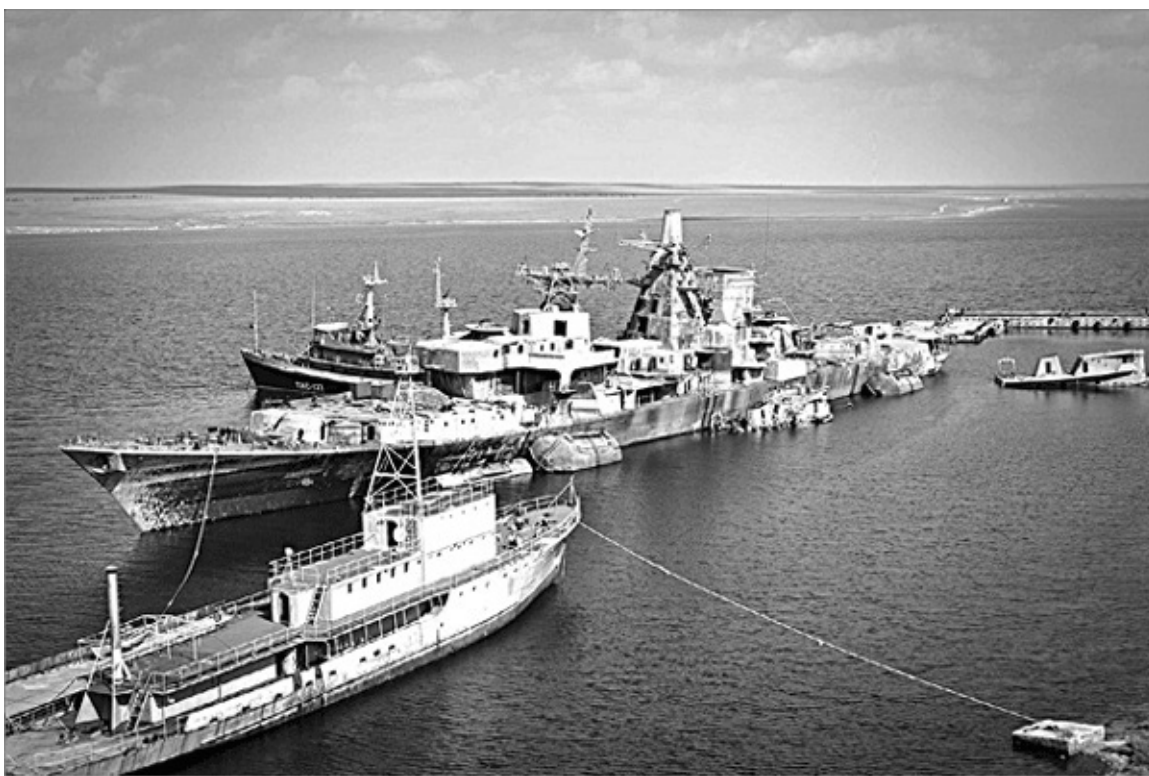
Наконец-то «Очаков» подняли.