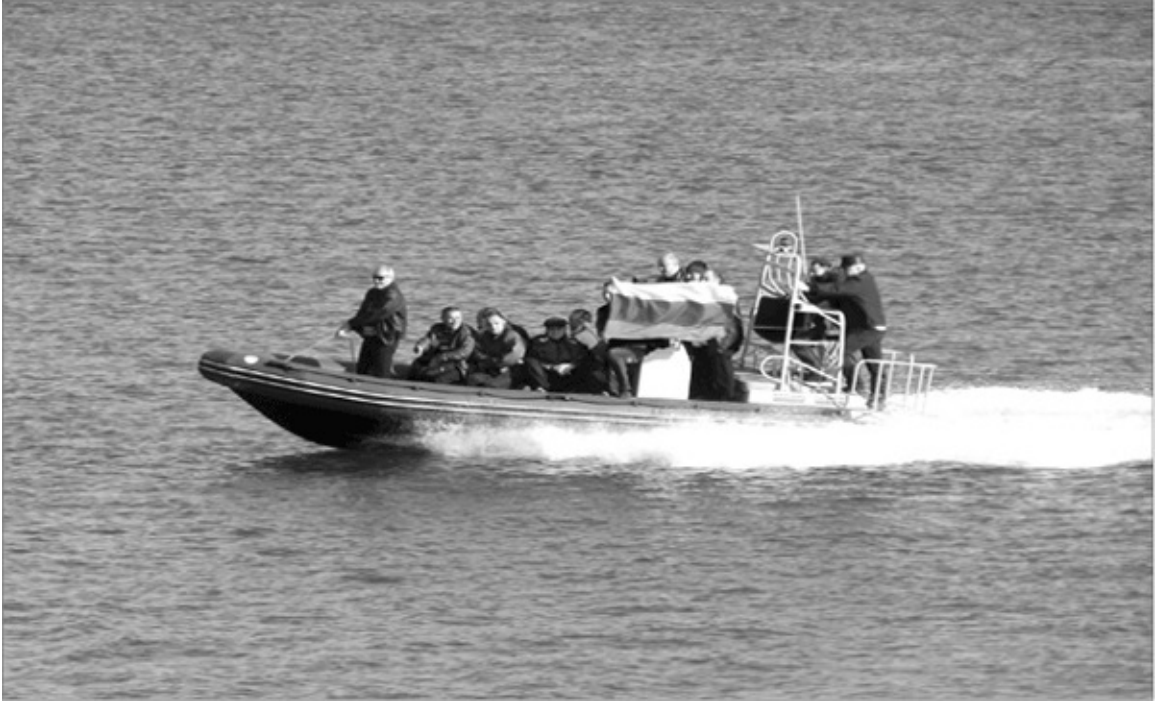
Севастопольские ополченцы идут на штурм. 19 марта 2014 г.