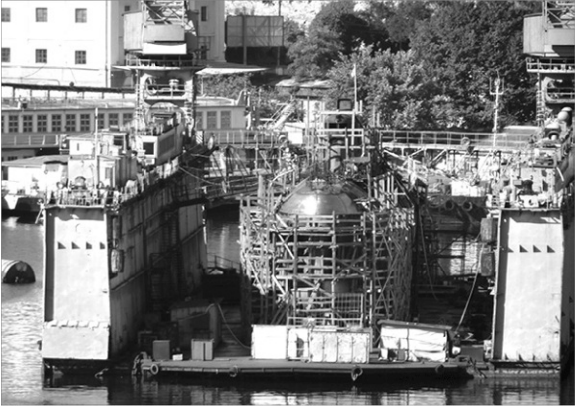
Подводная лодка «Святой Георгий» 20 лет стоит в трофейном германском доке ПД-6. Вывести ее невозможно без разрушения дока.