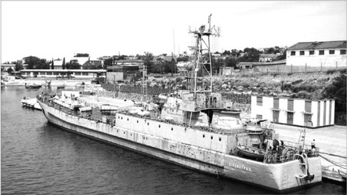
СДК «Кировоград» захвачен «вежливыми людьми» в Донузлаве и отведен к берегу