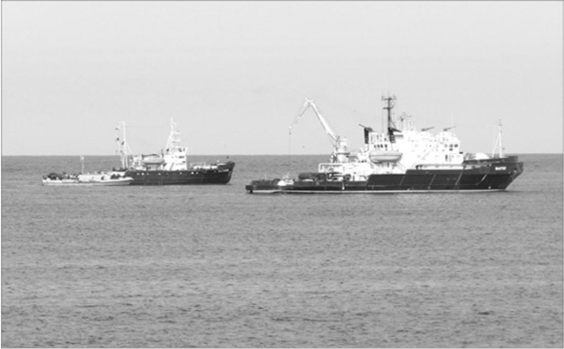
Буксиры «Шахтер» и МБ-173 — гроза украинского флота — перекрыли выход из Севастопольской бухты. 11 марта 2014 г.