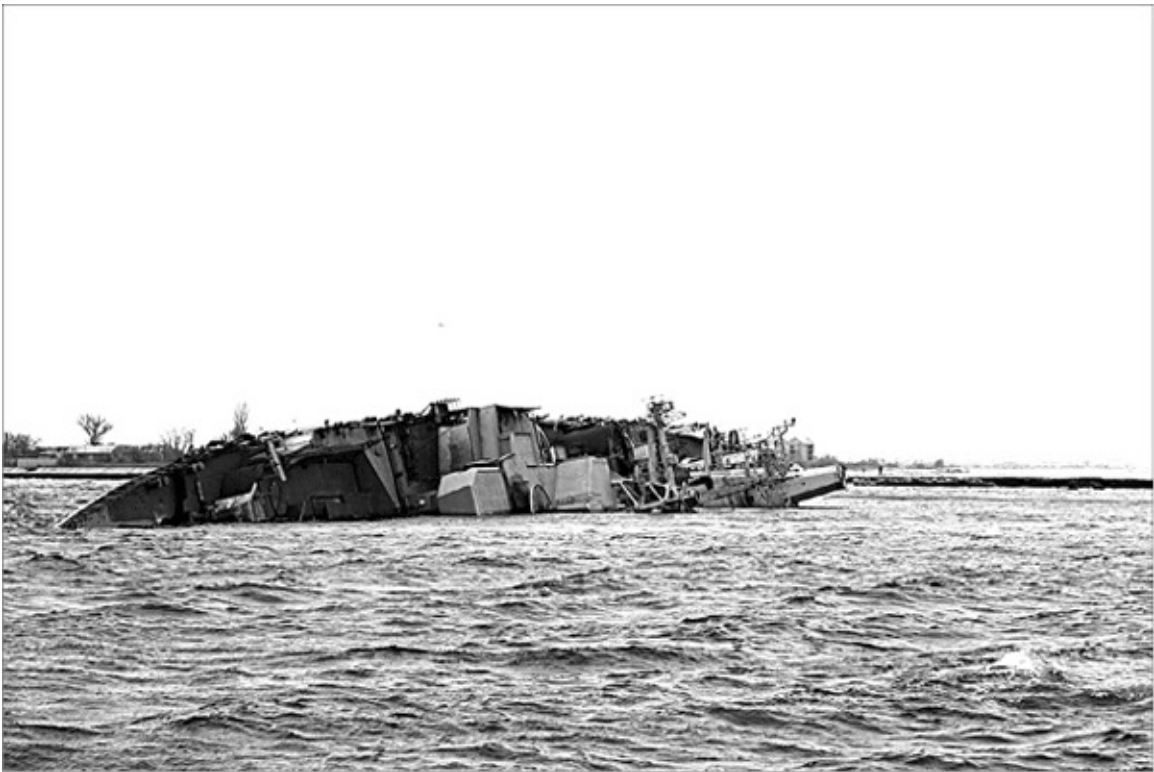
БПК «Очаков» затоплен в Донузлаве.