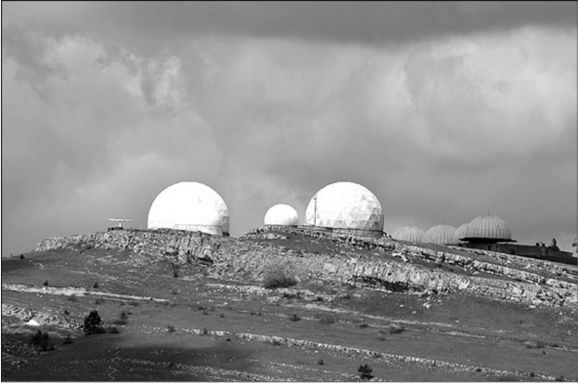
Радиолокационный комплекс «Ай-Петри» держит под контролем все Черное море, Турцию, Болгарию, Румынию.