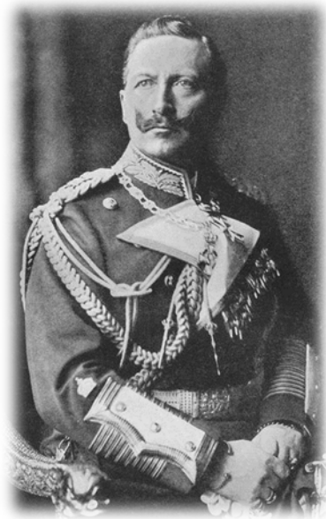
Фото в любимом стиле: военная форма и решительный взгляд

Второстепенные военные «добродетели» и доблести выходили на первый план. Среди гражданского населения приветствовались бравая военная выправка и испепеляющий взгляд, а в армии – сверкающие чистотой сапоги и опрятная форма. За невычищенную до блеска обувь или «некорректно сидящий» мундир могли наказать недельным заключением в карцере на воде и хлебе 1 .