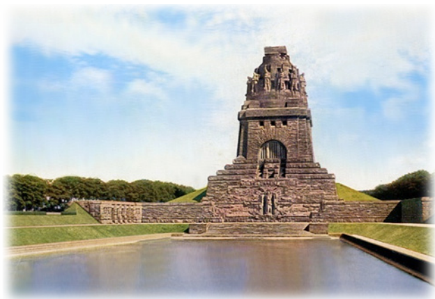
Памятник битве народов

Наиболее активным участником патриотических объединений выступала интеллигенция. Так, в 1894 г. появился «Немецкий союз патриотов», основанный архитектором Клеменсом Тиме. Лейпцигский архитектор сотоварищи преследовал культурные цели: сбор средств на строительство памятника в честь битвы народов под Лейпцигом. Проект оказался столь грандиозным, что потребовал серьёзных материальных вложений. За несколько лет с помощью лотереи и пожертвований союзу удалось собрать необходимую сумму и воздвигнуть впечатляющий монумент.