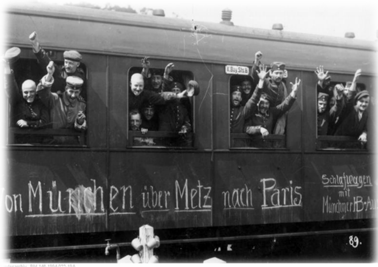
Немцы отправляются на Первую мировую войну – «из Мюнхена в Париж»

– А какое удостоверение он тебе показал? Муж простодушно ответил: – Удостоверение? Да никакого. Он же капитан. 1