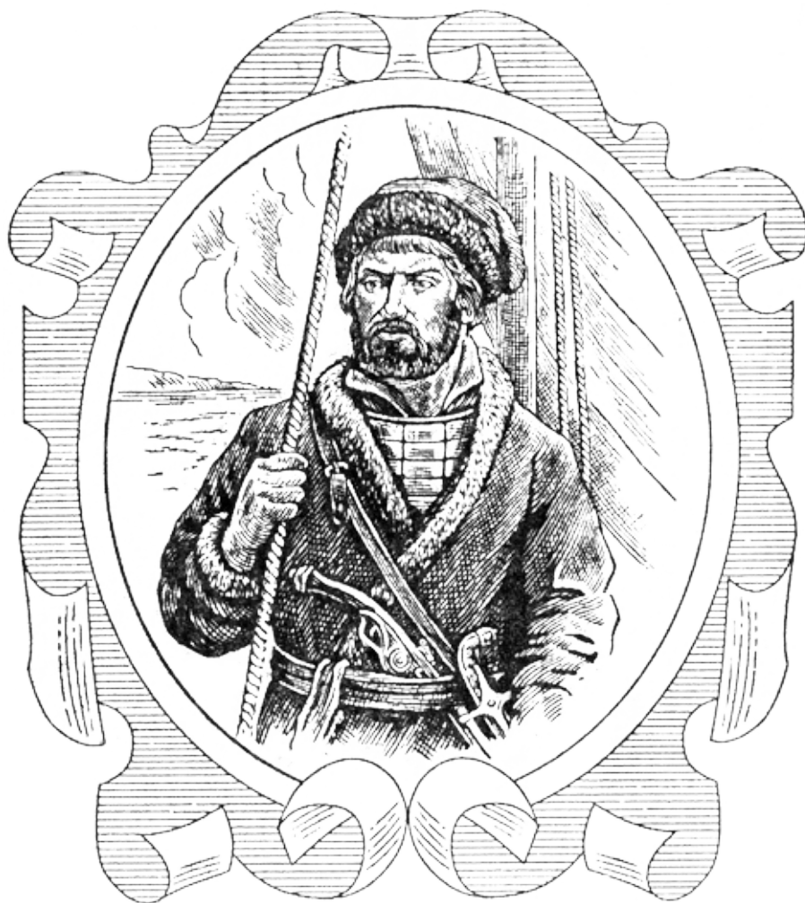
Ерофей Павлович ХАБАРОВ ок. 1605 – 1671