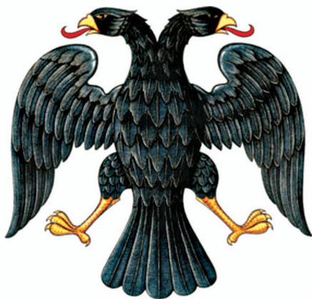
рис.17 Герб 1917 года (художник И.Я.Билибин)