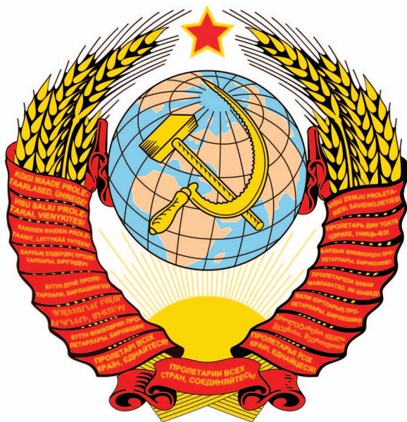
рис.20 Государственный герб СССР