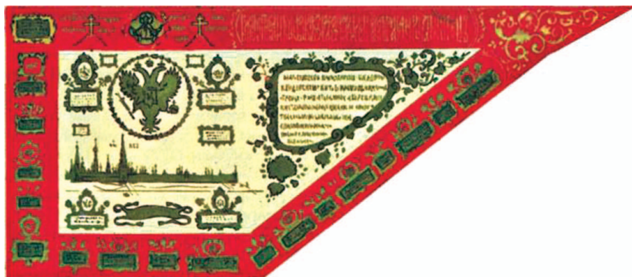
рис.23 Гербовое знамя Алексея Михайловича