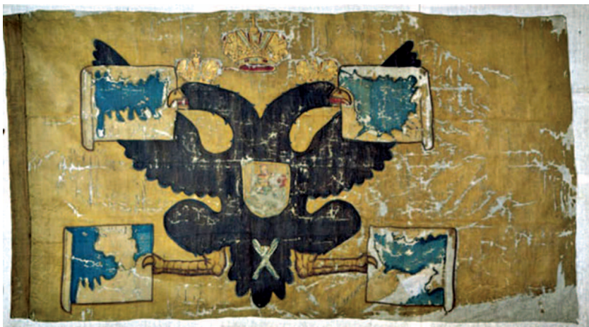
рис.25 Морской штандарт с четырьмя картами Петра I