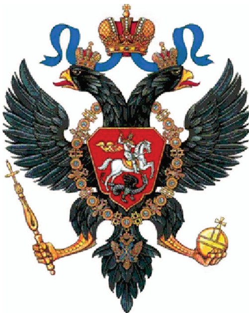
рис.8 Герб Петра I