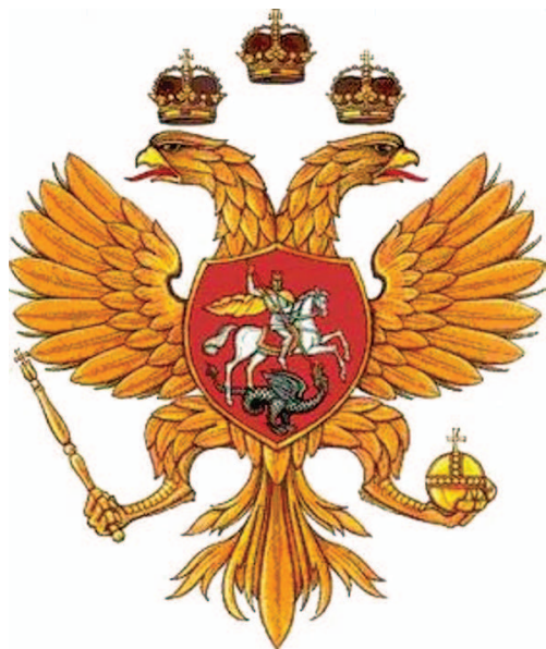
рис.7 Герб первых Романовых