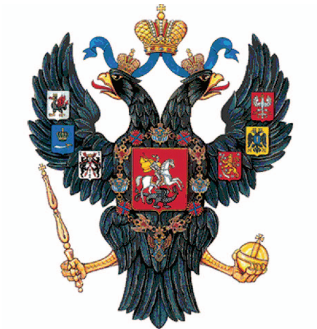
рис.13 Герб Николая I