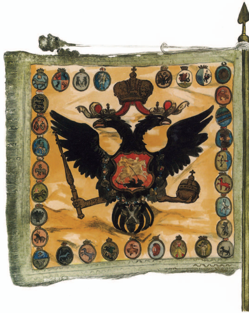
рис.29 Государственное знамя Российской империи 1742-1856 ГОДОВ