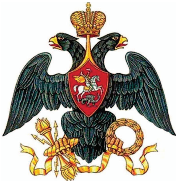
рис.12 Герб Александра I