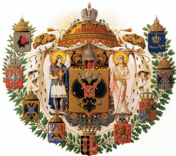
рис.15 Средний Герб России (Александр I)