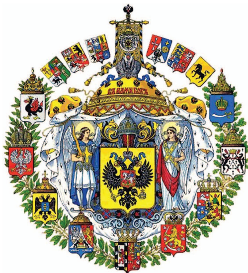
рис.14 Большой Герб России (Александр I)