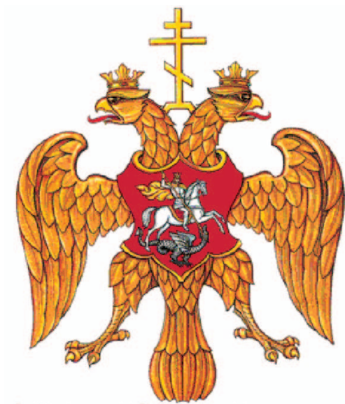
рис.5 Герб Федера Иоанновича