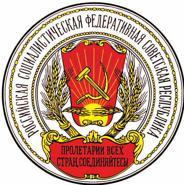
рис.18 Герб Р.С.Ф.С.Р. 1918 года (художник С.В.Чехонин)