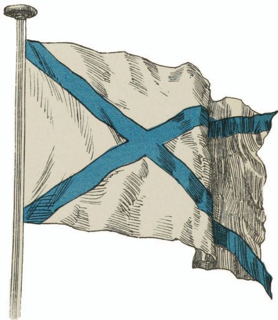
рис.27 Первый адмиральский флаг с Андреевским крестом (1720 год)