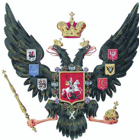
рис.9 Герб Петра I (со Св. Георгием на щите)