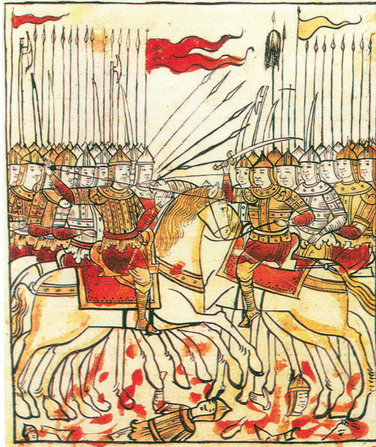
рис.21 Самые ранние русские знамена/стяги