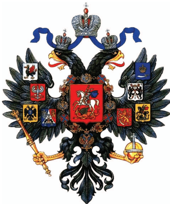
рис.16 Малый Герб России (Александр I)