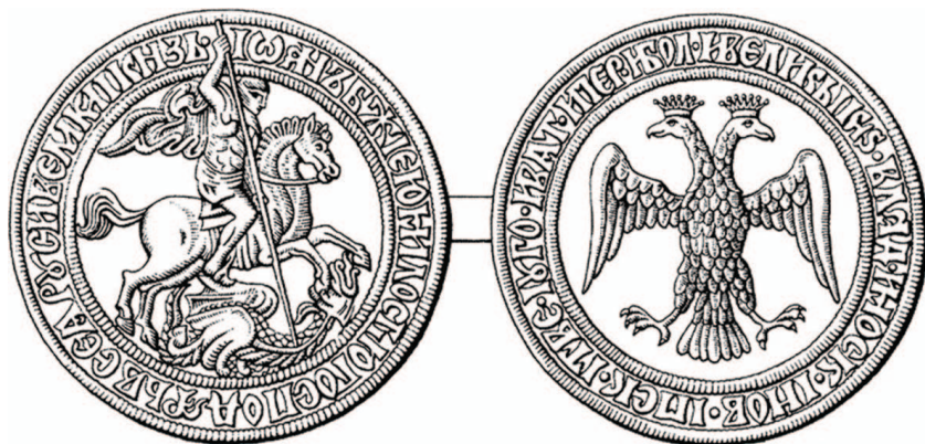
рис.1 Печать Ивана III