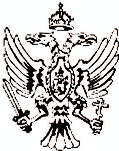
рис.4 Герб Ивана IV Грозного