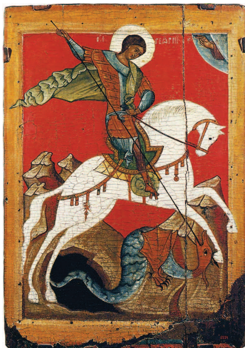
рис.2 Икона Св. Георгия, поражающего копием змия