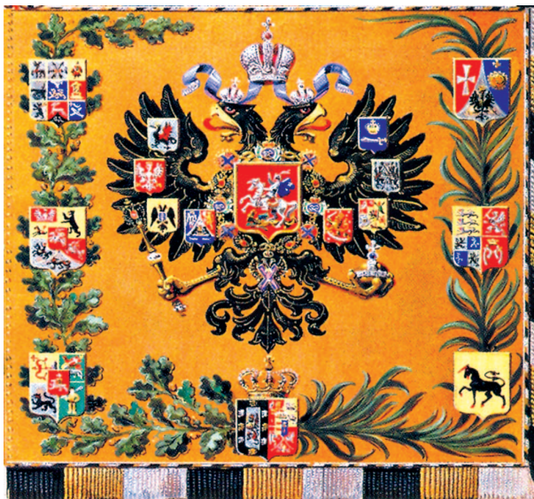
рис.30 Государственное знамя Российской империи 1856-1917 ГОДОВ