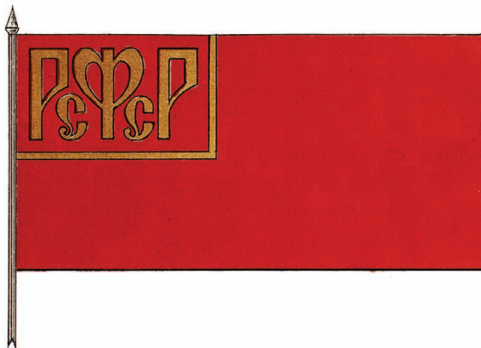
рис.31 Флаг Р.С.Ф.С.Р. 1918-1920 годов