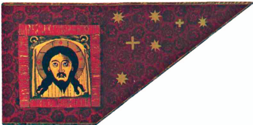
рис.22 Большое царское знамя царя Ивана IV Грозного с изображением лика Иисуса Христа (Спас Нерукотворный)