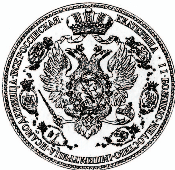
рис.10 Герб Екатерины II