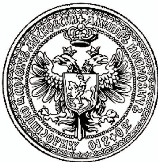
рис.6 Печать Лжедмитрия I