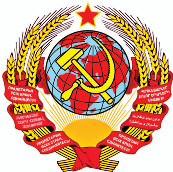
рис.19 Первый государственный герб СССР