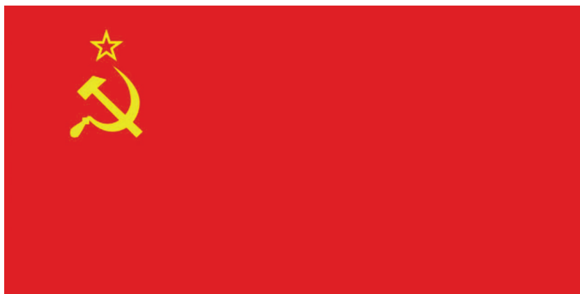
рис.32 Государственный флаг Союза Советских Социалистических Республик – СССР, утвержденный Конституцией СССР 1936 года