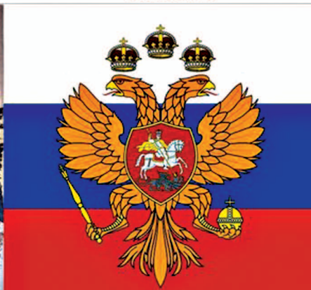
рис.24 Российский триколор с гербом - первый государственный флаг России