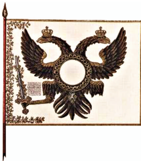
рис.26 Знамя Преображенского полка (1700 год)