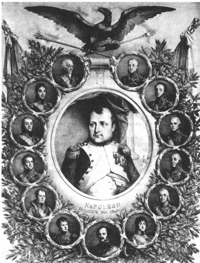
Наполеон и его маршалы