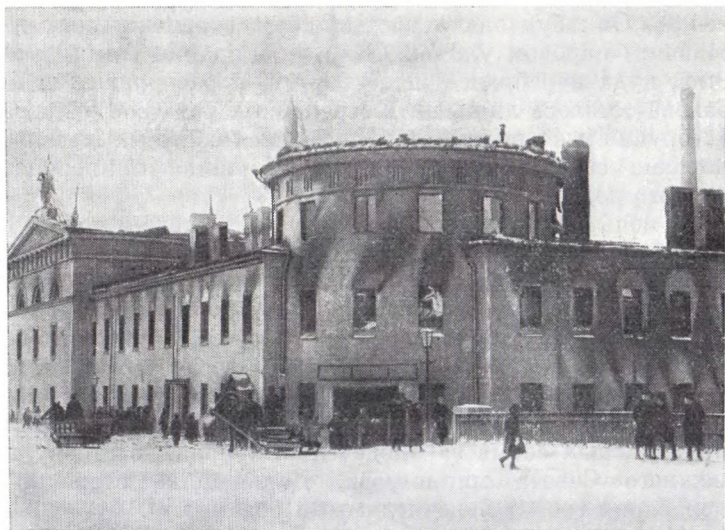
Здание тюрьмы «Литовский замок», сожженное в дни Февральской революции. Петроград, 1917 г.

Находившиеся в Мариинском дворце министры царского правительства, ожидая распоряжений от императора и Ставки, долго не расходились в этот день. Уже часов в одиннадцать они услышали приближение восставших, выстрелы. Кто-то бросил камень в окно... Тревожно ждали нападения, погасили огни. Однако вооруженный отряд прошел мимо. «После появления света я, к своему удивлению, оказался под столом» 129 , — рассказывал впоследствии один из министров. Вооруженная защита, затребованная из Штаба военного округа для охраны Мариинского дворца, не прибыла.