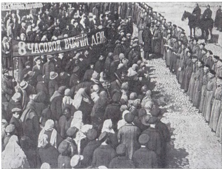
Демонстрация женщин на улицах Петрограда