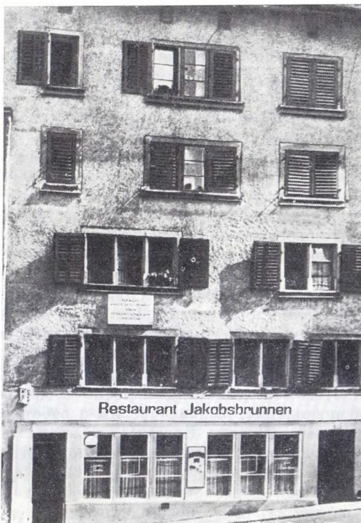
Дом на Шпигельштрассе, 14, в Цюрихе, где жил В. И. Ленин в феврале 1916 — марте 1917 г.

ние» (как определила его Н. К. Крупская в письме к В. А. Карпинскому) рабочих в России весной 1916 г. 111