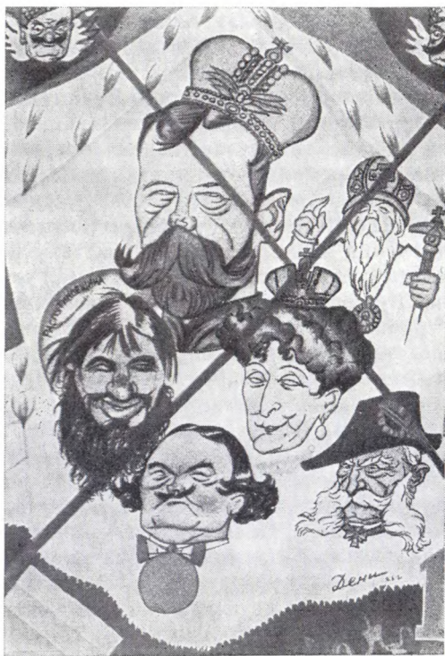
Карикатура В. Дени «Те, кто управляет Россией»

митета Думы Гучков и Шульгин. Они действительно прибыли в Псков и подтвердили царю, что ни у старого правительства, ни у Временного комитета нет ни одной воинской части, на которую можно было бы рассчитывать. И вот в ночь со 2 на 3 марта в вагоне-кабинете царского поезда произошла сцена отречения Николая II. В присутствии министра двора Фредерикса, генералов Рузского и Данилова царь подал Гучкову четвертушки бумаги, какие употреблялись для типографских бланков,— два экземпляра нового варианта манифеста об отречении.