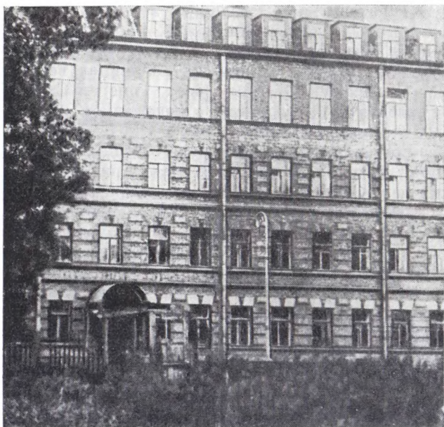
Дом в Петрограде на Сердобольской ул., 35, где размещалось Русское бюро ЦК РСДРП в конце 1916 — начале 1917 г.