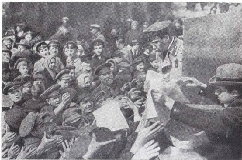
Раздача печатных изданий в дни Февральской революции в Москве

ройство общества, слабо разбирались в позициях различных партий. Многие из рабочих, не говоря уже о солдатах и представителях непролетарских слоев населения, на первых порах почти с одинаковым энтузиазмом поддерживали самые различные партийные направления, организации и группы. В результате возникли организационные комитеты весьма разнородного классового и партийного состава. В то время как большевики в Москве держали твердый курс на ведущую роль рабочих в борьбе за демократические свободы, за Советы, меньшевики и эсеры обратились с этим к буржуазии. Последняя же ориентировалась на Временный комитет Государственной думы в Петрограде.