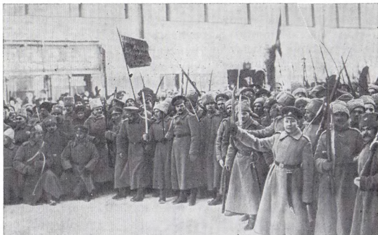
Восставшие части Петроградского гарнизона на улицах города. Февраль 1917 г.

Петроград был охвачен пламенем вооруженного восстания. Во всеобщей политической стачке участвовали почти все (98%) рабочие заводов и фабрик столицы и ее окрестностей 126 . Рабочие овладели полностью Нарвским районом. В полдень многочисленная группа путиловцев проникла на территорию резиновой мануфактуры «Треугольник», которая еще не включилась в борьбу. Основную массу рабочих ( \frac{2}{3} из более чем 15 тыс. человек) составляли здесь политически неопытные женщины-работницы. В мастерских мануфактуры работало до 3 тыс. рабочих-литовцев, вести агитацию среди которых в определенной степени мешал языковой барьер. Следует отметить также организационную слабость здесь большевистской ячейки: двум десяткам большевиков на «Треугольнике» противостояла эсеровская организация, в которую было записано несколько тысяч членов; кроме того, 150 рабочих были меньшевиками 127 . Все это не могло не сказаться на медленной раскатке рабочих, присоединении их ко всеобщей стачке. Однако на пятый день революции призыв путиловцев сделал свое дело — весь коллектив мануфактуры забастовал, часть рабочих вышла на улицу и, построившись в колонну вместе с рабочими с соседнего химического завода, во главе с путиловцами устреми-