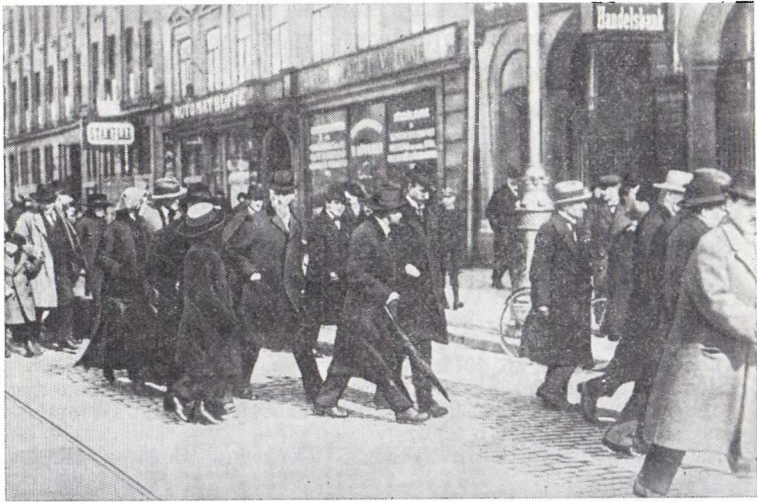
На пути в Россию... Ленин в Стокгольме. Апрель 1917 г.