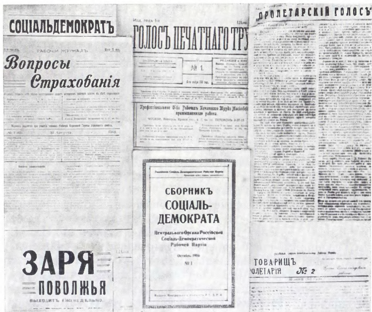
Незаконные и законные органы большевиков, выходившие в 1914—1916 гг. (монтаж)

ареста и суда над депутатами IV Государственной думы и т. п. В листовках перепечатывались документы ЦК РСДРП, материалы международных конференций интернационалистов 130а .