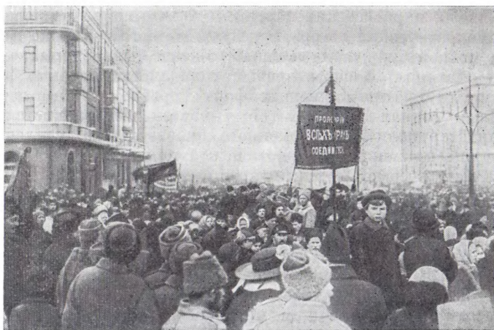
Демонстрация в дни Февральской революции с призывом «Пролетарии всех стран, соединяйтесь!» в Москве

примеру. Выйдите из прусско-германского мрака к сияющей свободе народа! Откажитесь работать — и кровопролитие прекратится!» 81