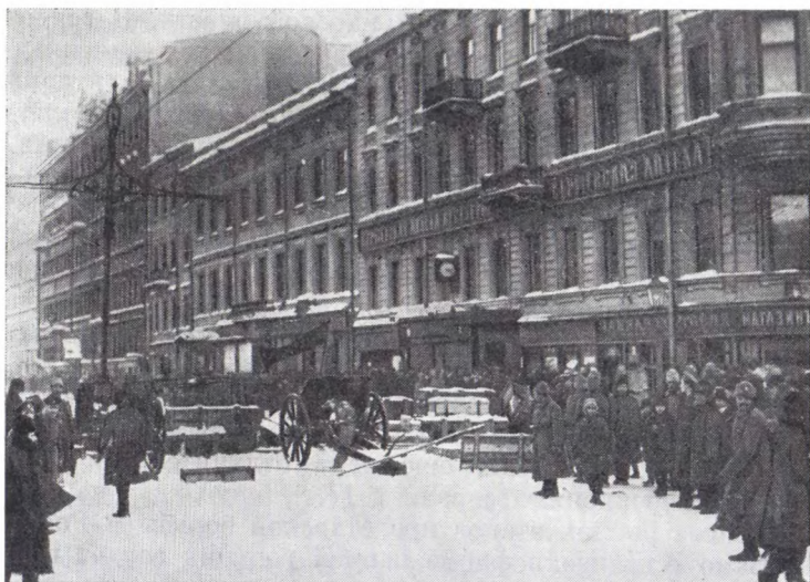
Баррикады на Литейном проспекте в Петрограде. Февраль 1917 г.

Раннее утро 27 февраля началось с массового вооружения рабочих во всех районах столицы и создания боевых отрядов, тут же приступивших к захвату стратегических объектов в городе. С помощью первых групп восставших солдат рабочие после недолгого боя захватили склады боеприпасов в Главном арсенале и Главное артиллерийское управление на Литейном проспекте. Здесь было разобрано около 40 тыс. винтовок и 30 тыс. револьверов. В районе Лесного оружие распределялось между рабочими всех пролетарских районов. Оно выдавалось с Охтепских пороховых складов, со складов Завода точных механических изделий. Большие партии боеприпасов с Патронного завода были переброшены на автомобилях в другие районы города.