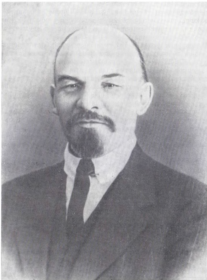
В. И. ЛЕНИН. Швейцария. Цюрих, 1917 г.