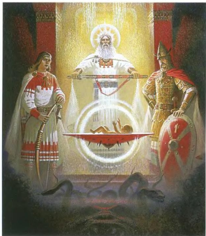
Б. Олыанский «Рождение Воинна»

В результате всех этих изменений в русо-арийском обществе создались условия для перехода к государству. Следовательно, переход от Державного устройства общественной жизни к государству является, прежде всего, результатом духовно-нравственной деградации значительной части рунов и ариев. Всё вышесказанное необходимо знать тем, кто желает возродить Державу.