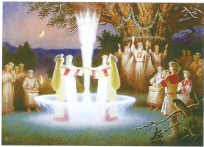
Б. Олышанский «Ночь на Купалу»

Данные идейные основы сформулированы в обобщённом порядке, чтобы можно было по мере развития событий и расширения деятельности движения дополнять их новыми программами и направлениями деятельности. Вступить в движение «Возрождение» и принять активное участие в его деятельности может каждый гражданин нашей страны, любая общественная или политическая организация, если они согласны с данными основами в целом либо желают участвовать в каком-то одном направлении деятельности.