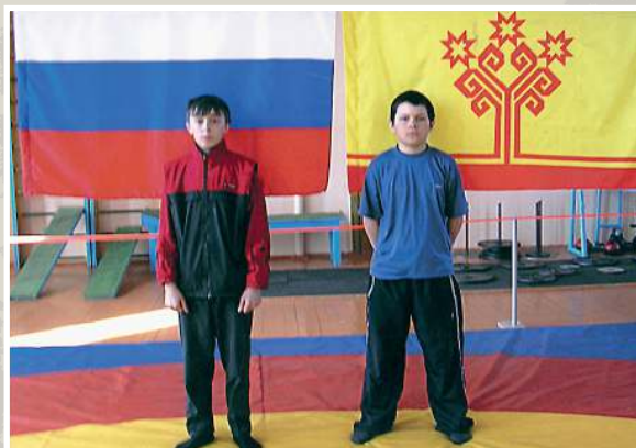
Пермские спортсмены из деревни Дойной Куединского района на соревнованиях по национальной борьбе керешу в г. Чебоксары, 2004 год