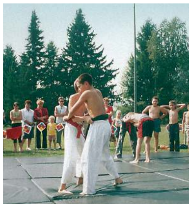
Национальная чувашская борьба керешу. Деревня Дойная Куединского района, 2007 год

Особый период лета, соотнесённый со временем цветения злаков, был известен как синсе , с ним связывались запреты на работу с землёй, не разрешалось копать, па-