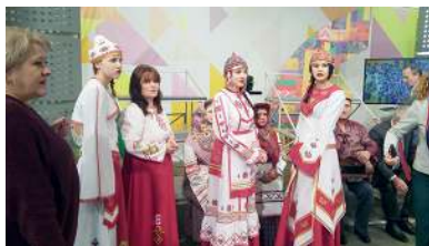
Участники чувашского фольклорного коллектива на передаче, посвящённой юбилею Пермского края. г. Пермь, 2017 год

Пермского федерального исследовательского центра УрО РАН. В ходе этнографических исследований состоялись экспедиционные выезды в Куединский, Чайковский, Октябрьский, Чернушинский районы Пермского края, территории, где отмечена наибольшая численность чувашского сельского населения и где сохраняются насе-