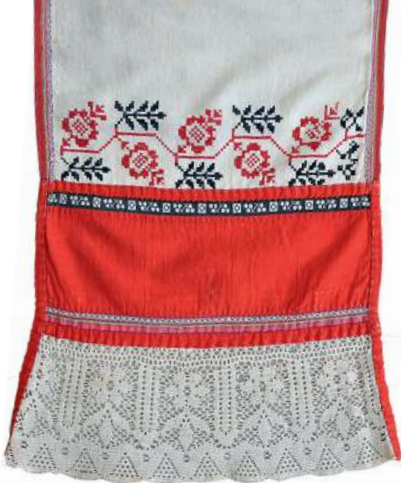
Головное полотенце сурпан. Деревня Верх-Шуртан Октябрьского района, 2012 год

В Пермском крае на владение чувашским языком указали 1678 человек, причём, по данным переписи, из этих людей только 6 не владели другим языком, кроме чувашского. Следует обратить внимание, что