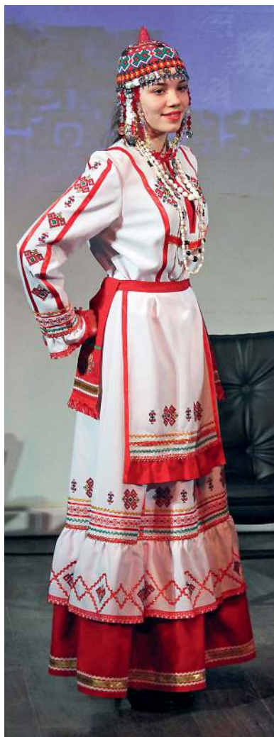
Презентация чувашских национальных костюмов в Пермском краевом доме народного творчества. г. Пермь, 2015 год

Характеризуя современный период, следует отметить ряд особенностей