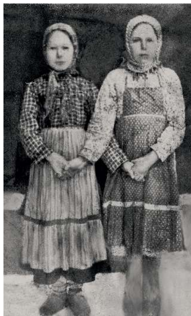
Чувашские девочки. Деревня Нижний Тымбай Куединского района. Середина XX века

Чувашей-переселенцев приняли несколько районов Сарапульского округа Уральской области (совре-