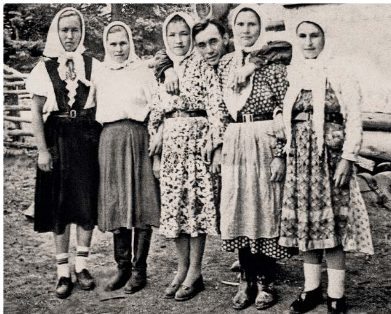
Чуваши. Деревня Малые Кусты Куединского района. Середина XX века

Результаты миграции чувашей в Прикамье в конце 1920-х – начале 1930-х годов видны по итогам переписи населения 1939 года. Численность чувашей Прикамья на тот момент составляла 8821, что в 12 раз больше, чем в 1926 году 19 . При этом доля говорящих на чувашском языке в об-