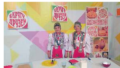
Презентация блюд чувашской кухни на передаче «В кругу друзей». г. Пермь, 2017 год

щённой очередной годовщине образования Пермского края. Одна из передач цикла «В кругу друзей» в 2017 году также была посвящена кулинарным традициям чувашского народа, на ней пермские чувашаи не только приготовили традиционные блюда чувашской кухни, но и презентовали национальные костюмы.