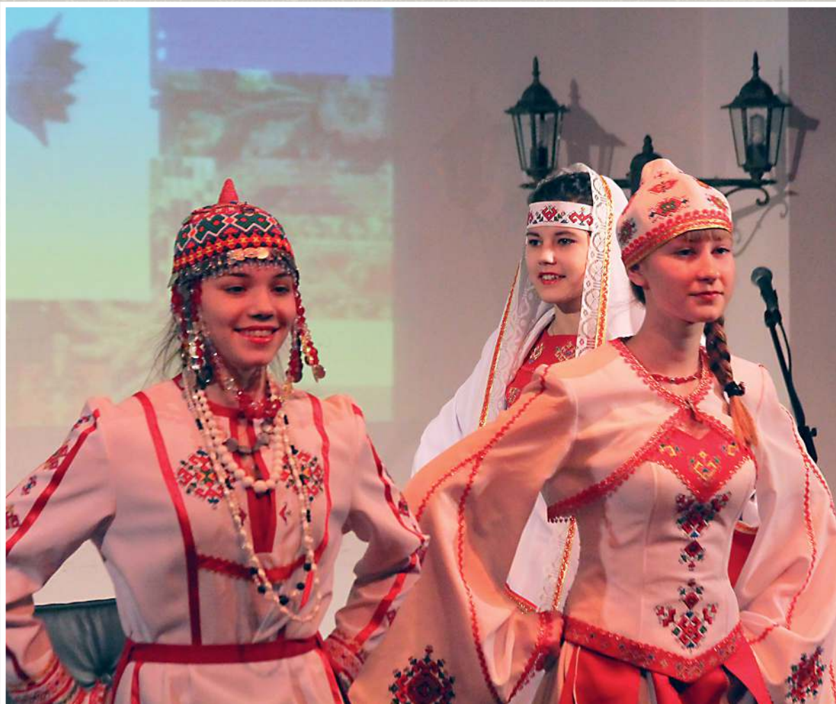
Презентация чувашских национальных костюмов в Пермском краевом доме народного творчества. г. Пермь, 2015 год