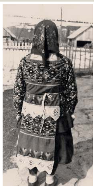
Чувашка в традиционном костюме 1950-х годов. Село Центральная усадьба 3-го госконезавода Куединского района, 2001 год