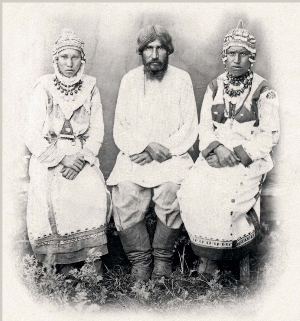
Чуваши. Начало XX века.