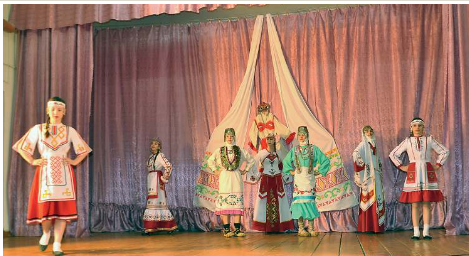
На чувашском празднике в д. Дойная Куединского района, 2014 год