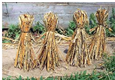
Чуваши́е детские куклы. Деревня Дойная Куединского района, 2001 год

Чуваши́е семьи в прошлом были многодетными, рождение детей было признаком счастливой семьи и продолжения рода.