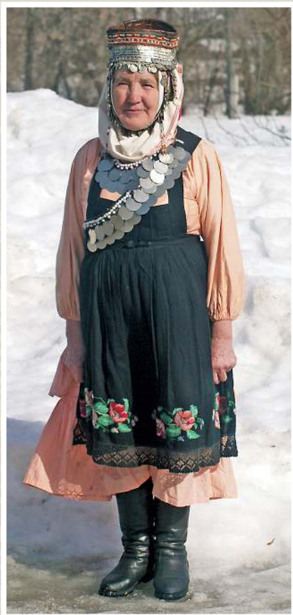
Чувашка в традиционном костюме 1950-х годов и головном уборе хушпу. Село Большие Кусты Куединского района, 2008 год