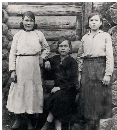
Чувашские девушки. Село Большие Кусты Кудинского района. Начало XX века

Перепись 1920 года отметила в четырёх округах Уральской области 492 чуваша, что составляло 0,03% от общей численности населения края. Из них в Кунгурском округе – 389 человек, Верхне-Камском – 29 человек, Пермском – 66 человек, Сарапульском – 8 человек округах 12 . К Всесоюзной