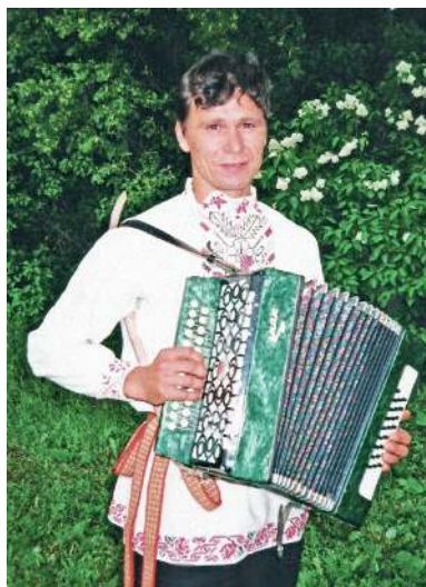
Чуваш-гармонист в традиционной рубаше. Деревня Дойная Куединского района, 2001 год

личаются устойчивостью и сохранением комплекса архаичных ритуалов и представлений. По мнению исследователей, культ предков у чувашей и в настоящее время является существенным компонентом духовной культуры 42 . Поминальные ритуалы у чувашей приурочены к 3, 9, 20