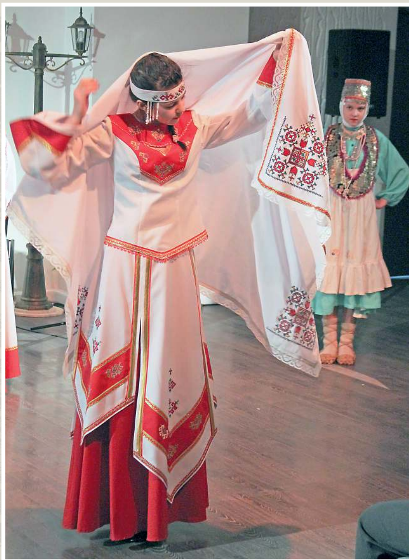
Презентация чувашских национальных костюмов в Пермском краевом доме народного творчества. г. Пермь, 2015 год