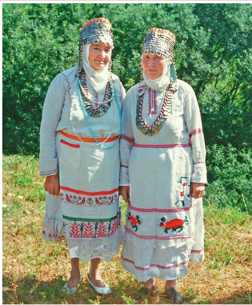
Чуваши в традиционных костюмах. Деревня Дойная Куединского района, 1996 год