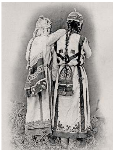
Чувашки в традиционных костюмах. Начало XX века.