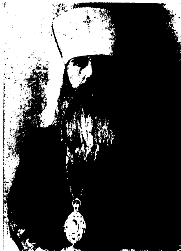
к стр. 251 Кирилл (Смирнов) Митр. Казанский и Свяжеский