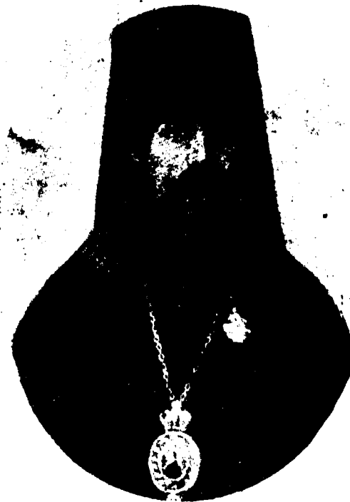
к стр. 106 Варлаам Ряшенцев Архиеп. б. Пермский

Наряду с «соловецкими» епископами, болезненно переживали церковное разделение б. ленинградские епископы: Сестрорецкий