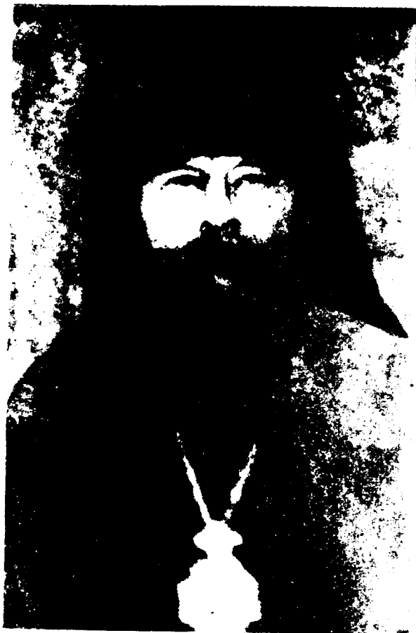
к стр. 106 Серафим (Самойлович) Архиепископ Угличский

возложенными другими епископами и духовниками и в неподведомых ему областях, чем пренебрег заповедь Спасителя «что свяжете на земле, будет связано и на небесах» и заповедь церковную,— что один духовник суд другого духовника решить не может. К нему примкнули те, кто недоволен был прещениями церковными. Велика опасность усугубить раскол свой тем лицам, которые не видят раскола в общении своем с Андреем, бывшим Уфимским епископом. Раскол этот состоит в противлении порядку законного иерархического преемства. Следствие его: дробление тела Церкви, отмирание целых частей сего тела. Слышите и разумеите.