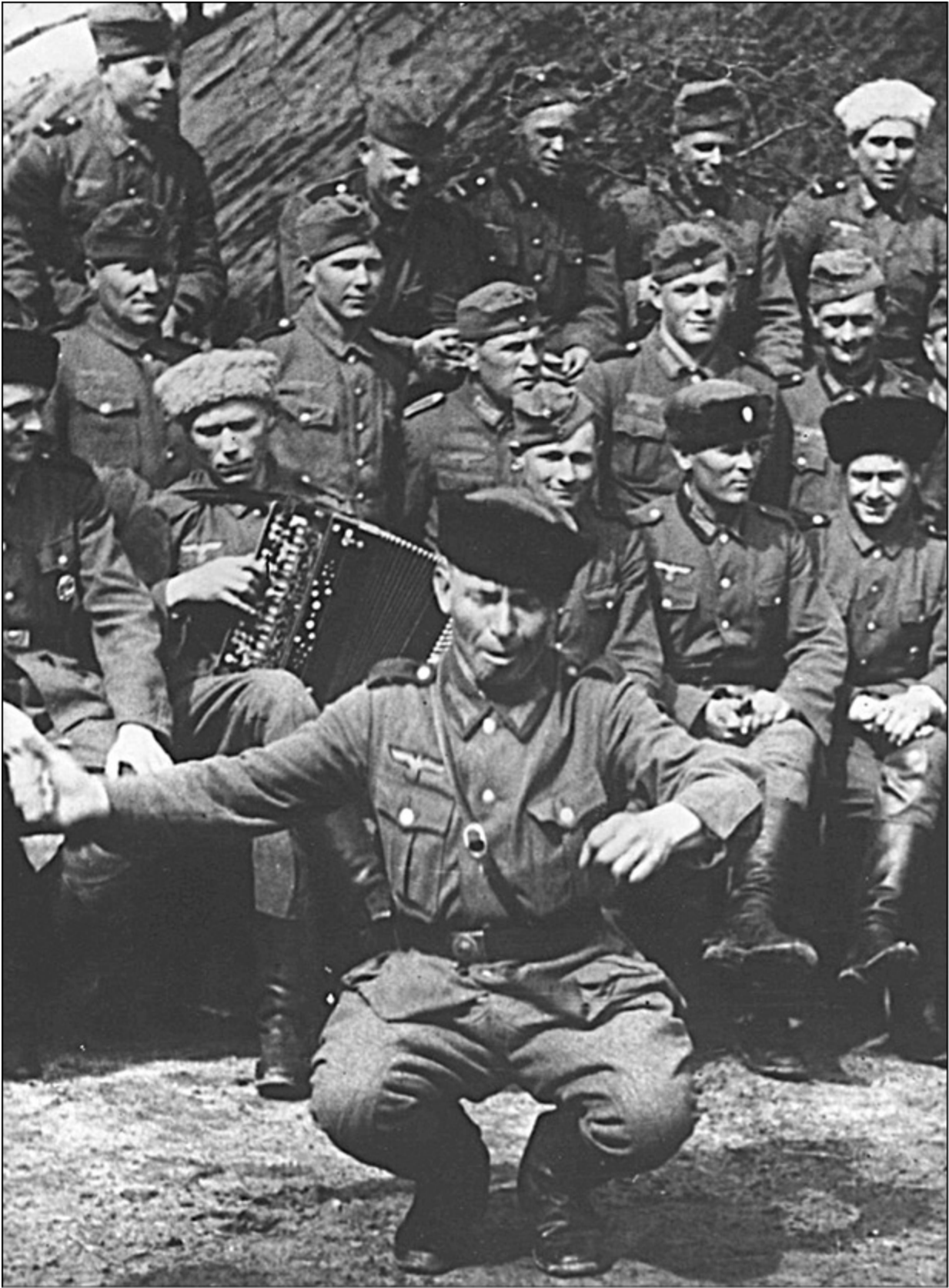
Казак вермахта танцує в оточенні товарищів