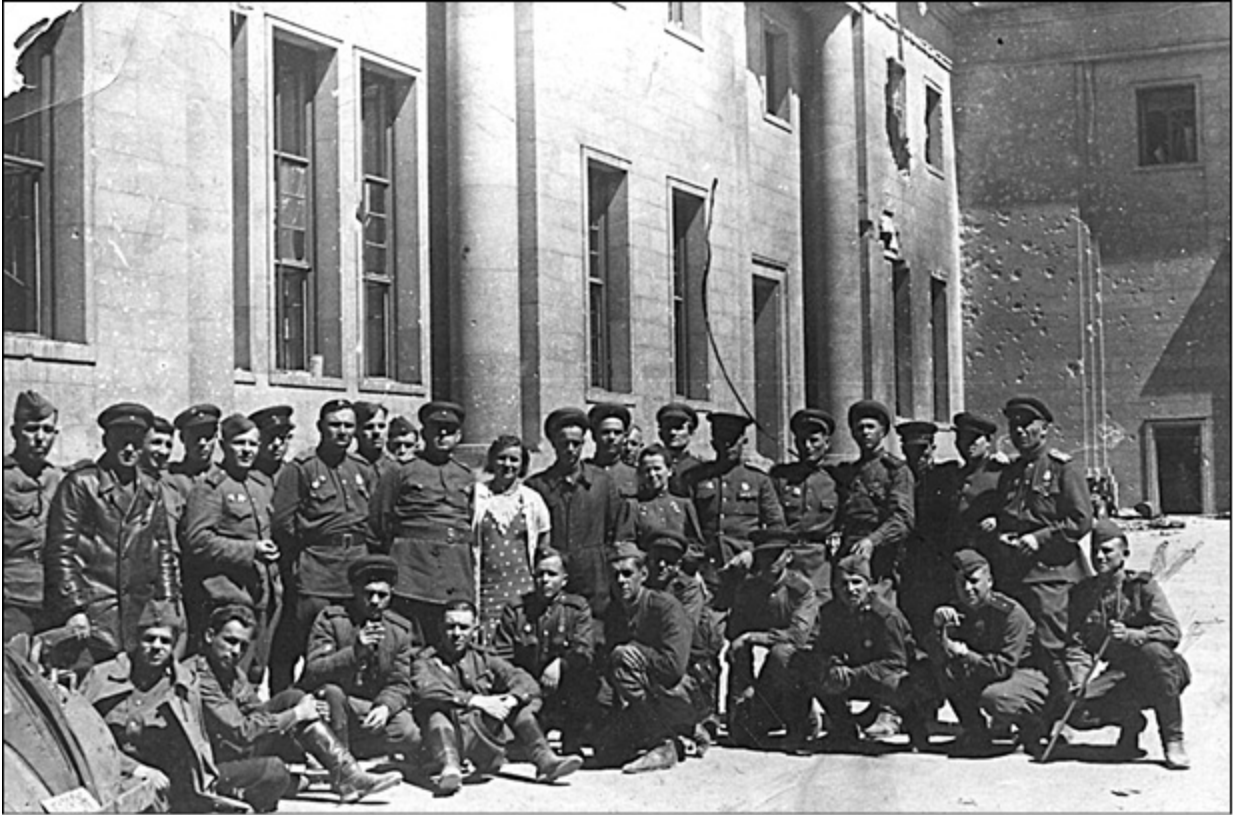
Групповой портрет личного состава отдела контрразведки Смерш 70-й армии у рейхсканцелярии в День Победы. 1945 г.