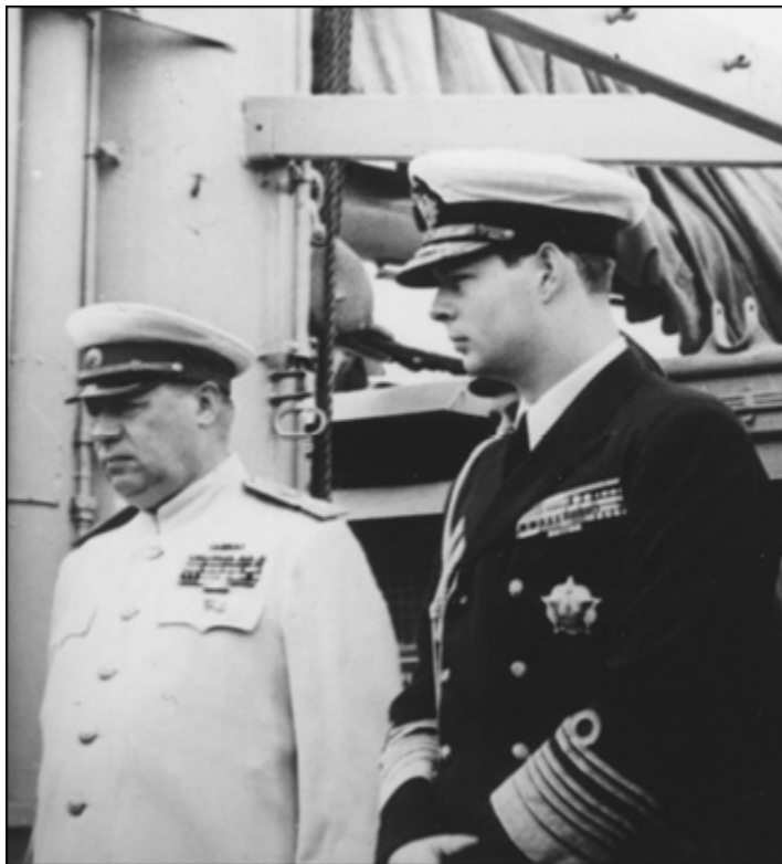
Ф.И. Толбухин и румынский король Михай