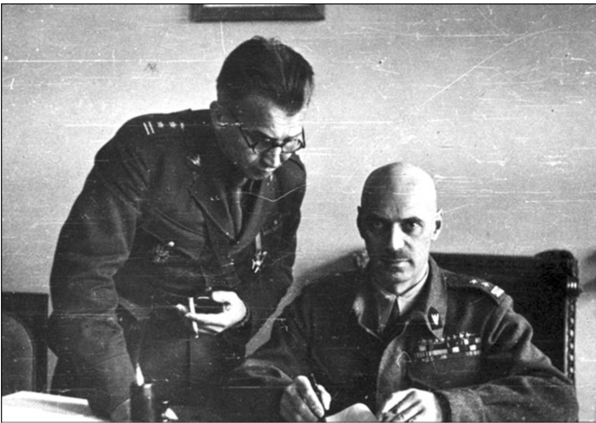
Генерал В. Андерс, командующий польской армией в СССР, и полковник Л. Окулицкий в кабинете