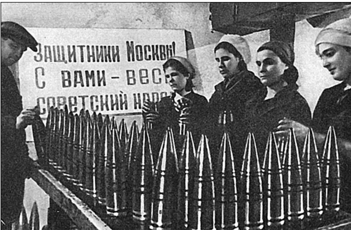
Изготовление снарядов на одном из оборонных заводов Москвы. 1941 г.