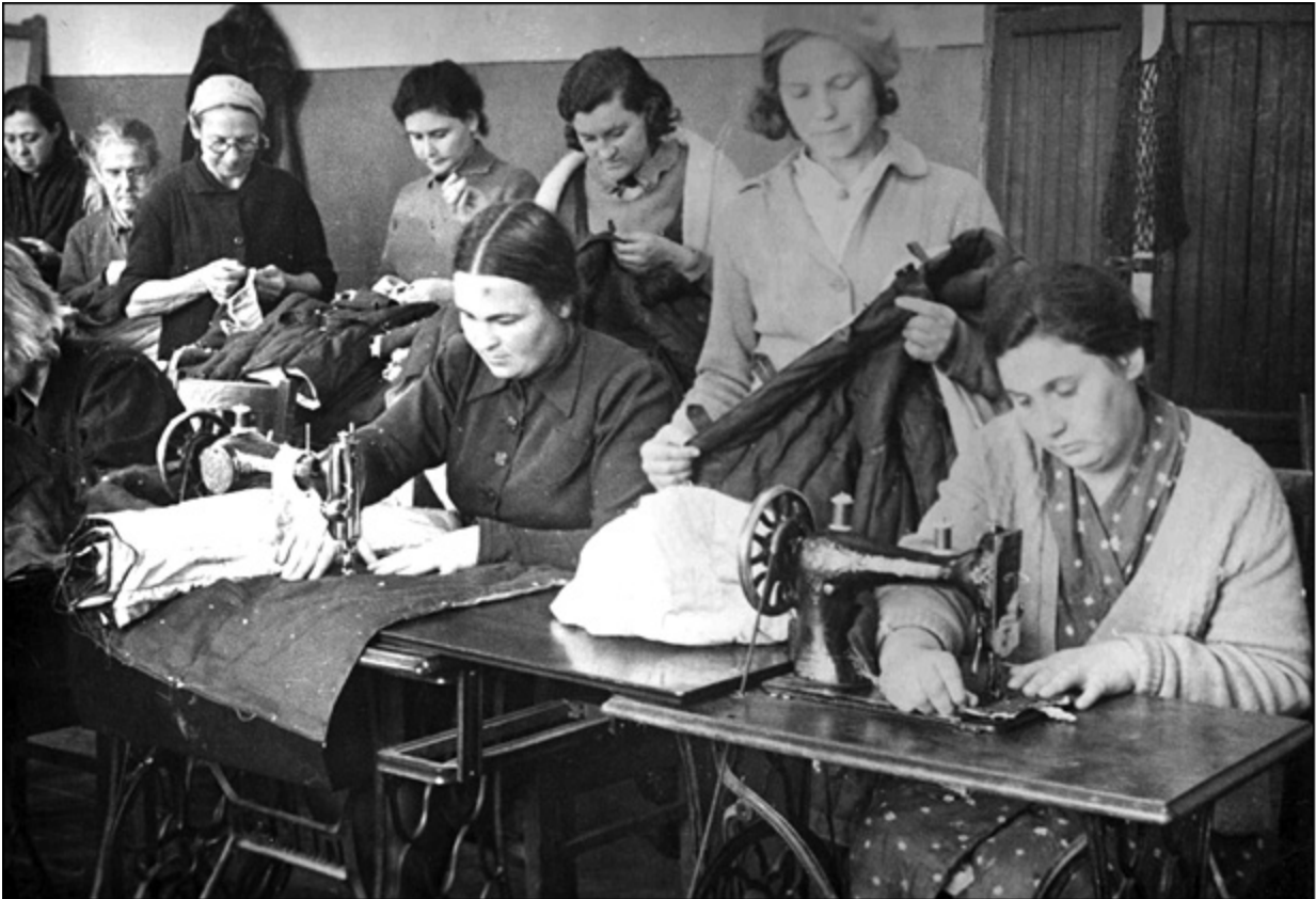
Пошив одежды для фронта в г. Куйбышеве. 1941 г.