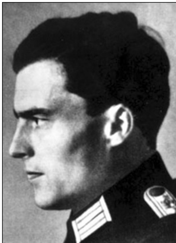
К. фон Штауфенберг