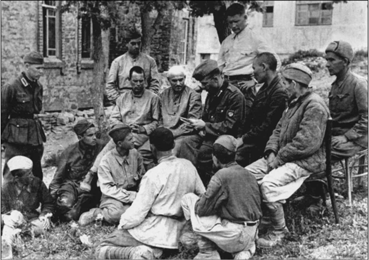
Пропагандист Русской освободительной армии зачитывает советским военнопленным воззвание генерала-лейтенанта Власова