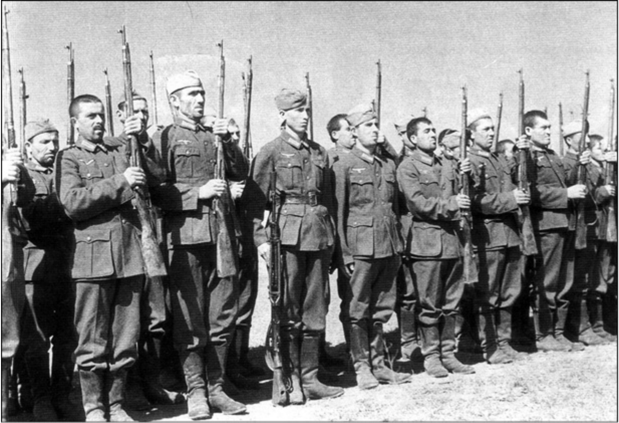
Строй бойцов кавказских вспомогательных войск вермахта