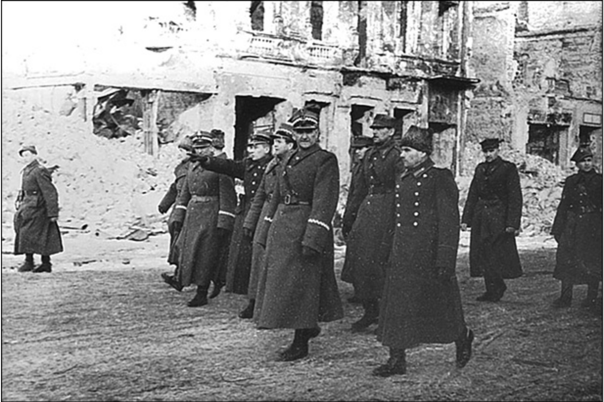
Представители Войска Польского