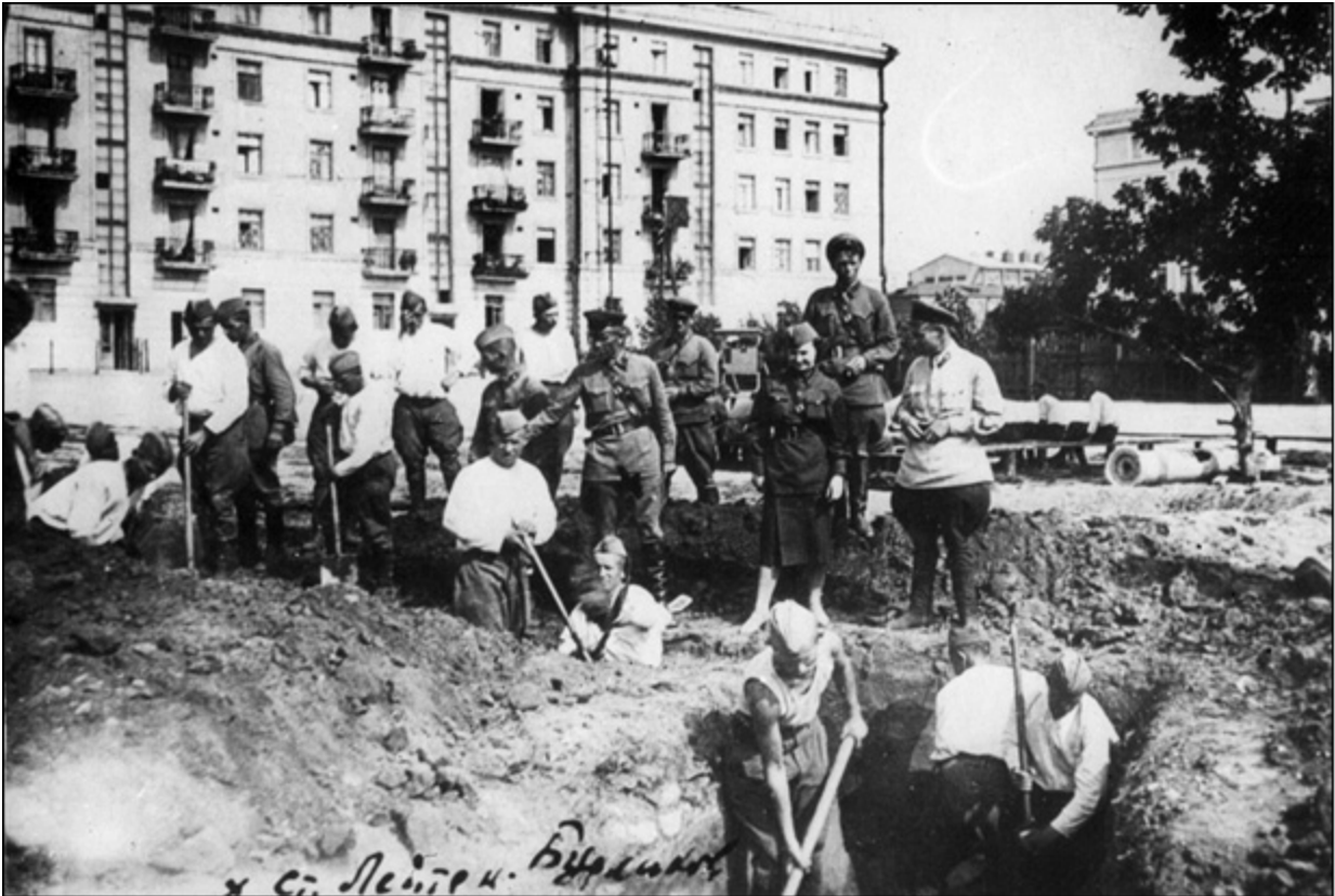
Бойцы полка НКВД строят оборонительные сооружения в Сталинграде. 1942 г.