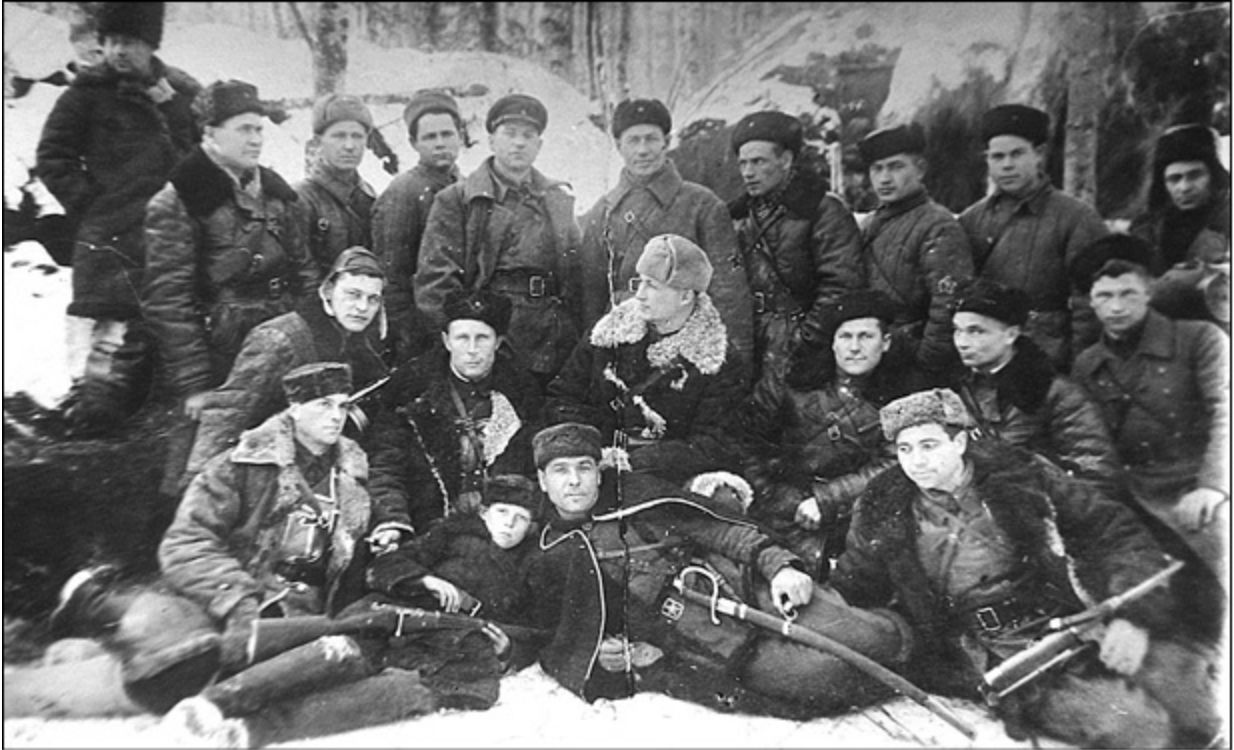
Групповой портрет бойцов отряда специального назначения «Славный» НКВД СССР