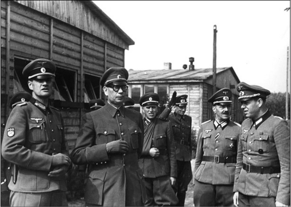
Генерал А.А. Власов в Дабендорфе