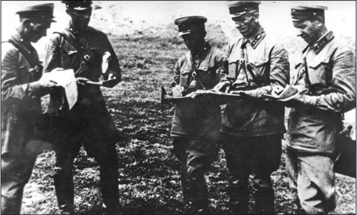
Командный состав 2-й роты 178-го стрелкового полка войск НКВД СССР на Мамаевом кургане