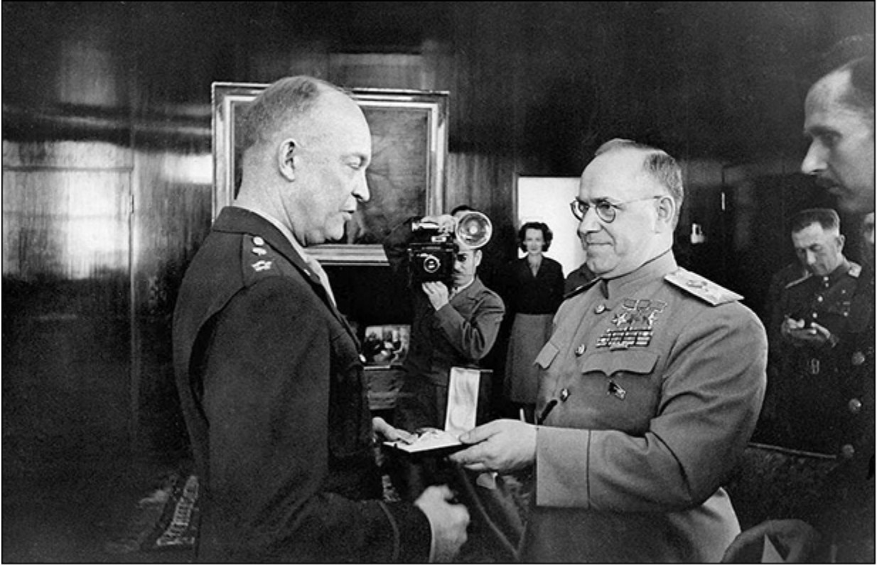
Маршал Жуков вручает генералу Эйзенхауэру орден «Победа»