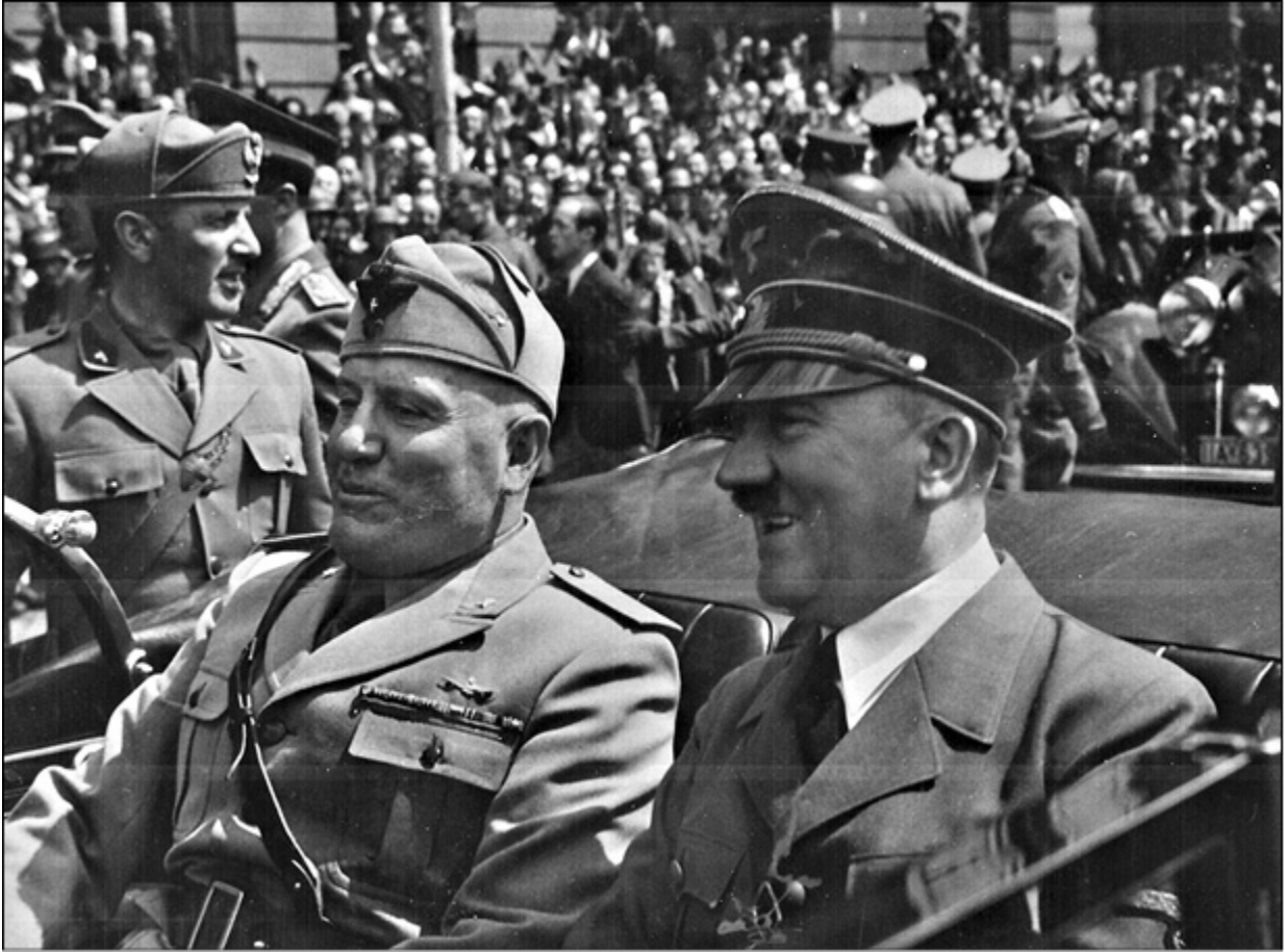
Б. Муссолини и А. Гитлер