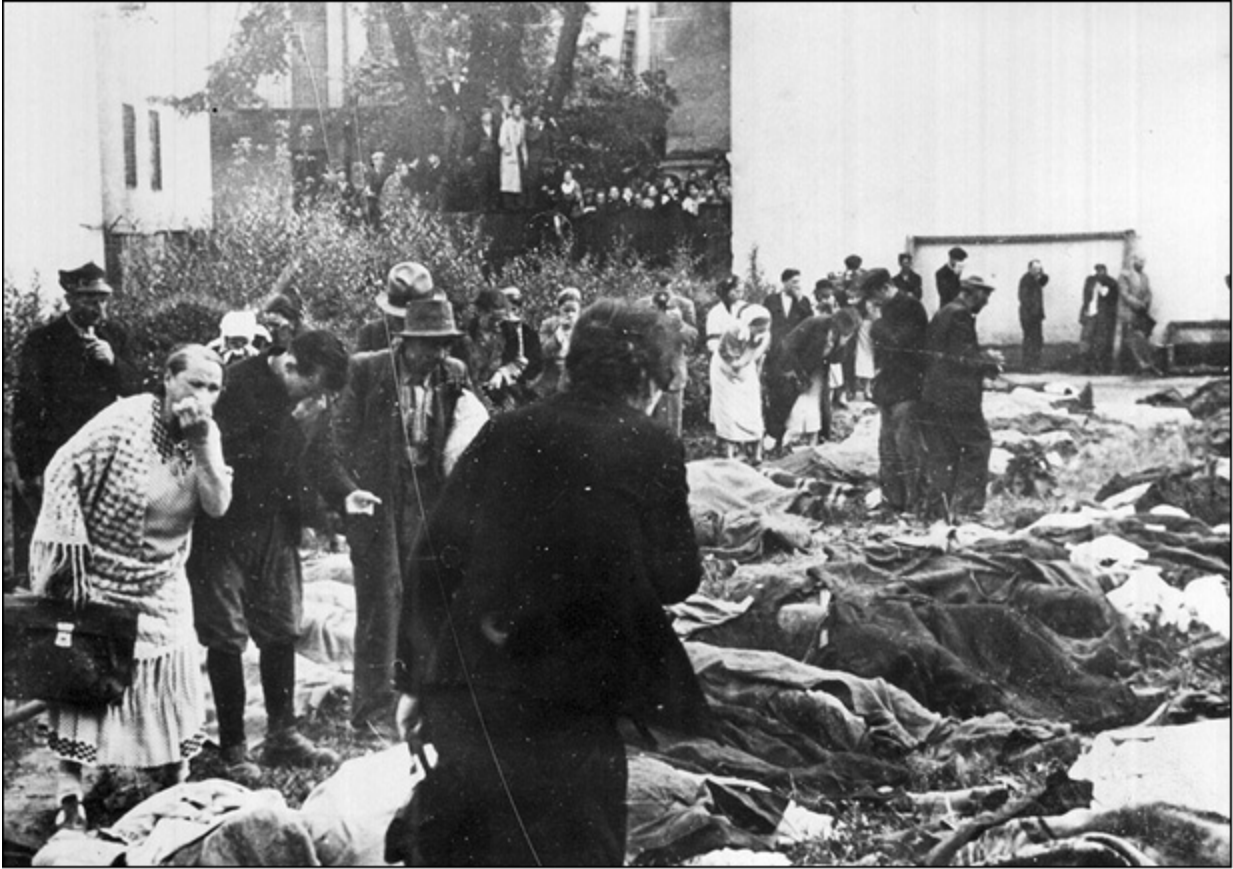
Тела расстрелянных заключенных одной из тюрем на Западной Украине