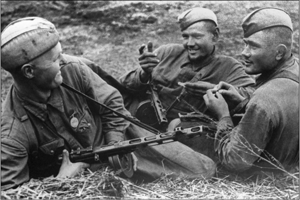
Бойцы войск НКВД между боями