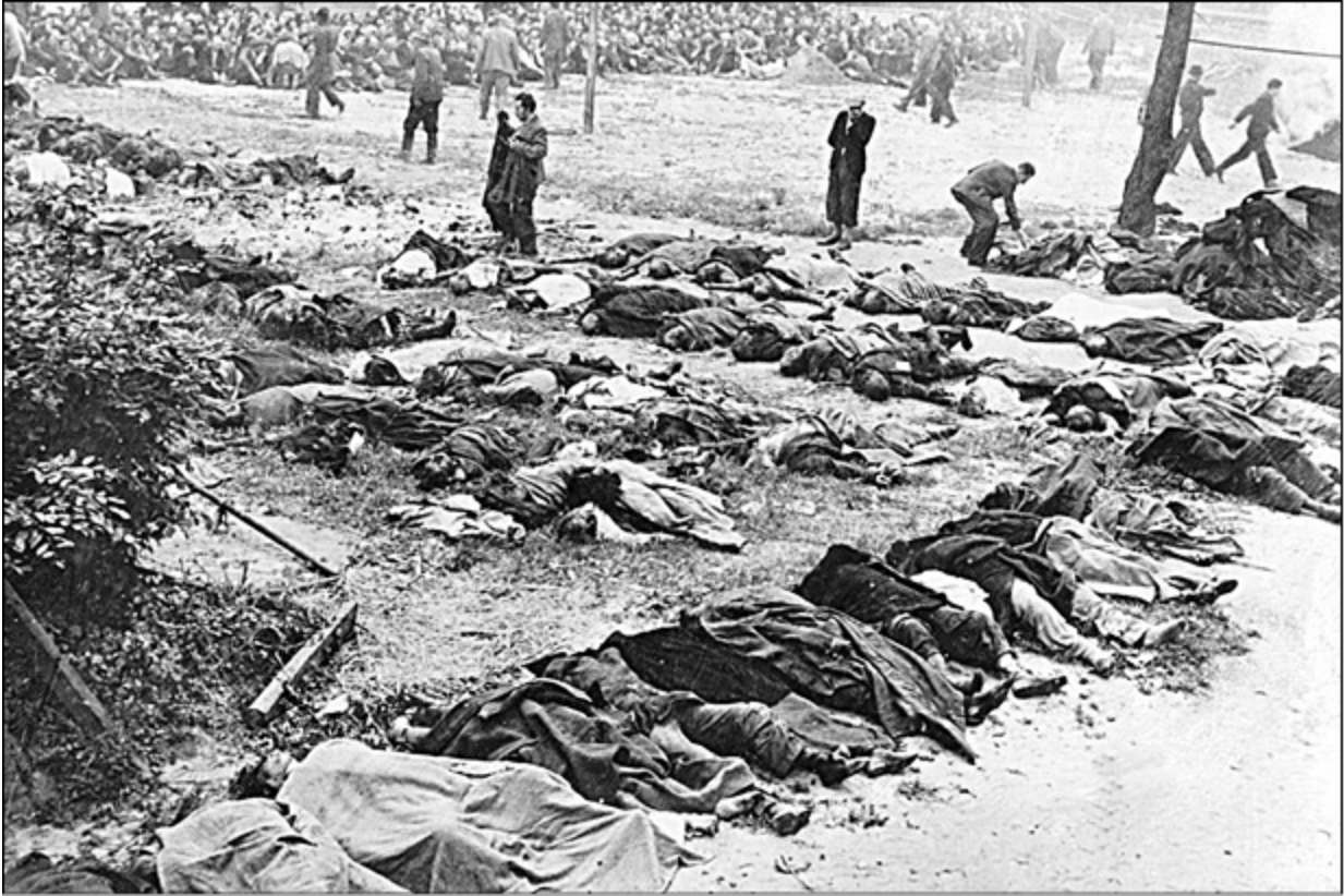
Тела расстрелянных при отступлении заключенных тюрьмы г. Львова. 1941 г.