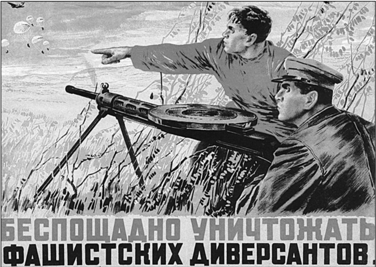
«Беспощадно уничтожать фашистских диверсантов». Советский плакат