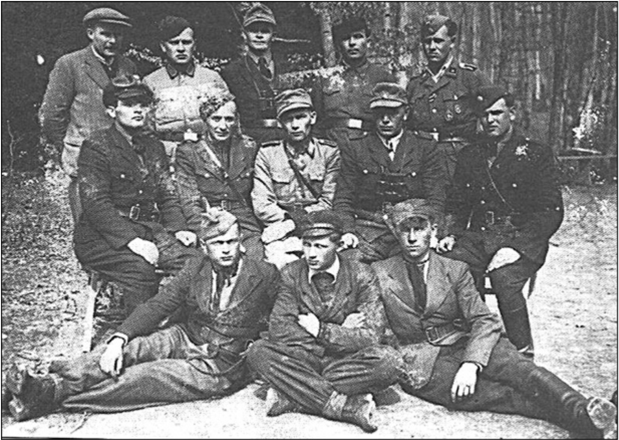
Одно из подразделений УПА