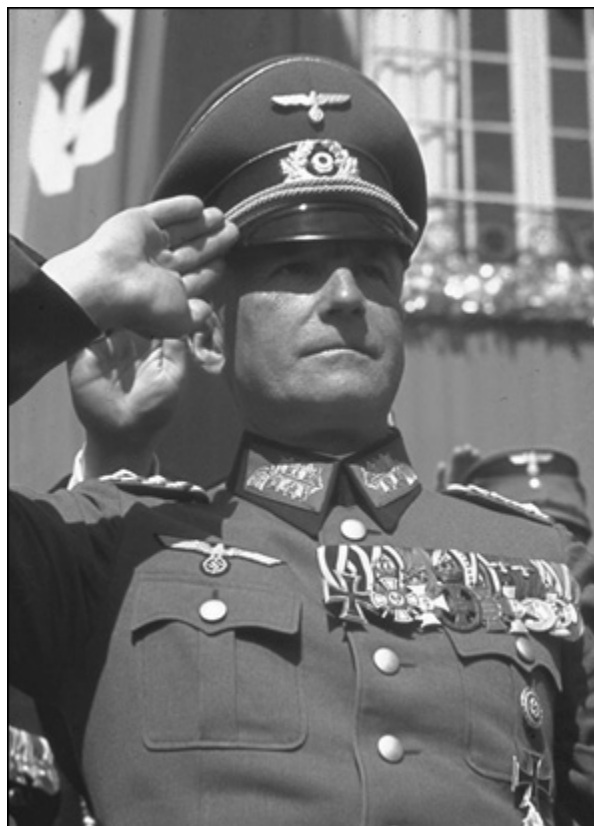
В. фон Браухич