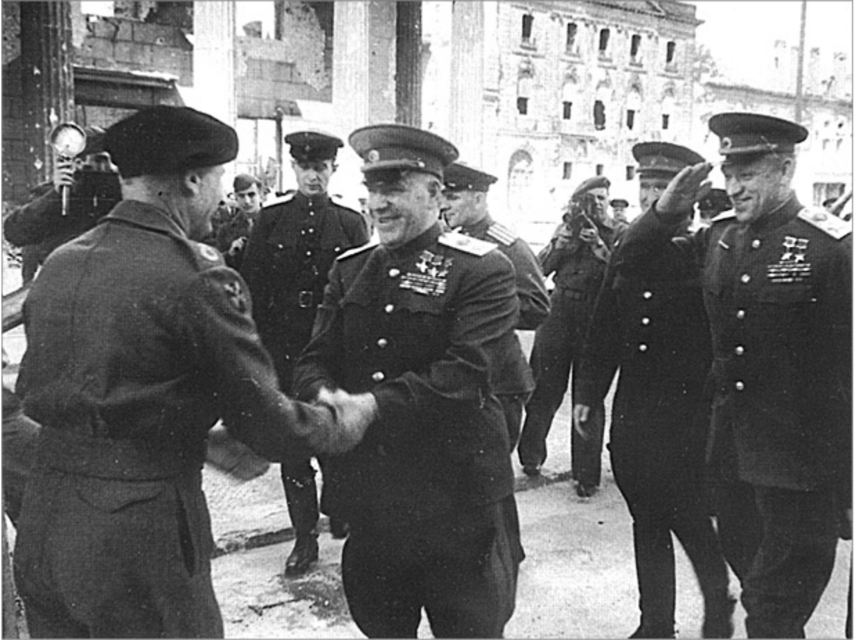
Б. Монтгомери, Г.К. Жуков и К.К. Рокоссовский в Берлине. 1945 г.