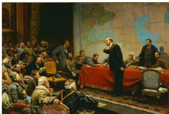
В.И. Ленин у карты ГОЭЛРО. Художник Л. Шматько. Харьков, 1957 г. ГИМ