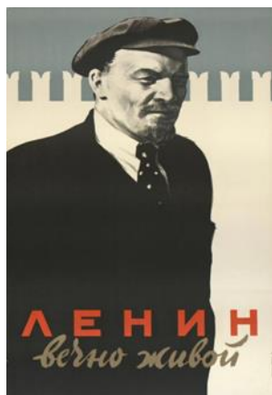
М. Гордон. Плакат «Ленин вечно живой». Москва, 1957 г. ГИМ