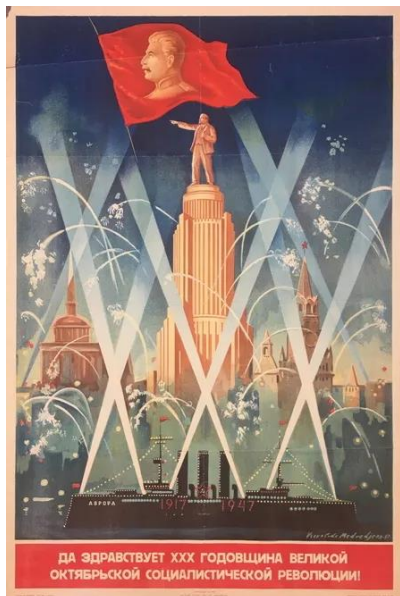
В. Медведев. Плакат «Да здравствует XXX годовщина Великой Октябрьской социалистической революции!» Рига, 1947 г. Государственный исторический музей (ГИМ)