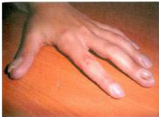
Рис. 7. Хронический кандидоз кожи и слизистых оболочек. Поражение кожи и ногтей кисти