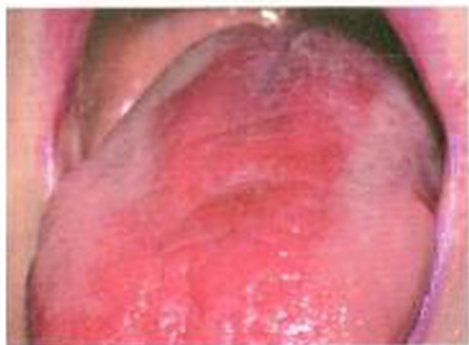
Рис. 9. Кандидоз языка