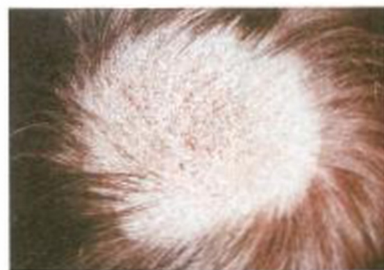
Рис. 6. Микроспория волосистой части головы, очаговое облысение