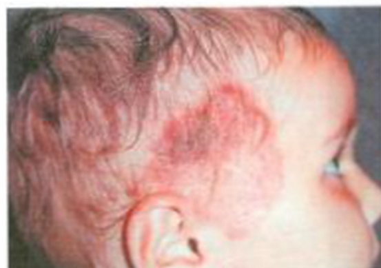
Рис. 4. Микроспория кожи височной области