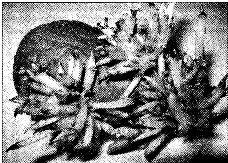
Рис. 5. Ростки картофеля

гликоалкалоиды. Именно алкалоиды и придают лечебные свойства росткам и позволяют применять их для лечения артрита, катаракты, кожных заболеваний и даже рака. Картофель вырабатывает алкалоид соланин, большая часть которого находится в кожуре и сразу под кожурой. Он вырабатывается как защитный механизм против вредителей и насекомых. Кроме того, это вещество убивает различные бактерии и вирусы, грибки, которые находятся на кожуре картошки. В больших количествах соланин может вызвать отравление и в особо тяжелых случаях даже привести к смерти. Но в небольших количествах он оказывает терапевтический эффект, который придает обезболивающие, противовоспалительные, ранозаживляющие и спазмолитические свойства. Препараты, приготовленные на основе картофеля, оказывают благотворное влияние на кровеносные сосуды, улучшают их проницаемость, укрепляют стенки сосудов. Благодаря