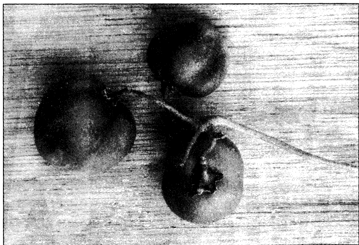
Рис. 2. Ядовитые плоды (ягоды) картофеля

До внедрения картофеля в питание населения России основным корнеплодом, выращиваемым повсеместно, была репа. На втором месте — брюква. Ими засеивались поля, про них сочинялись сказки. Про картофель русских сказок нет именно по причине его «вредности». Но постепенно картофель вытеснил репу, так как из одного семечка репы вырастала одна репка, а из одного клубня картофеля до 10 и более картофелин.