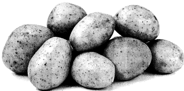
Рис. 4. Клубни картофеля

1. Клубни (рис. 4). Из них отжимают сок, делают компрессы из мякоти, применяют кожуру и ростки (рис. 5), выделяют крахмал.