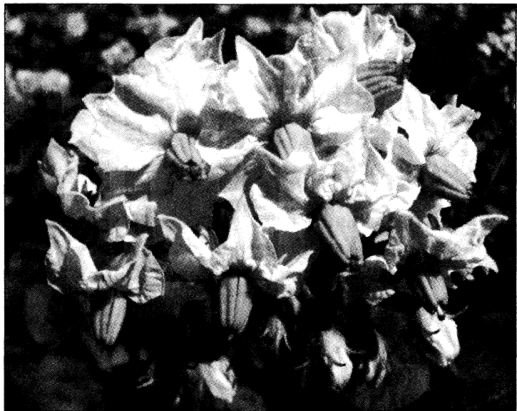
Рис. 6. Цветки картофеля

2. Цветки картофеля (рис. 6). Готовят настои, настойки.