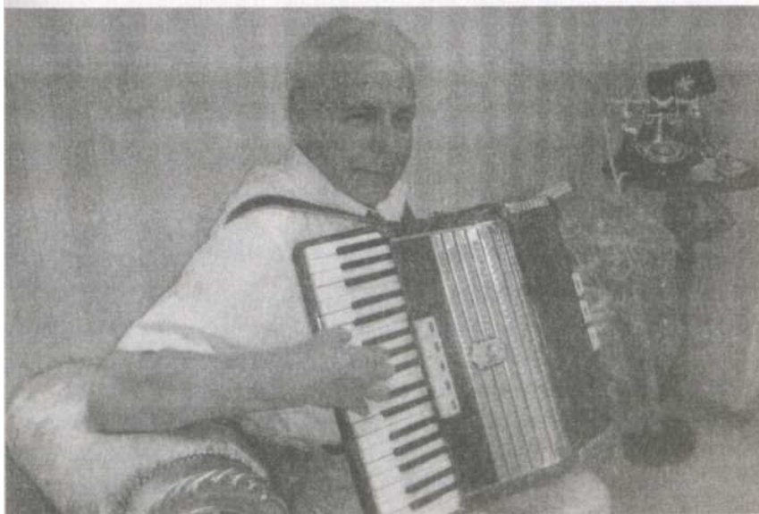
Аккордеон – семейная реликвия, трофейный