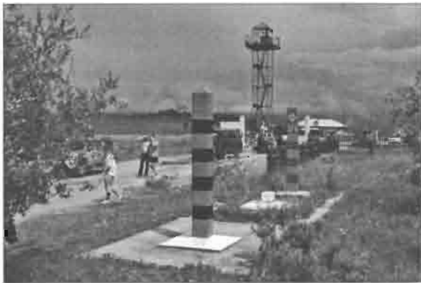
Рис. 5.3. Граница между Россией и Монголией: погранпереход Монды — Ханх. Снимок сделан с монгольской стороны границы. Фото В.А. Мартынова, 2008

На рубеже XIX—XX вв. начинается «гонка» за полярные области планеты. В Арктику и Антарктику снаряжаются многочис-