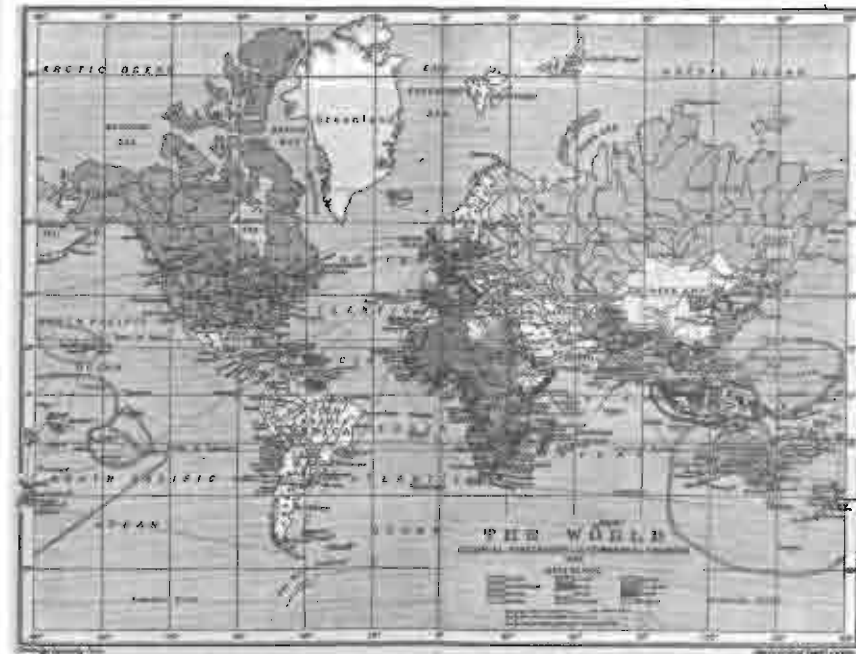
Рис. 5.2. Колониальные владения и торговые пути в 1910 г.

С 1905 г. территория нашей страны, как бы она не называлась, испытывала тенденции к сокращению. Иногда часть потерянных владений удавалось вернуть, но в целом территория Российского государства за последнее столетие значительно уменьшилась.