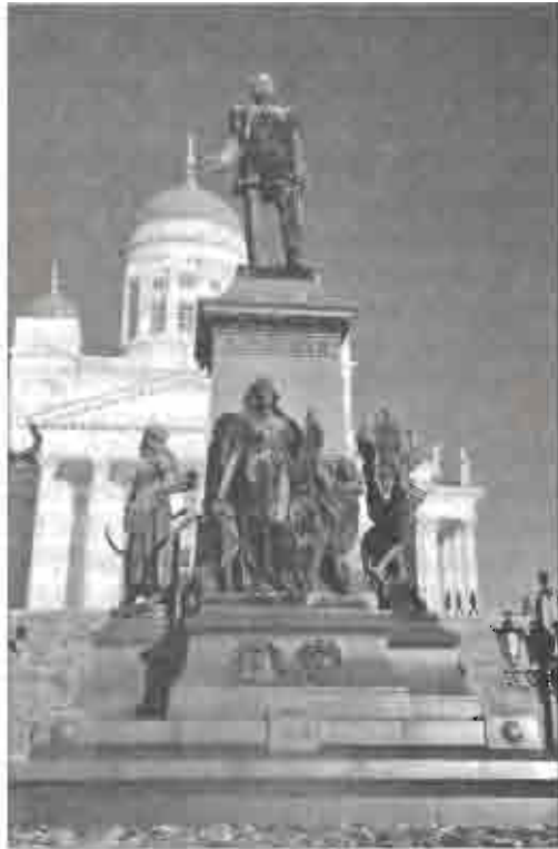
Рис. 5.1. Памятник Александру II на Сенатской площади в Хельсинки. Фото В. А. Мартынова, 2007

В 1860-е гг. политическая карта Европы разительно меняется. На месте раздробленной на протяжении столетий «срединной Европы» появляются два новых крупных государства — Германия и Италия. С возникновением этих государств начинается чрезвычайно быстрое их развитие. В Германии формируется один из крупнейших в мире промышленных районов — Рур, получивший свое название по реке Рур, правому притоку Рейна. Залежи каменного угля и железной руды позволили развиваться здесь тяжелой промышленности, по производству продукции которой Германия уже в начале XX в. выходит на лидирующие позиции в мире, обгоняя Великобританию. Второй, значительно меньший по масштабам, промышленный район формируется на востоке Германской империи, в Польше, где граничили Германия, Россия и Австрия. Характерной особенностью промышленных районов Германии было то, что с самого своего возникновения они имели трансгра-