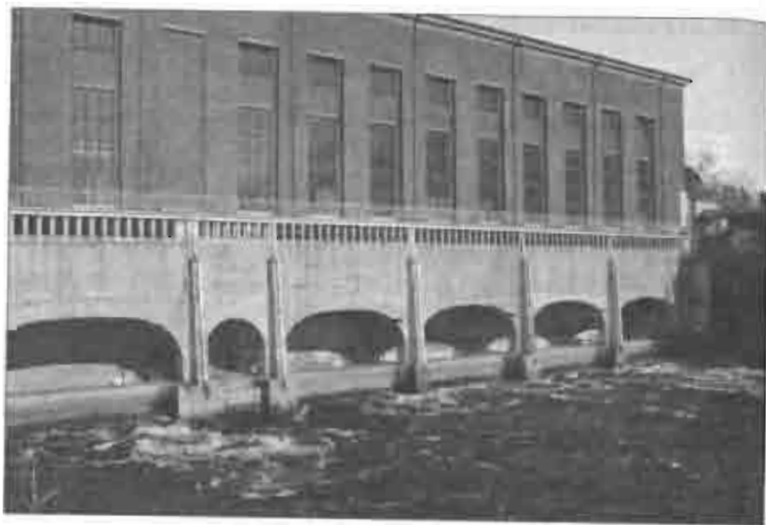
Рис. 6.2. ГЭС на реке Вуокса (Вуокси) в Имаатре, Финляндия. Строилась в 1920-х гг., когда промышленность западного мира развивалась бурными темпами. Введена в эксплуатацию в 1929 г. Фото В. Л. Мартынова, 2007

В системе информационных коммуникаций появляется новое изобретение — радио. В начале 1920-х гг. возникла возможность передачи с помощью радиоволн звуковых сообщений (голос, музыка и т. д.), а также явление дальнего распространения коротких волн. В 1920-е гг. строятся мощные радиостанции, предназначенные для передачи голосовой информации, и широко распространяются радиоприемники, сначала детекторные, а затем и ламповые. В то же время по всему миру создается сеть «любительских» приемно-передающих станций, работающих на коротких волнах, своеобразный предшественник нынешнего Интернета.