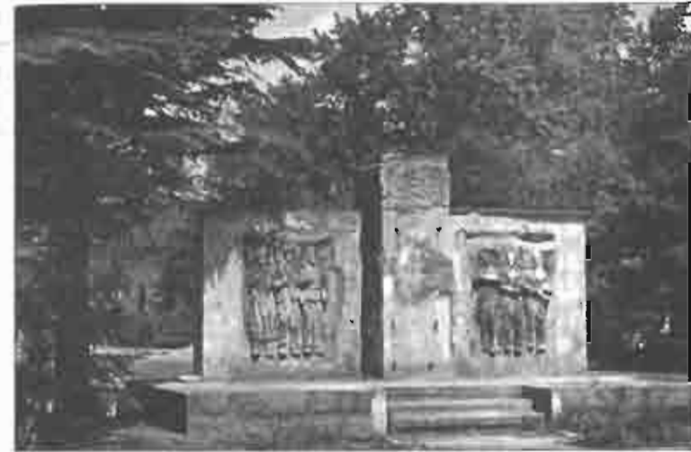
Рис. 7.2. Польша, г. Легница. Постамент разрушенного памятника В. И. Ленину на территории бывшего гарнизона Советской армии. Фото В. Л. Мартынова, 2004

Но социализм рушился не только в странах — союзниках СССР, но и в тех социалистических государствах, которые не входили в