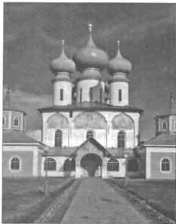
Рис. 4.1. Тихвинский Богородический Успенский мужской монастырь. Фото В. А. Мартынова, 2006

В пределах Русского православного региона православие сосуществует с исламом (главным образом — поволжские и северо-