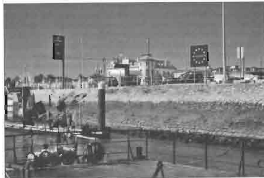
Рис. 10.1. Река Гвадиана, граница между Испанией и Португалией. Обе страны — члены Шенгенской группы. О пограничном характере реки свидетельствуют только таблички с названиями государств на ее берегах. Португальский берег.

С тех пор к соглашению присоединились еще несколько стран. Соглашение подписано 30 государствами, а фактически действует (с отменой пограничного контроля) в 25 государствах. Все государства Шенгенской зоны, за исключением Норвегии, Исландии и Швейцарии, являются членами Евросоюза. С 21 декабря 2007 г. был отменен пограничный контроль в 9 государствах, вошедших в