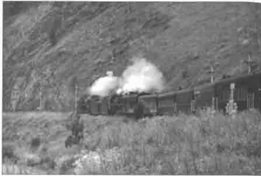
Рис. 5.4. Крутобайкальская железная дорога, «золотая пряжка стального пояса России». Ныне эксплуатируется только ее восточный участок от ст. Слюдянка до ст. Мысовая, а западный участок от ст. Слюдянка (Култук) до Порт-Байкала используется в туристических целях. Фото В. Л. Мартынова, 2008

деления труда и соответственно ростом грузопотоков между Европой и Америкой значение этого океана еще более возрастает.