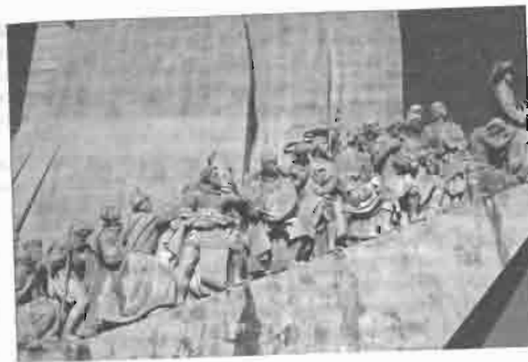
Рис. 2.1. Памятник первооткрывателям в Лиссабоне. Фото В. Л. Мартынова, 2007

Испанцы, закончив Реконкисту, включились в гонку открытия новых земель, но путь вокруг Африки был уже закрыт португаль-