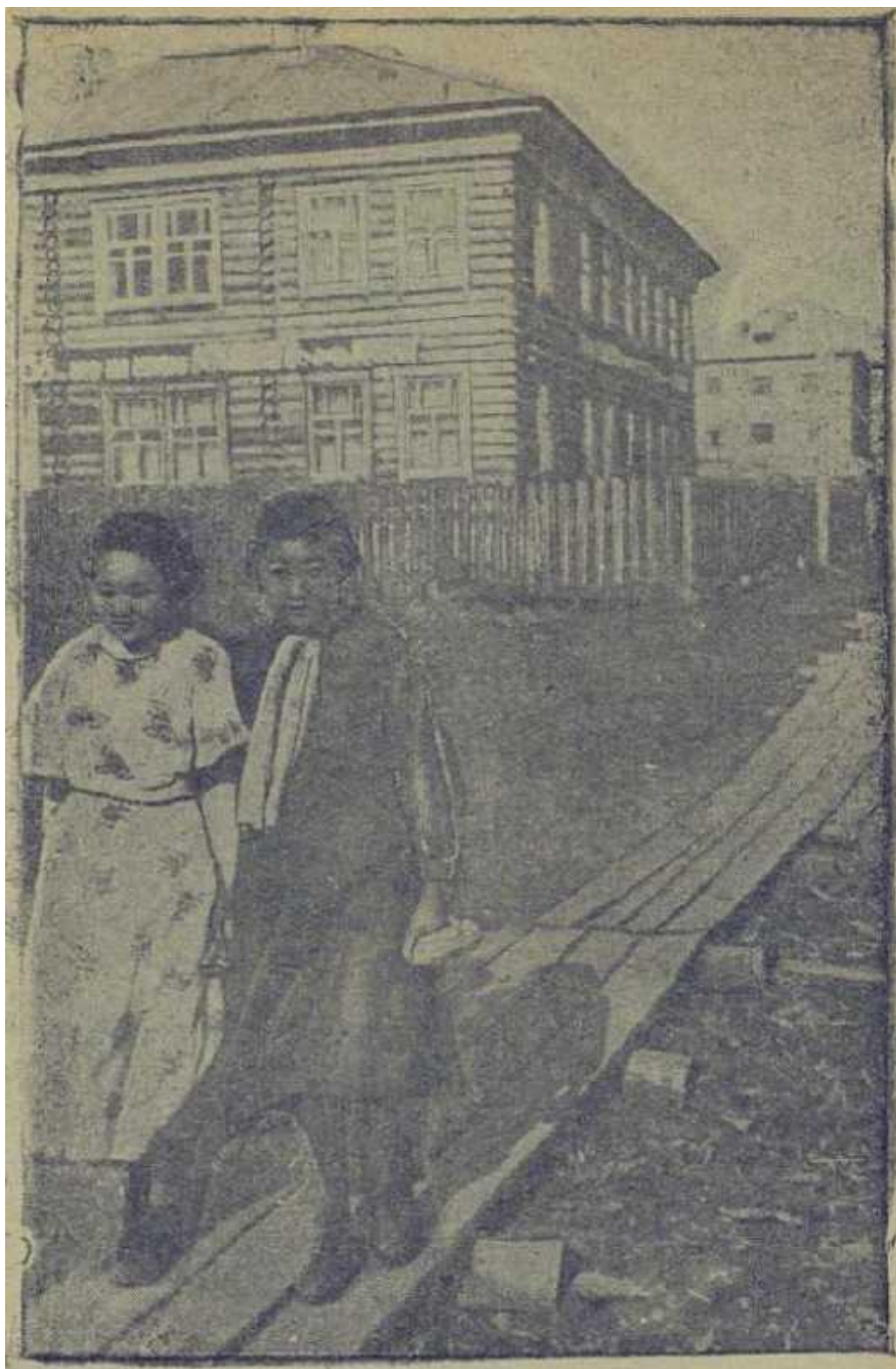
Студентки Туринской совпартшколы на улицах Туры.