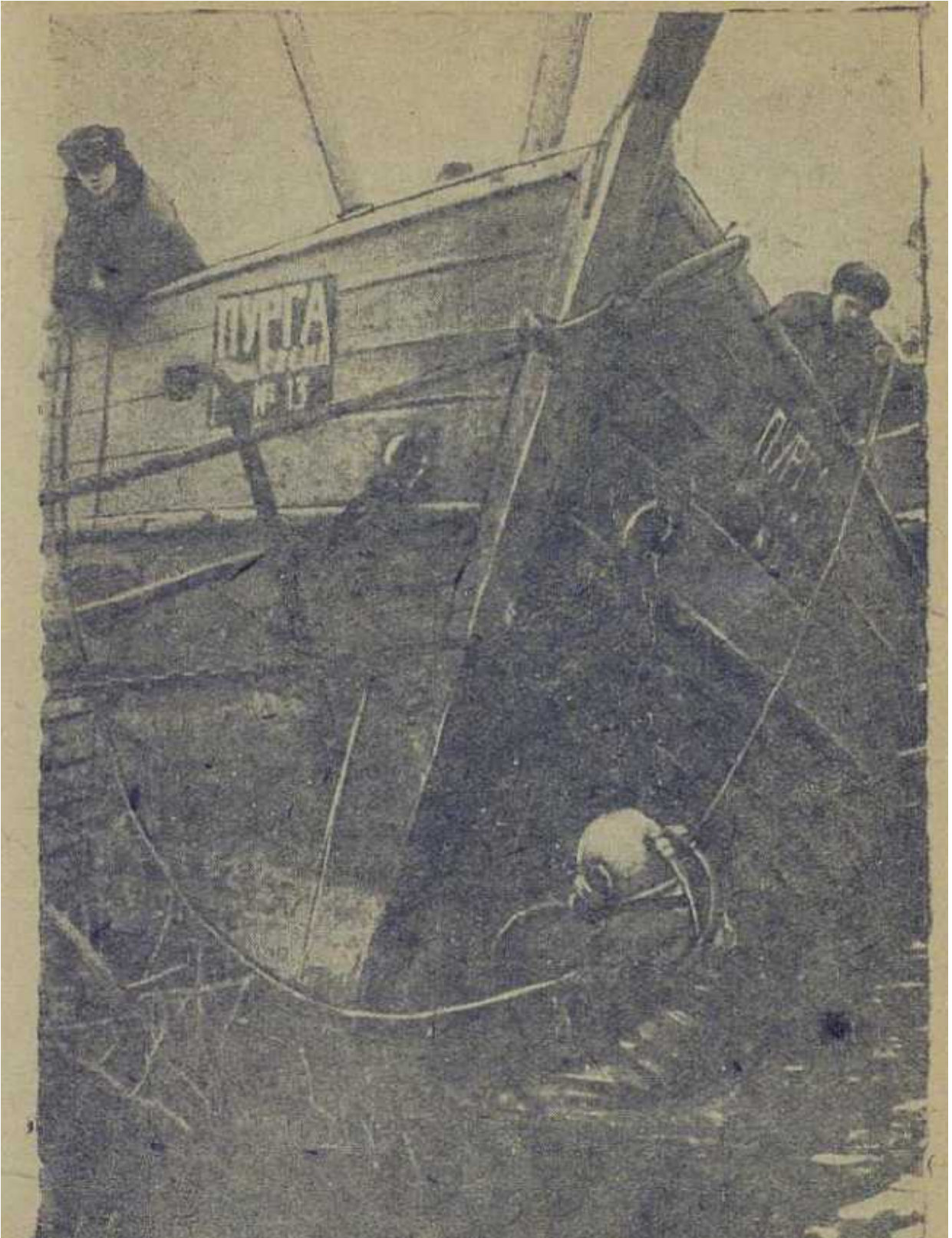
Водолазные работы по спасению бота "Пурга"