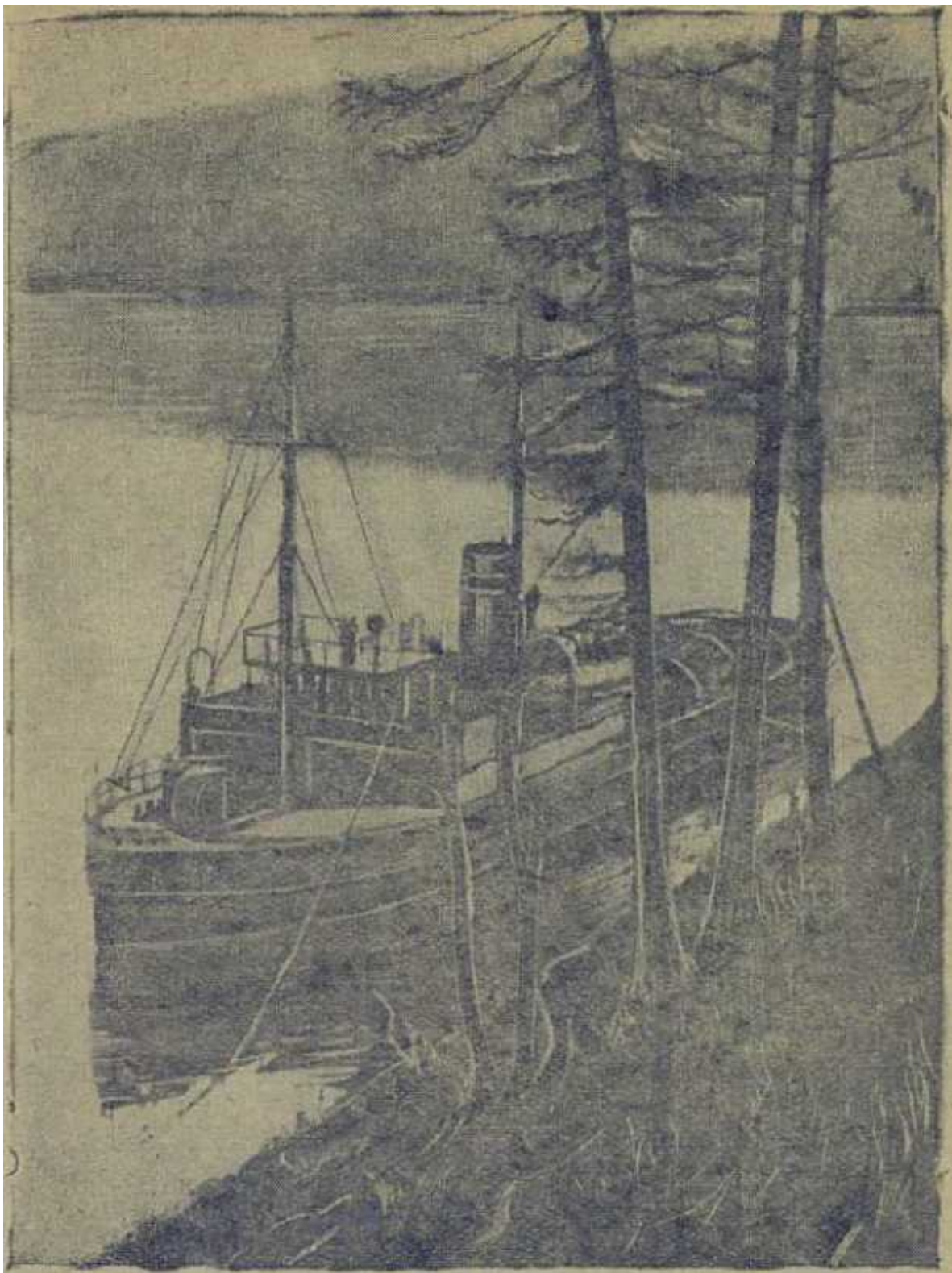
"Красноярский Рабочий" около Большого порога на Подкаменной Тунгуске.