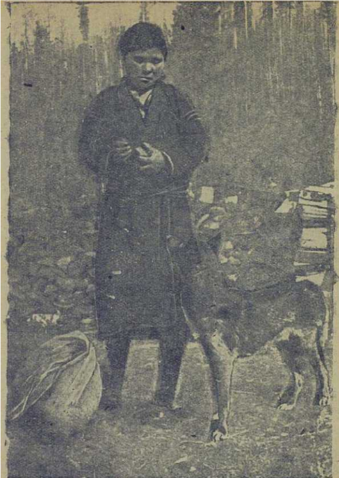
Женщина-кето с фактории "Черный Остров".