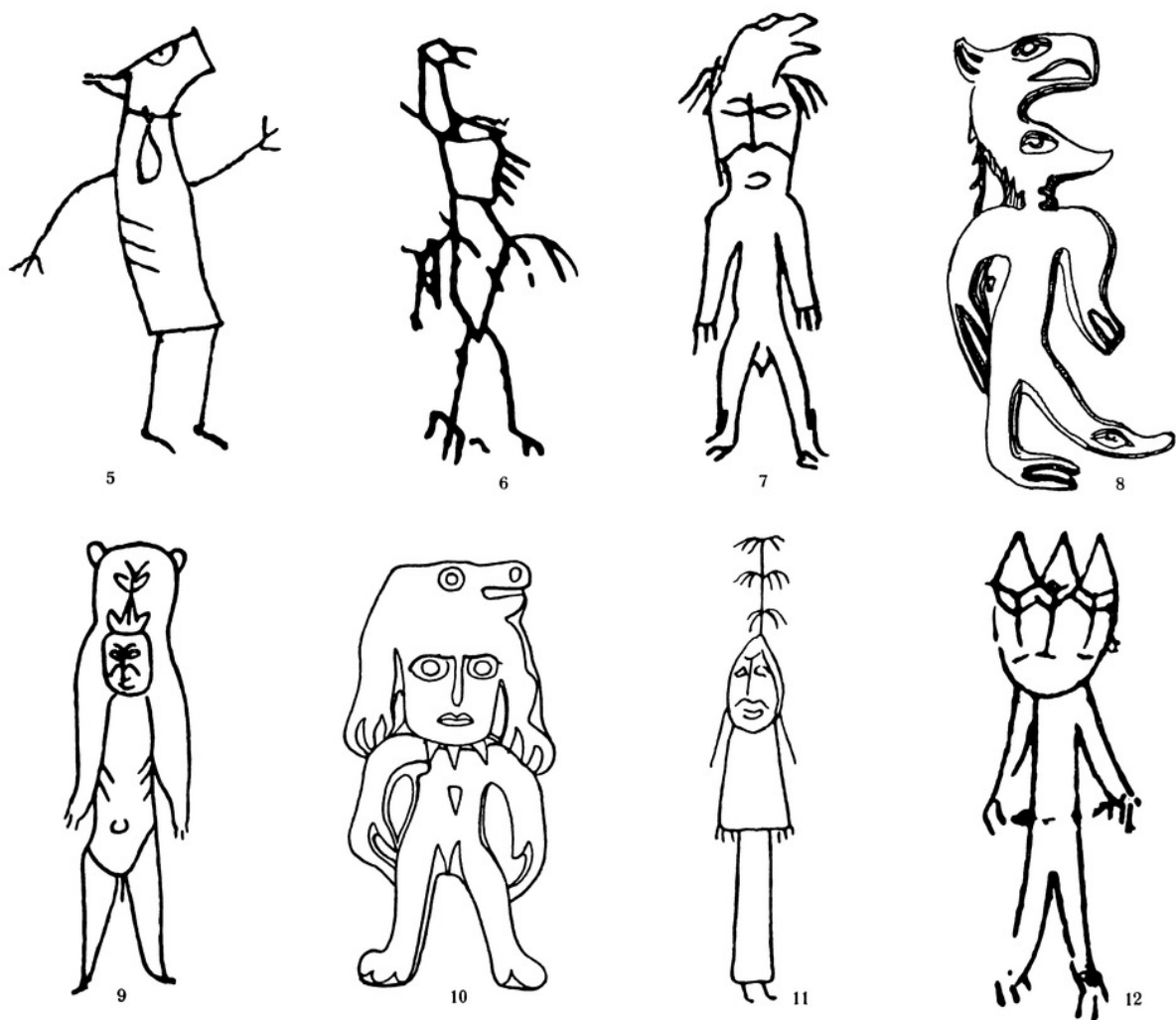
Ил. II. Зооантропоморфные изображения, выгравированные на металлических зеркалах, блюдах и отлитые из металла