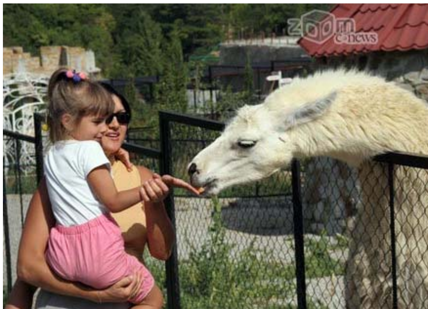
Отлично выходят снимки, сделанные в зоопарке

Вовсе необязательно искать необычные места, уникальные фоны, королевские костюмы, интерьер, которые абсолютно не подходят детям. Обычная повседневная жизнь и простая естественная обстановка помогут лучше передать открытые эмоции ребенка. Согласитесь, вряд ли кто-либо лучше чем мама сделает искреннюю и интересную фотографию ребенка. Любые дяденьки-профессионалы, приглашенные в школы, садики, не смогут сделать эмоциональные и живые фотографии, какие можете сделать вы, находясь рядом со своим ребенком постоянно.