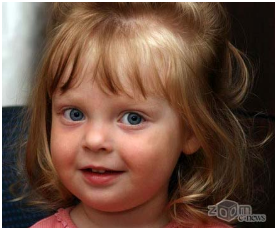
Подсвечивать портрет вспышкой следует очень аккуратно

Не оставляйте без внимания вопрос достаточного освещения. Когда освещения явно не хватает, лучше не снимать вообще. Никому не нужны и не интересны темноватые и зашумленные кадры, этот брак только оставит неприятный осадок.