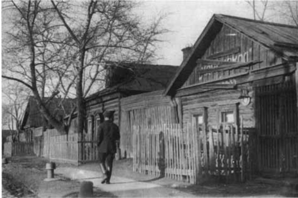
Деревянные дома за Краснопресненской заставой в Москве. Конец 20-х — начало 30-х гг. XX в.