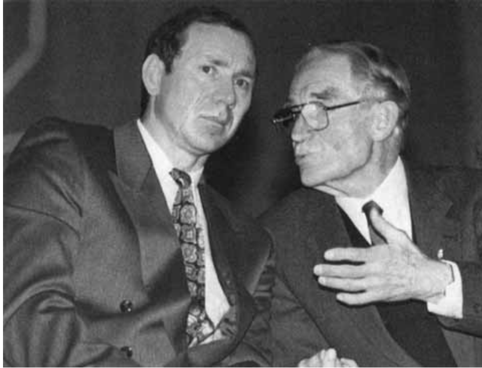
Николай Старостин с Олегом Романцевым. 1989 г.