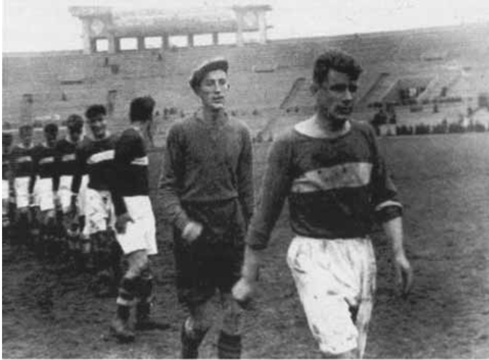
Александр Старостин выводит спартаковцев на игру с киевским «Динамо». 1936 г.