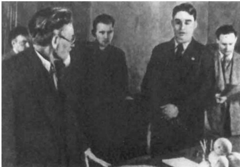
Михаил Калинин (слева) награждает Николая Старостина орденом Ленина (второй справа). 1937 г.