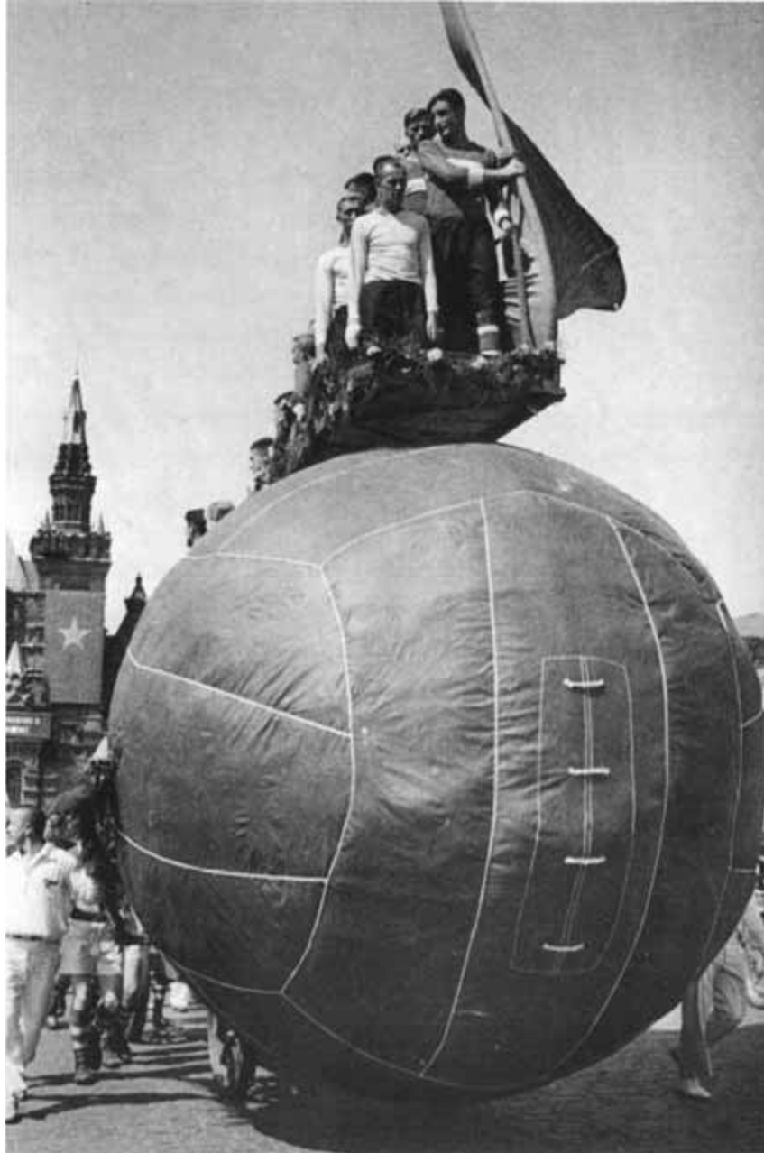
Футболисты спортивного общества «Спартак» на Красной площади во время Всесоюзного парада физкультурников 18 июля 1939 года. Впереди — Андрей Старостин.