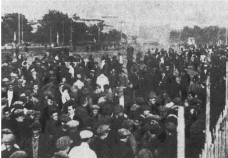
Перед матчем. У стадиона «Пищевик» (позднее — стадион Юных пионеров). 1926 г.