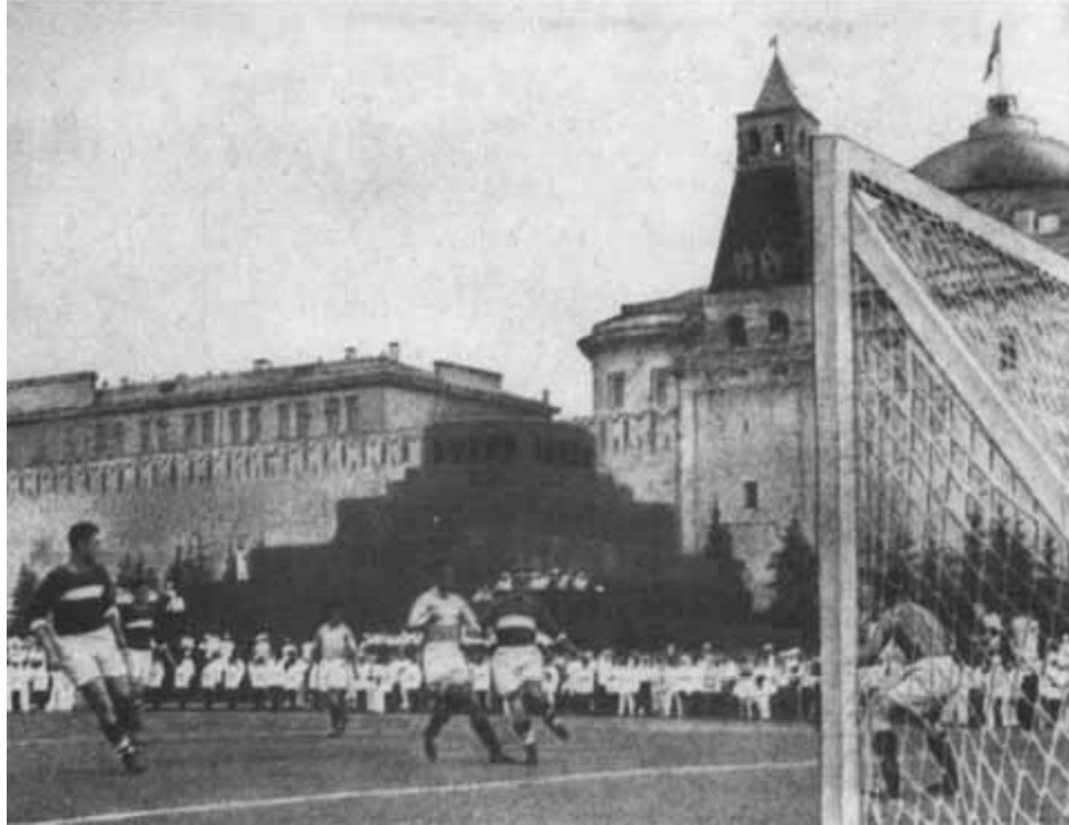
Показательный матч спартаковских команд на Красной площади. 6 июля 1936 г.