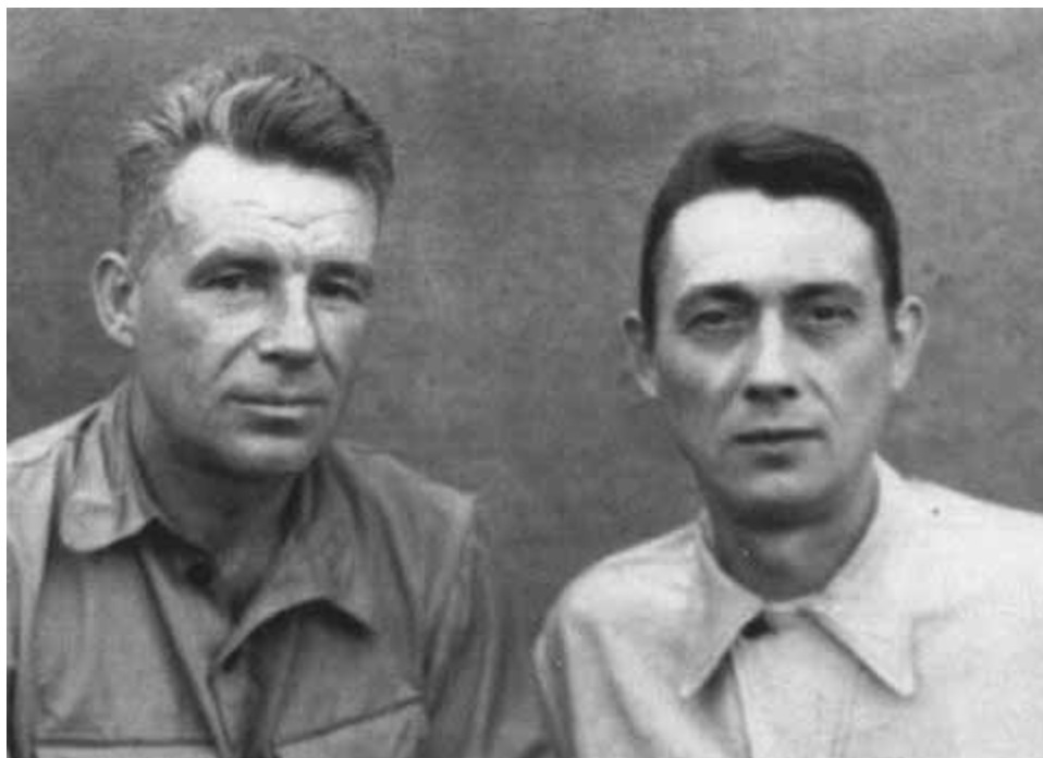
Александр Старостин (слева) в Молотове во время отбывания срока. 1947 г.