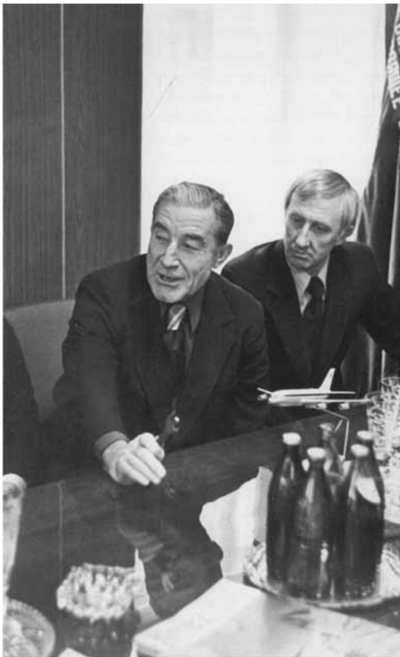
Глава московской федерации футбола Андрей Старостин (слева) и Игорь Netto.