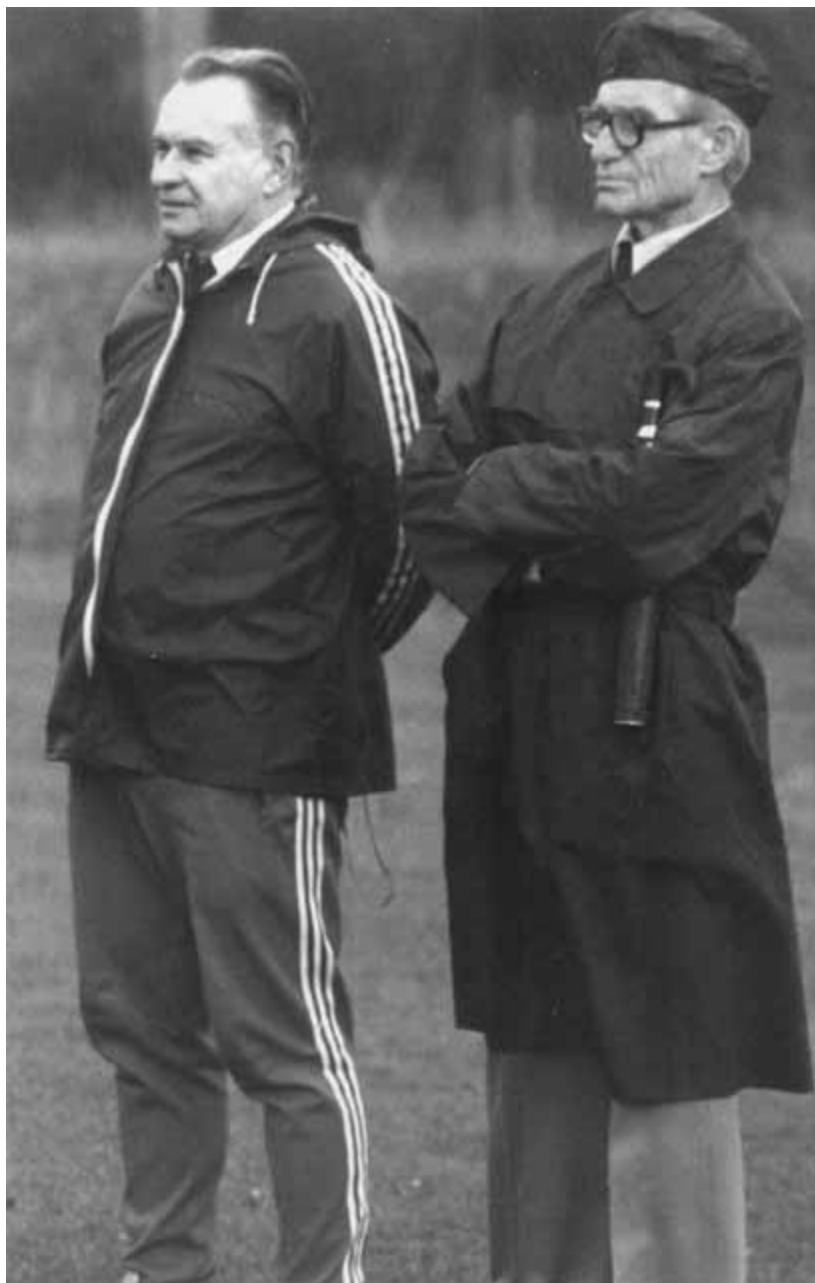
Николай Старостин ( справа ) со старшим тренером московского «Спартака» Константином Бесковым.