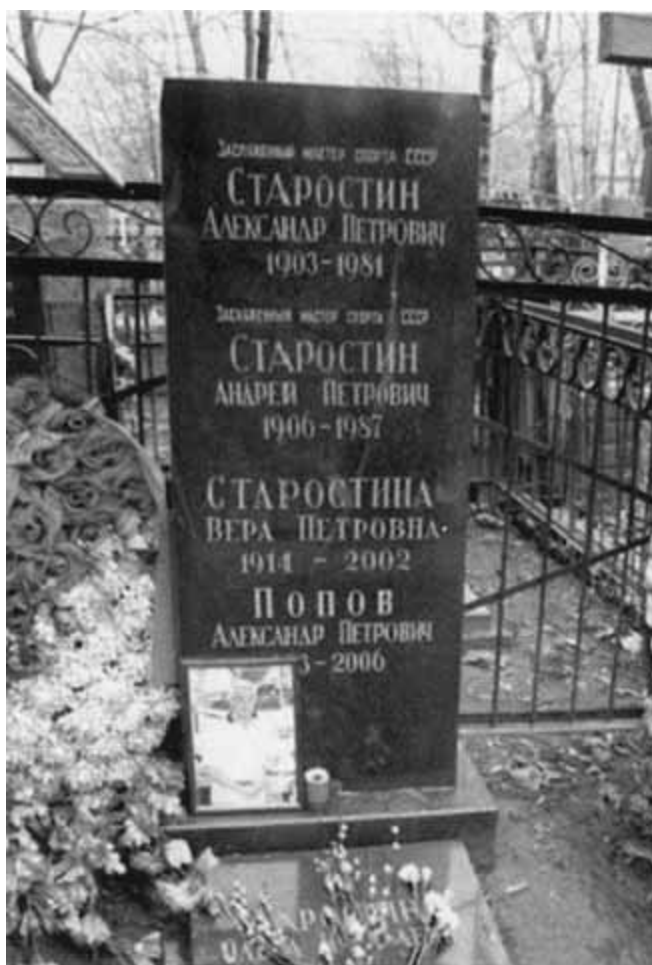
Могила Александра и Андрея Старостиных на Ваганьковском кладбище, где похоронены также их сестра Вера и племянник Александр.

Никита Симонян, начальник команды Николай Старостин. 1994 г.