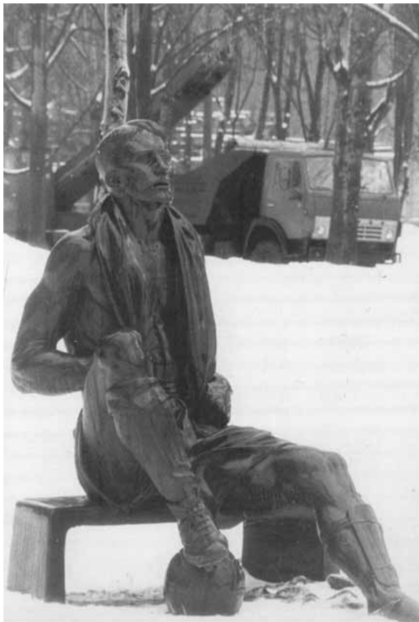
Памятник Николаю Старостину в «Лужниках».