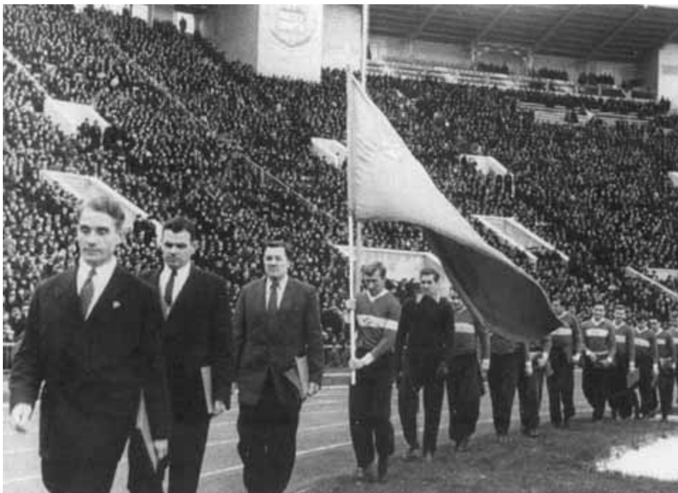
Чемпионы СССР футболисты московского «Спартака» совершают круг почета на церемонии