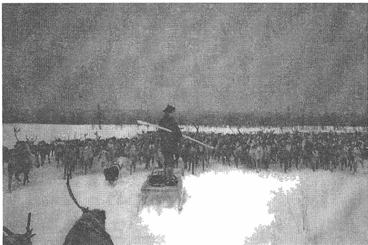
Виталий Утукогир гонит 1-е стадо к пастбищу на своих новых санях.