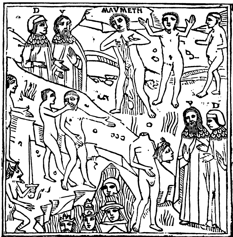
Трубадур Бертран де Борн в Дантовом «Аду», несущий отсеченную от тела собственную голову. Гравюра XV в., включенная в первое издание «Божественной комедии» (1491)

В толпе, кружащей неисчетный раз, И срезанную голову держало За космы, как фонарь, и голова Взирала к нам и скорбно восклицала: