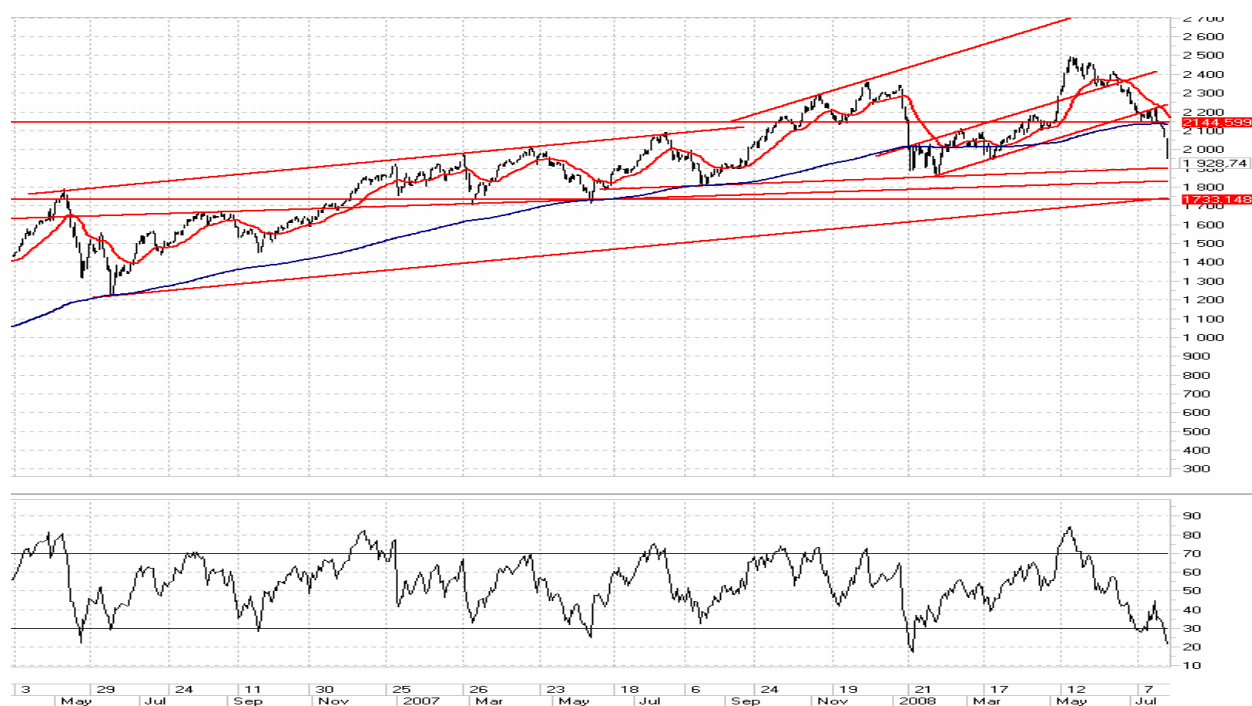
Построение трендов на графиках текущих цен и скользящих средних (вверху) и осциллятора (внизу)

Следует отметить, что на нетрендовых рынках графики скользящих средних могут давать много ложных сигналов, а потому быть непригодными для принятия инвестиционных решений. На нетрендовых рынках обычно используются осцилляторы, среди которых наиболее известным является индекс относительной силы (RSI). На графике RSI можно выделить несколько уровней: «пиковый» – выше 70% (зона перекупленности), «дно» – ниже 30% (зона перепроданности) и «средняя зона» – в пределах от 30 до 70% (см. рис.).