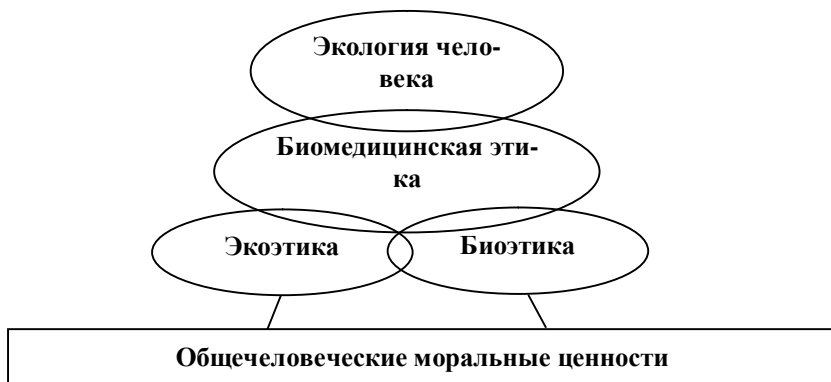
Рис. 1. Этическое обеспечение экологии человека

методологического основания для биомедицинской этики, которая, по существу, обеспечивает экологию человека. Но опираются все они, в конечном итоге, на те общечеловеческие ценности , которые выработаны социумом, составляют основу его существования и обретают особый смысл и специфику в медико-биологической деятельности (рис. 1).