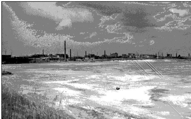
Рис.6. «Белое море» — шламонакопитель завода № 96, г. Дзержинск

Вопрос об организованном захоронении твердых промотходов в почву в районе Дзержинска был всегда осложнен: грунты в тех краях песчаные, для тех мест характерны карстовые явления, да и водоснабжение города — грунтовое 644 . Поэтому каждый завод в одиночку решал проблемы утилизации твердых отходов. Соответственно, информация о захоронении твердых промотходов на территории и вокруг заводов № 96, № 148 и ЧХЗ незначительна. Хотя любой житель города охотно покажет, где находится «белое море» (шламонакопитель завода № 96, куда поступали отходы выпуска иприта, рис.6), «черная дыра» и т.п. достопримечательности.