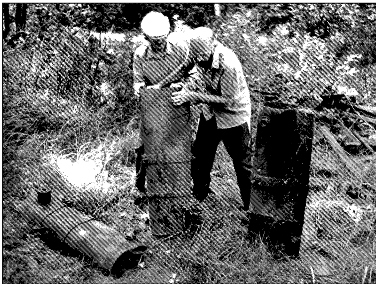
Рис.8. Остатки авиационных химических боеприпасов, обнаруженные на одной из площадок вблизи базы хранения авиационных боеприпасов в Леонидовке (снимок 1995 г.).