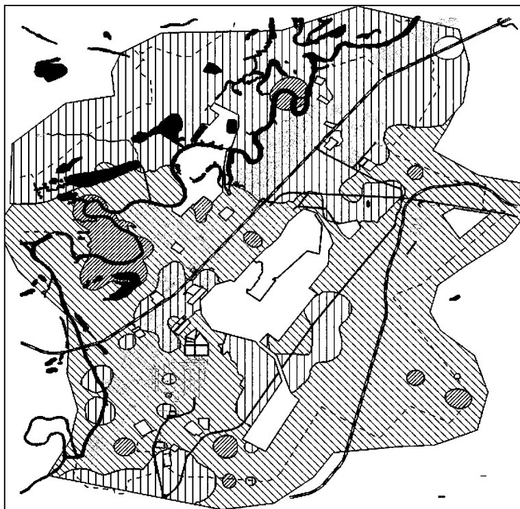
Рис.7. Содержание мышьяка в верхнем горизонте почв г. Чапаевска вне заводских территорий (в единицах превышения ПДК) 639 . Линии с наклоном направо обозначают городские территории, где ПДК по мышьяку превышаются в 2–3 раза. Линии с наклоном налево — территории, где имеется 3–5 единиц превышения ПДК. Вертикальные линии обозначают места с 0–2 единицами ПДК по мышьяку.

Что касается всего города, то концентрации мышьяка в его почвах находятся в пределах 3,3–30 мг/кг (то есть от 1,65 до 15 ПДК). Часть этих загрязнений приходится на садовые участки и частные дома. И вообще много загрязнений мышьяком приходится на пойму р. Чапаевки — свидетельствуя продолжающегося поверхностного смыва мышьяка. Неудивительно поэтому и появление отдельных пятен загрязнения мышьяком высокой интенсивности вне завода, в частности, в северо-восточной части города (микрорайоны Горки и Мал. Томылово). Можно удивляться, но оксид люизита найден даже в донных отложениях городского оз. Ильмень. Мышьяк — тоже 49,639 . На нижеследующем рис.7, взятом из книги 639 , приведены территории города вне заводов, где в почвах содержится слишком много мышьяка. Как оказалось, мест с мышьяком выше нормы в Чапаевске очень много. А вот городских территорий с 0–2 единицами ПДК по мышьяку в городе не так уж много.