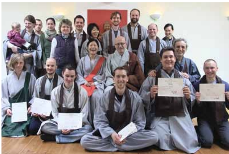
Групповая фотография по окончании последнего полного ретрита с Ву Бонг ССН в Дзен-центре в Берлине. Апрель 2013