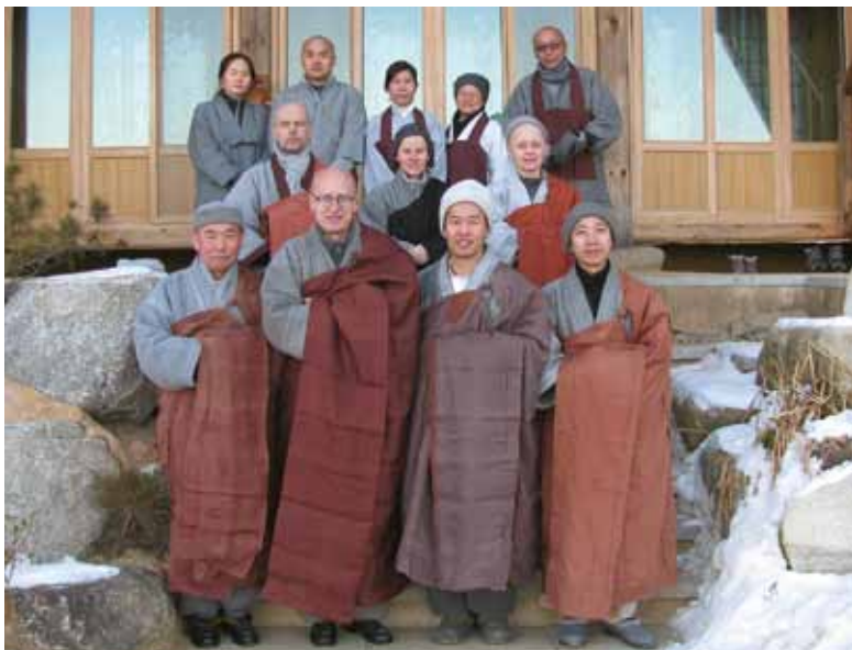
Групповое фото во время кьолче в храме Попхваторьян