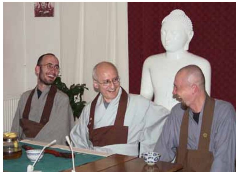
Вверху: Прага Внизу: Санкт-Петербург (Павловск)