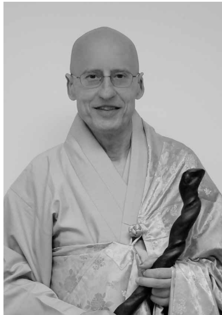
ДЗЕН-МАСТЕР ВУ БОНГ

© European Kwan Um School of Zen © А. Рымарь, перевод, 2014