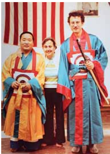
С мамой и тренером по Шим Гун До