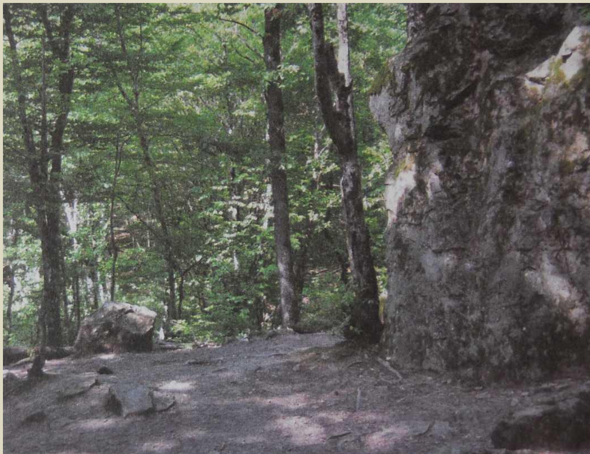
Камушек слева рядом с Храмом «Сотворение Мечты»

— Акар, а вот отдельно стоит один камешек (слева) — это тоже храм Света?