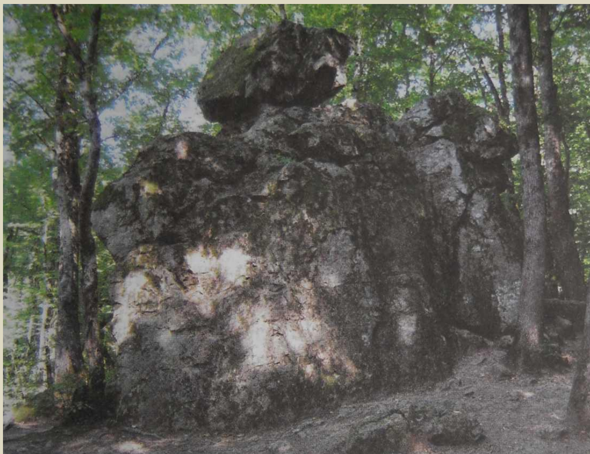
Храм «Сотворение Мечты»

Любви открывается портал, в который он может войти, выйти обогатённым и ожидать исполнения.