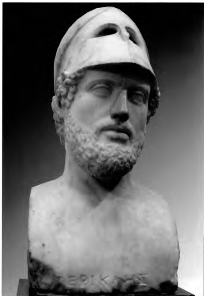
IX. Перикл. Сын Кеантиппа