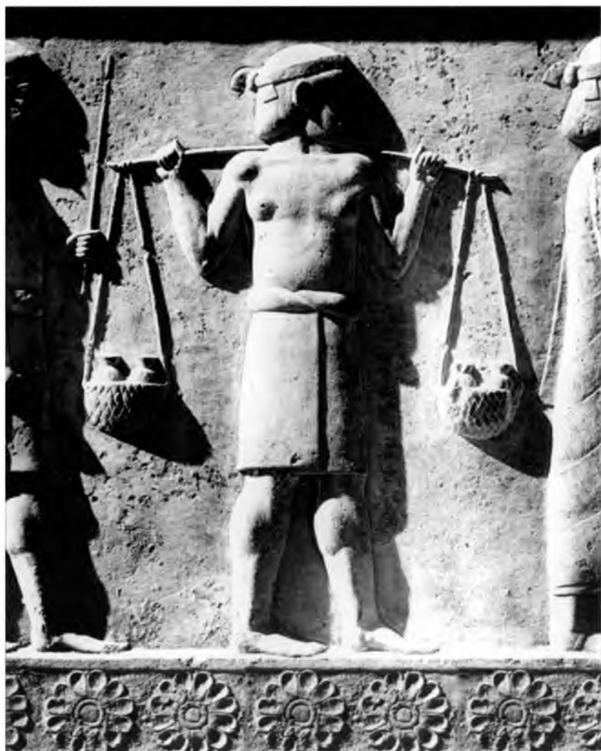
X. Представитель чужеземной делегации, приносящей дары персидскому царю Дарию I (возможно землю и воду). Рельефы тронного зала (ападаны) из Персеполя