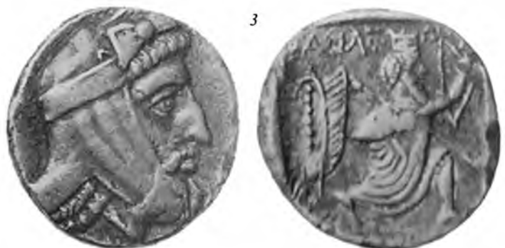
1. Тетрадрахма Тиссаферна 2. Тетрадрахма Тиссаферна 3. Тетрадрахма Тиссаферна