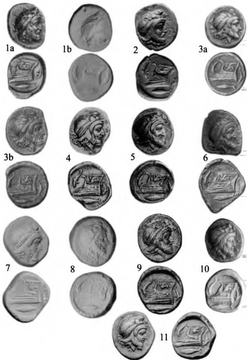
ХII. Тетрадрахмы Фарнабаза. г. Кизик