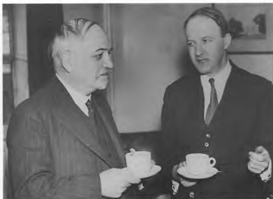
И.М. Майский и Р. Батлер в советском полпредстве в Лондоне