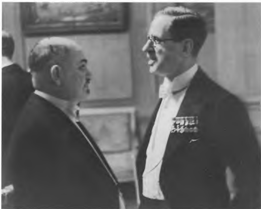
И.М. Майский с У. Стэнгом на приеме в советском полпредстве. 1940 г.