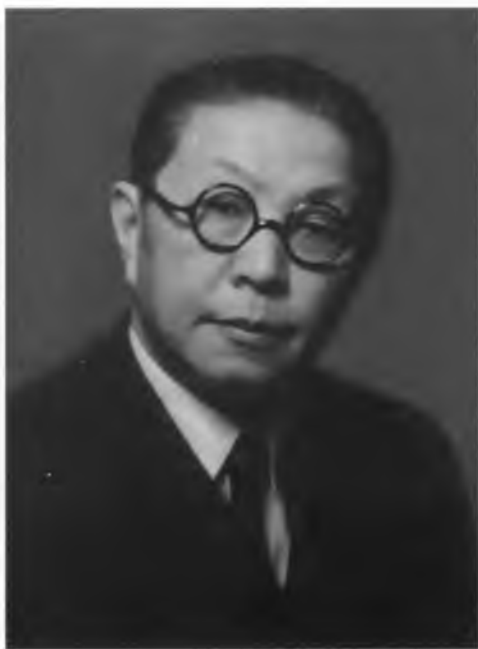
Фотография китайского посла в Великобритании Го Тайчи (Ку Тайчи) с дарственной надписью: «Коллеге и другу И. Майскому». Апрель 1941 г.