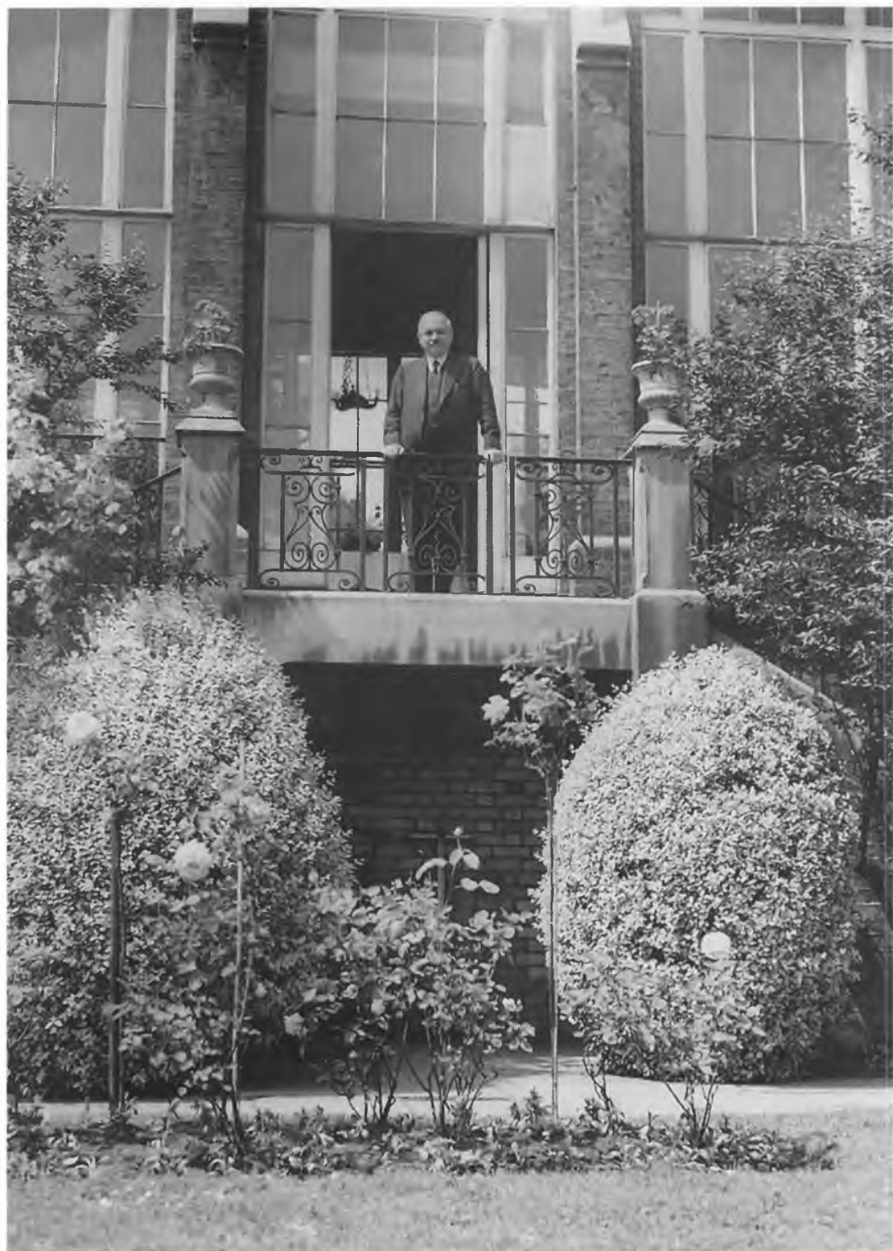
На балконе советского полпредства в Лондоне. Июнь 1940 г.