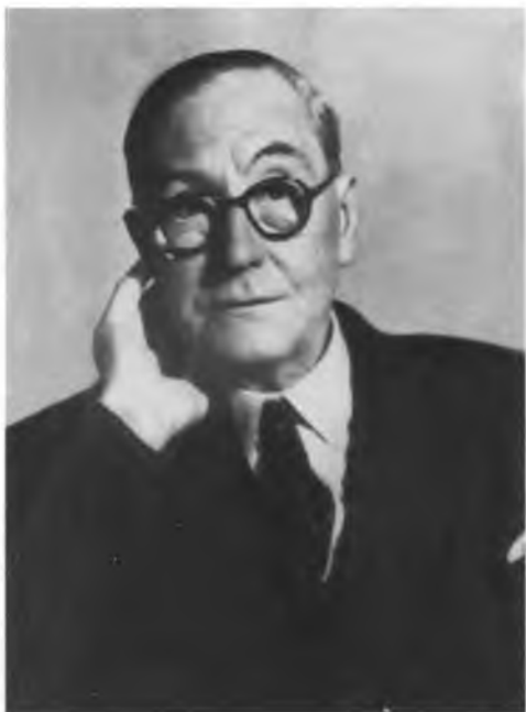
Заместитель лидера лейбористской партии А. Гринвуд. 1941 г.