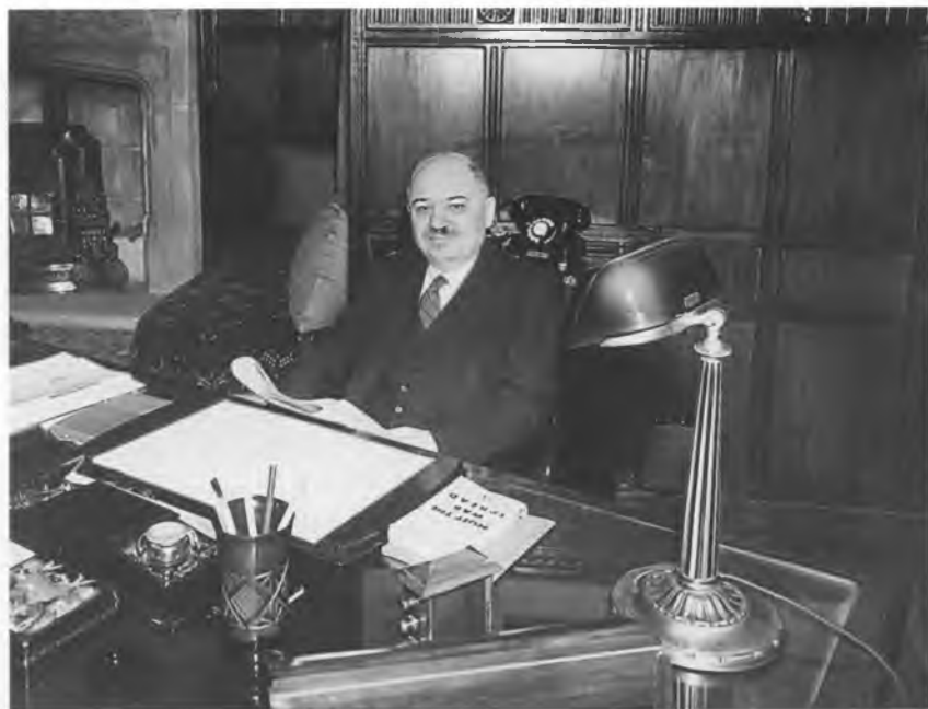
И.М. Майский в кабинете полпредства СССР. 1940 г.