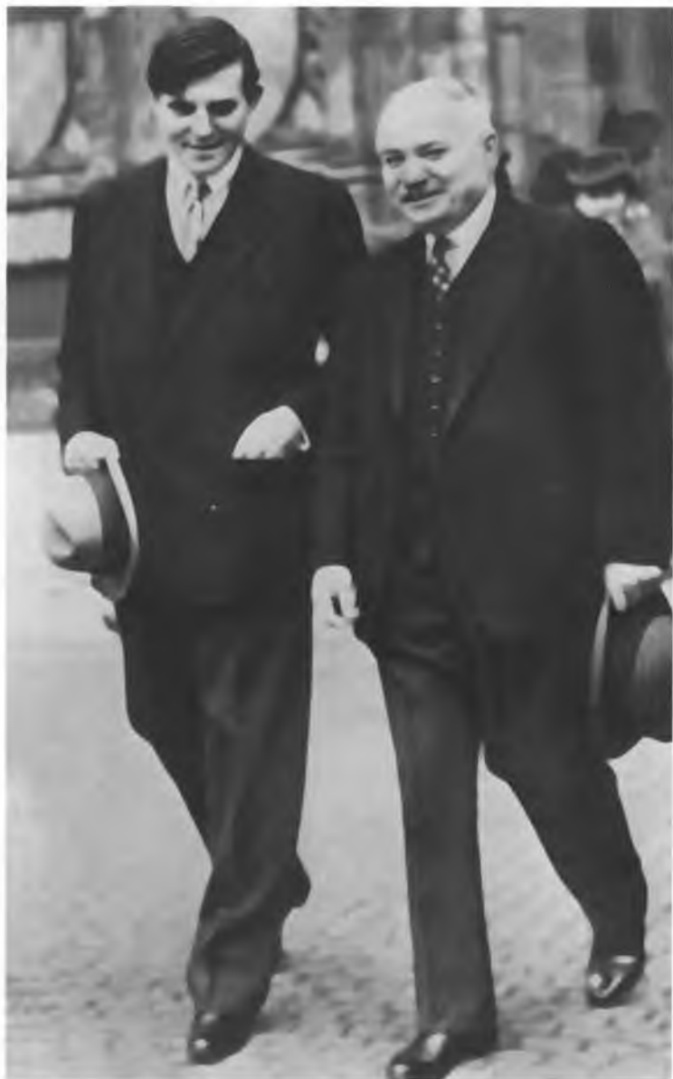
Новый американский посол в Лондоне Дж. Вайнант и И.М. Майский. 1941 г.