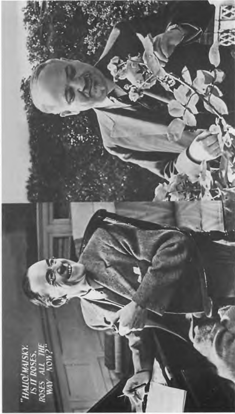
И.М. Майский в полпредском саду. Монтаж со Ст. Криппсом