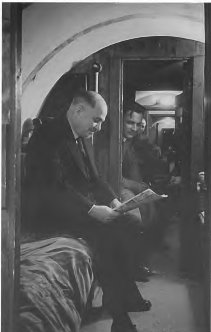
Воздушная тревога. Советские дипломаты в бомбоубежище