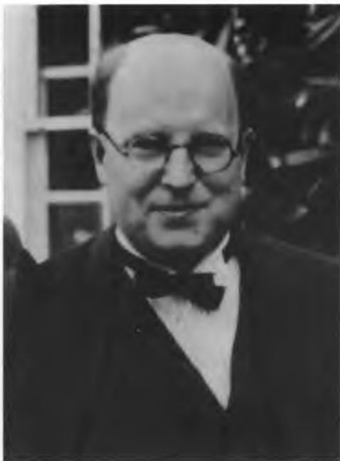
Д.Н. Притт – председатель английского Общества культурной связи с СССР. 1940 г.