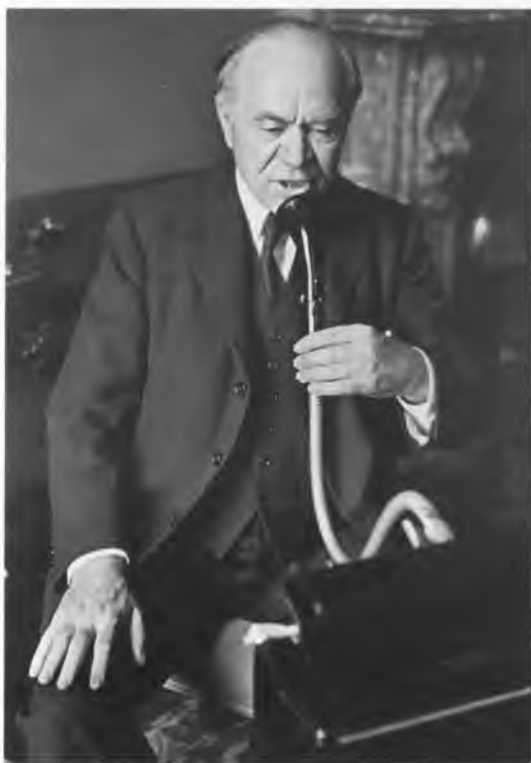
У. Бивербрук – министр авиационного производства Великобритании. 1940 г.