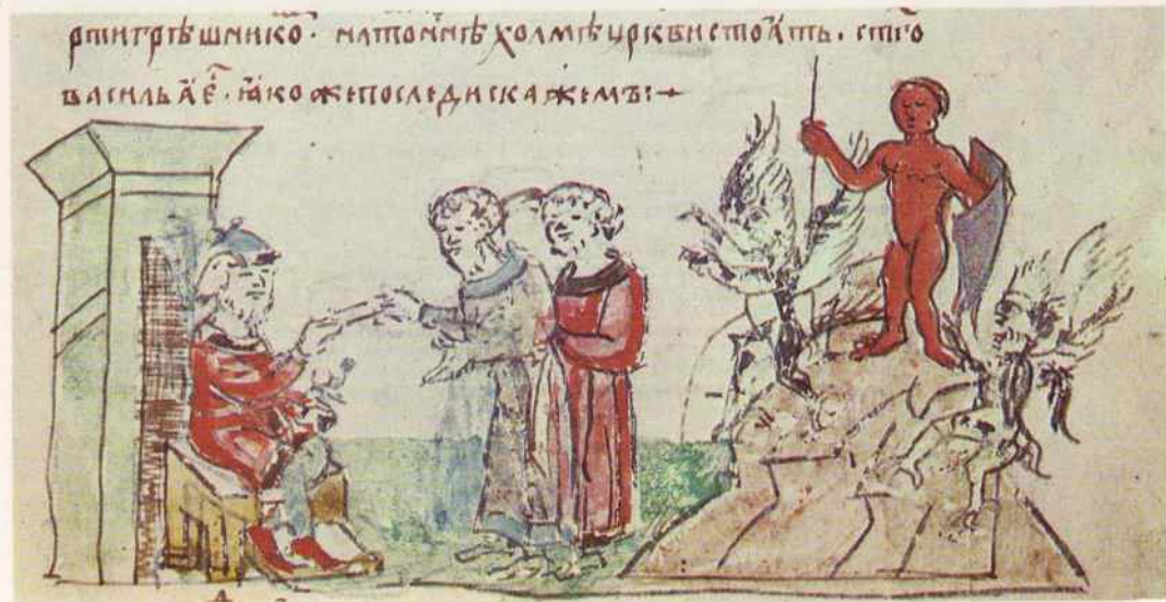
Языческий идол на берегу реки