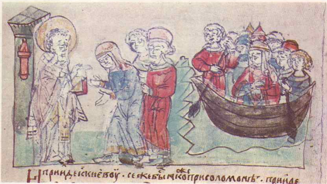
Прииде къ князю . се же бы мѣсто при коломаѣ . гдѣ иде