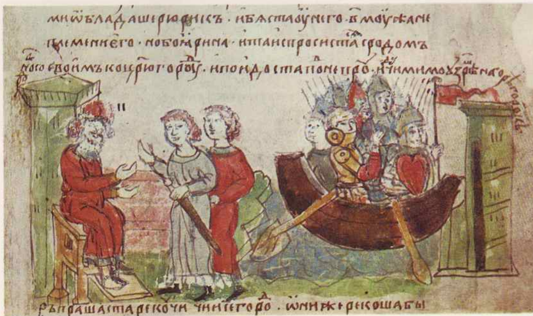
Прибытие Аскольда и Дира в Киев