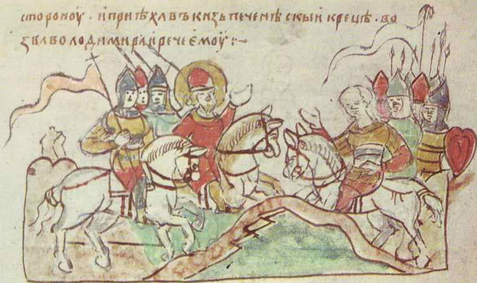
Встреча киевской дружины с кочевниками на рубеже

сторону . и притѣхавъ князь печенѣскый крещъ . во зѣво лодми рече ему :