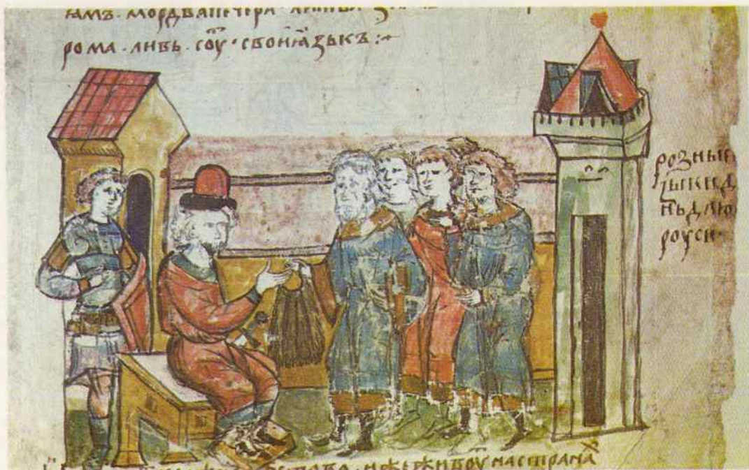
Подношение дани киевскому князю племенами