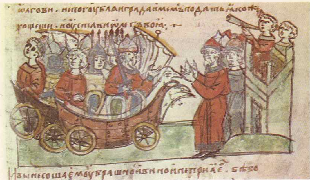
Поход руссов в ладьях «на колесах»