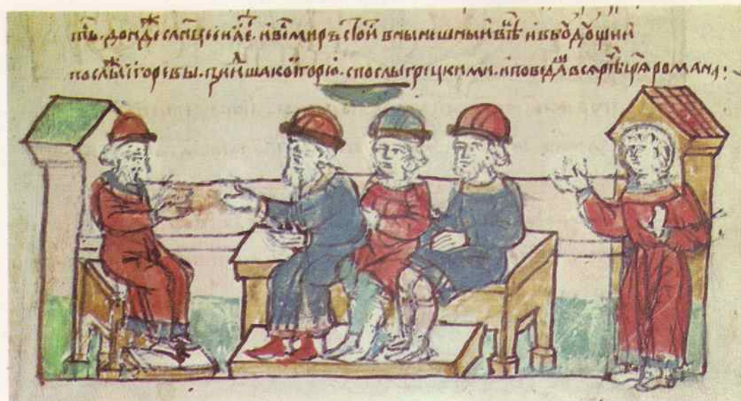
Заключение мирного договора между Русью и Византией