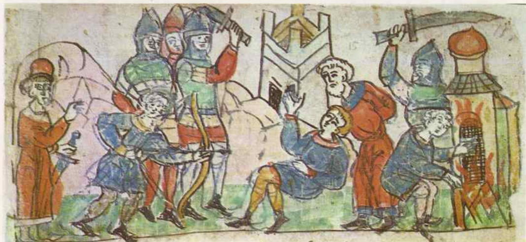
Бой руссов с византийцами