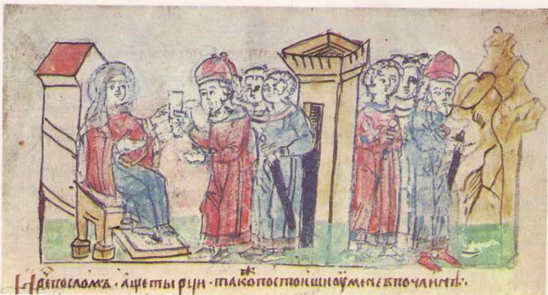
Даетъ слово . а щеты рун . тако постоиши на ѹмъ не впо чинишь .