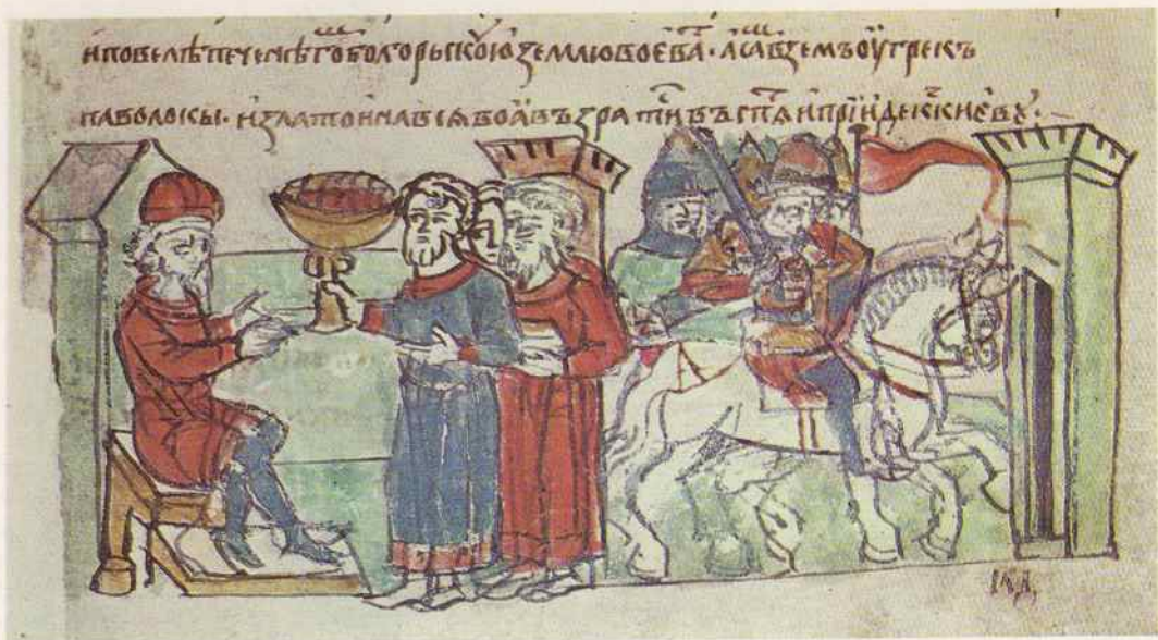
Византийские послы просят мира