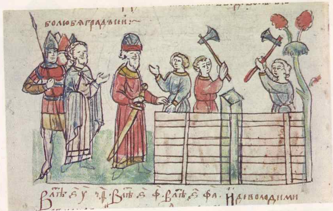
Основание укрепленного городка