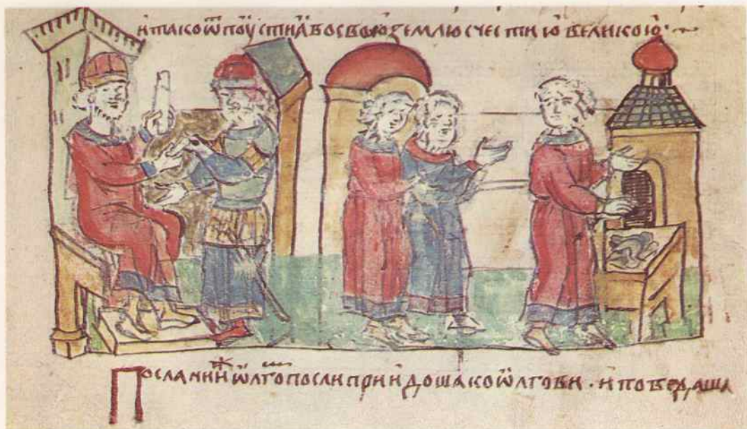
«Отпуск» русских послов из Царьграда