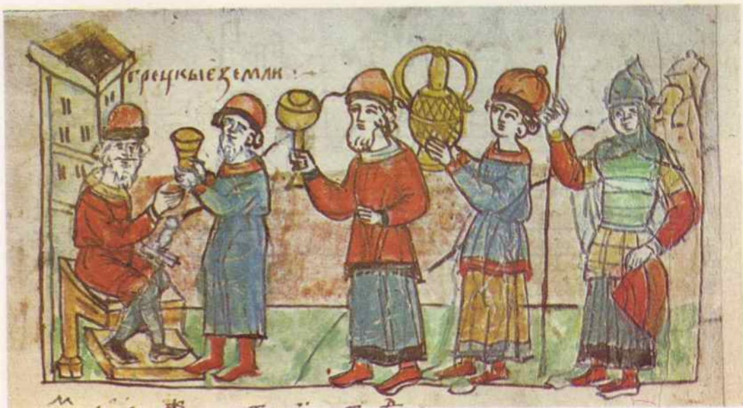
Византийцы приносят дары Игорю