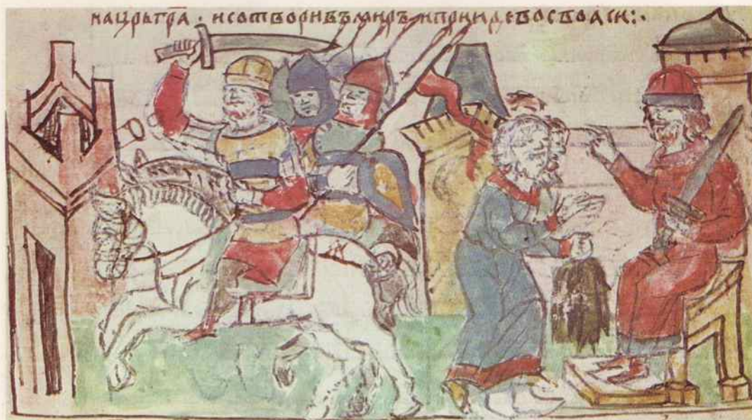
Поход Игоря на Константинополь