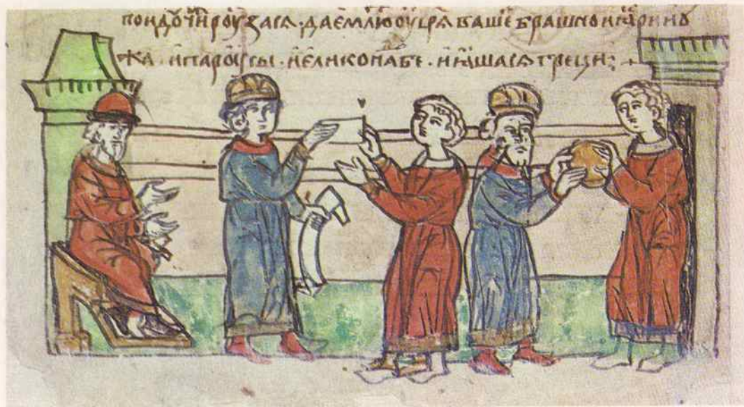
Заключение мирного договора