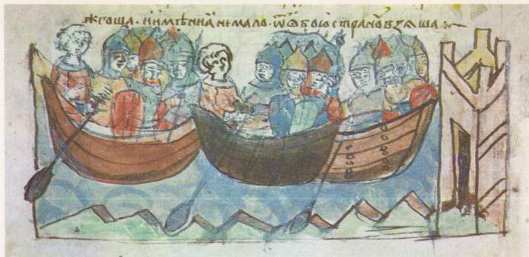
Морской поход русского войска