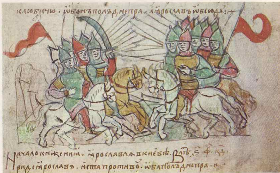
Бой между княжескими дружинами