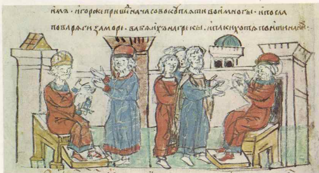
Наем варягов за морем