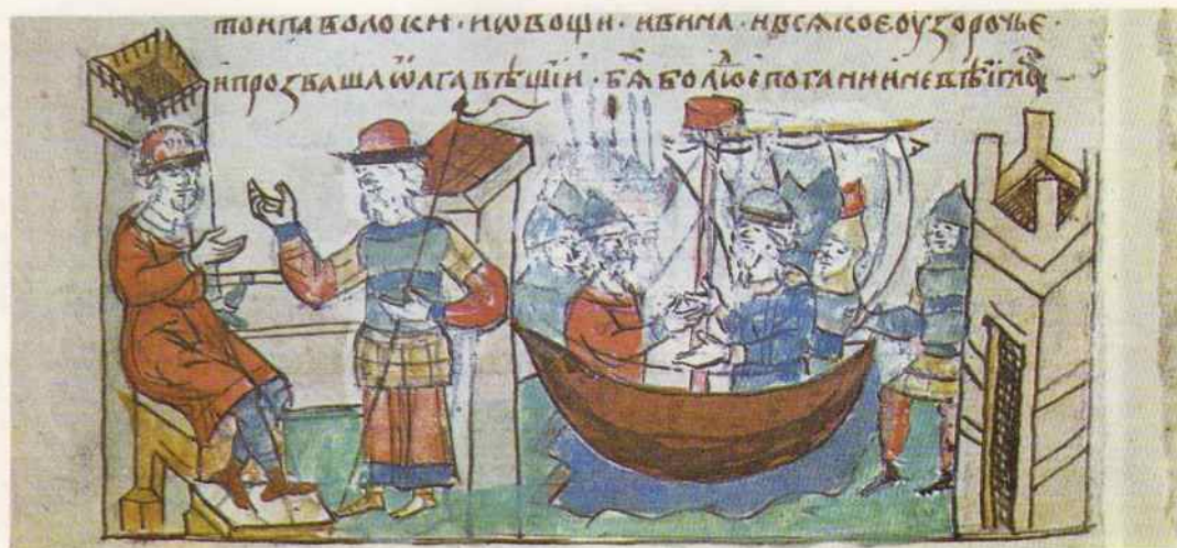
Возвращение Олега в Киев