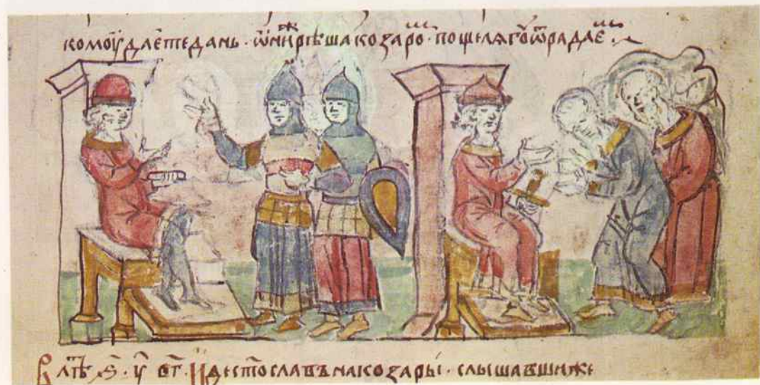
Объявление войны киевским князем