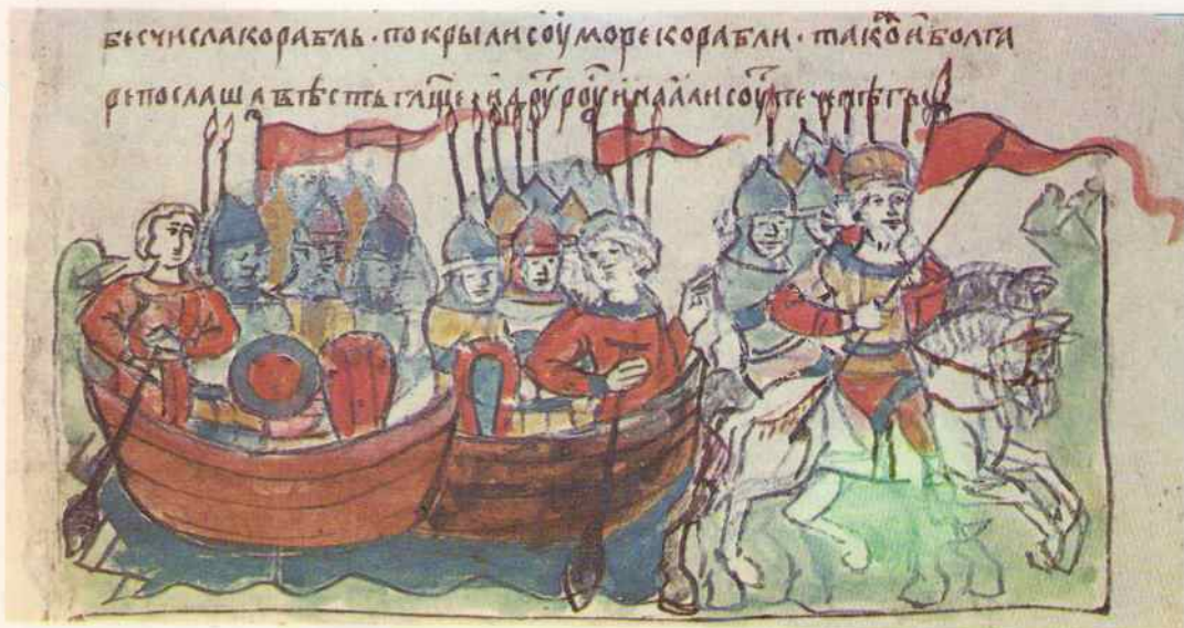
Второй поход Игоря на Византию