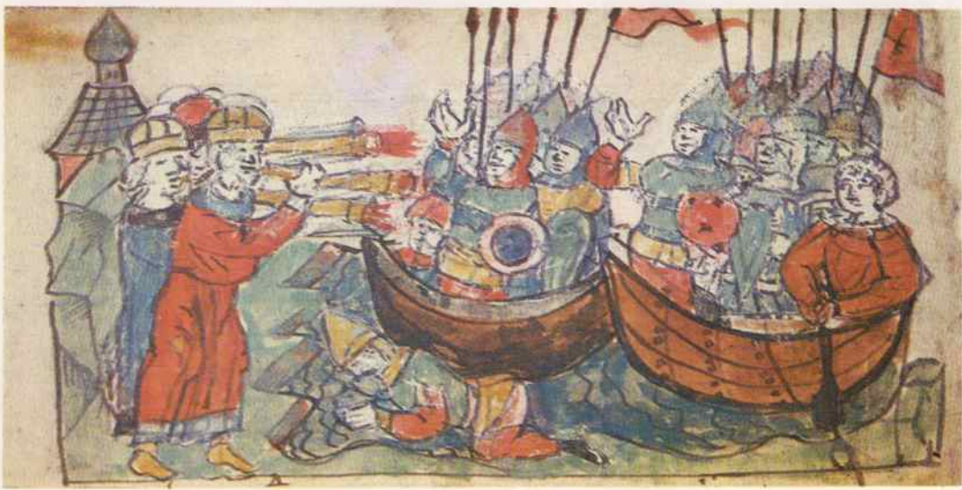
Византийцы используют «греческий огонь»