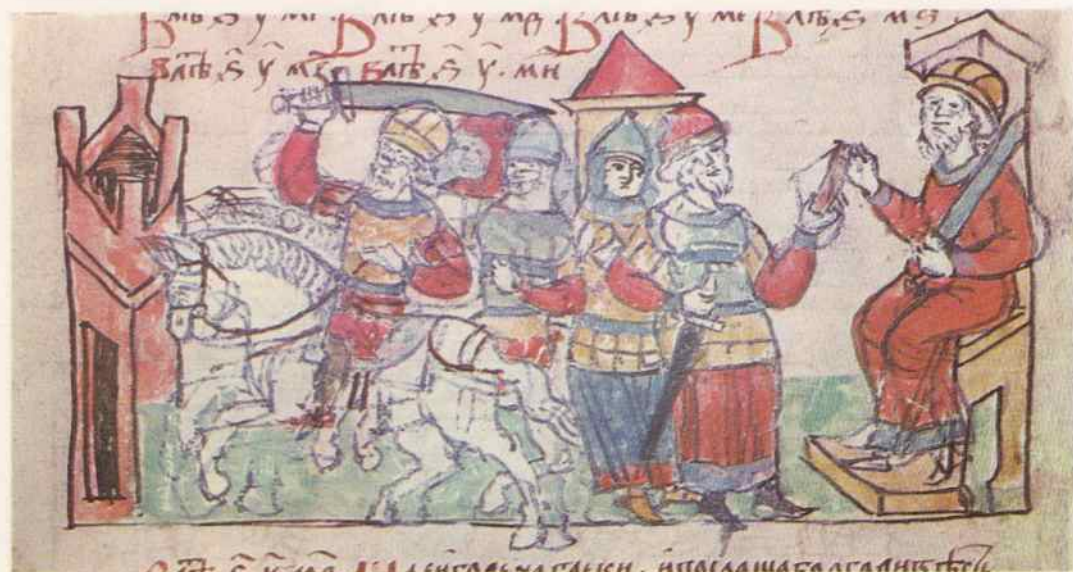
Поход Игоря на Византию Посылака гонца к болгарам

ВѢСЪ У . ІГ . ПРИДОША ПЕЧЕНЬГИ И ПЕРВОЕ ПАРОВОУ СКОЮЮ ГЕМЛЮ ИСОТВОРИ ВЪШЕМОУ СЯ ИГОУ . И ПЕРИДОША КЛАМАЮ . ПИ