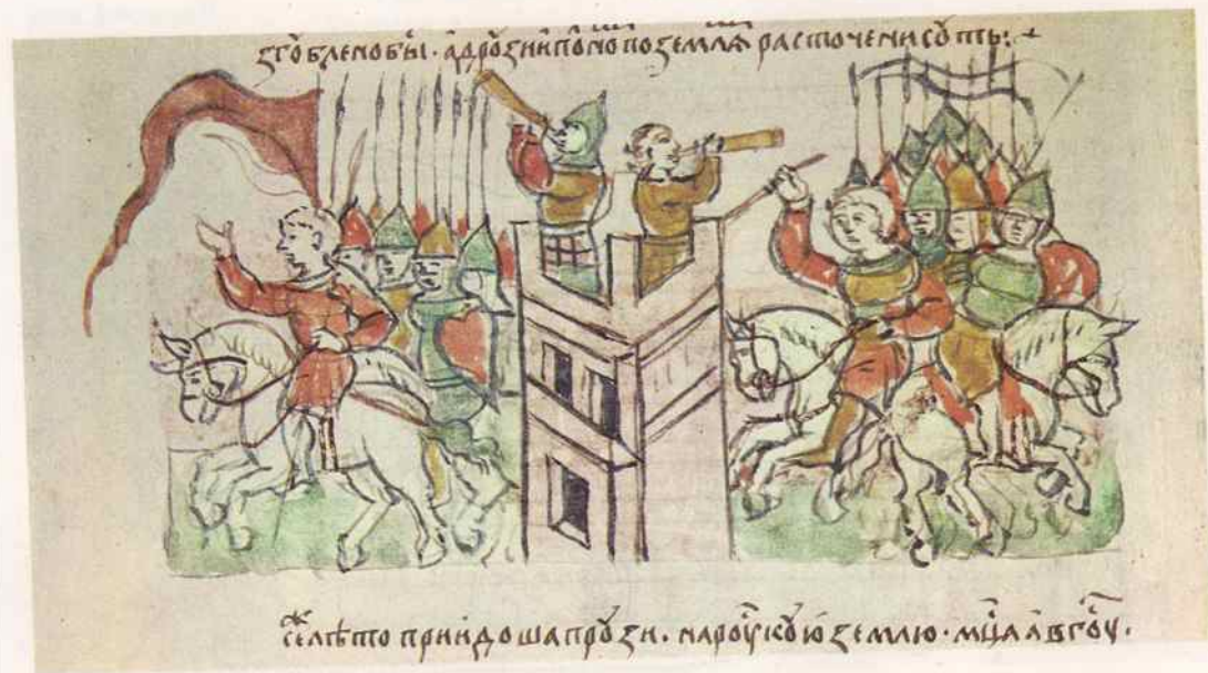
Оборона русского города