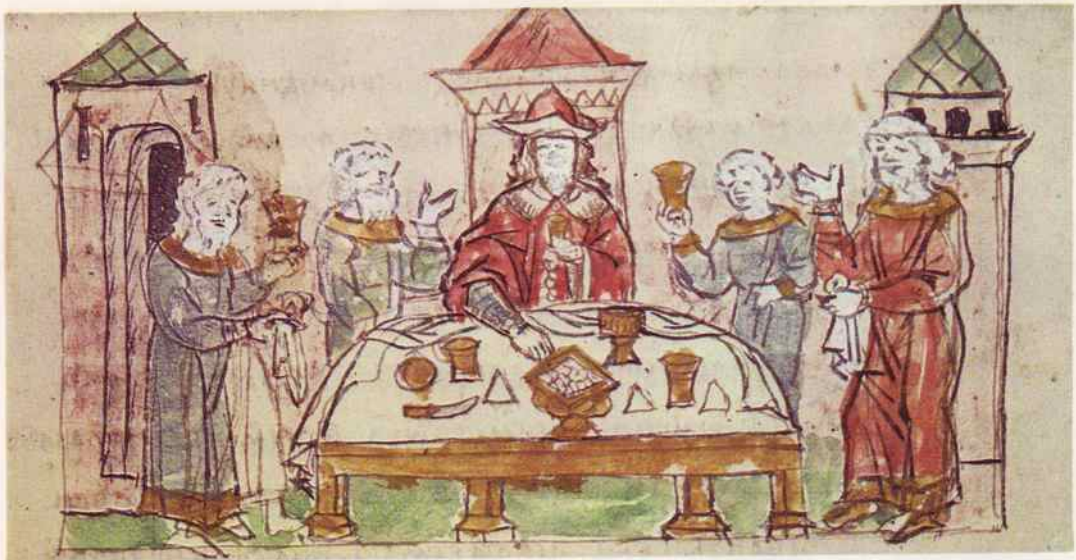
Пир у киевского князя