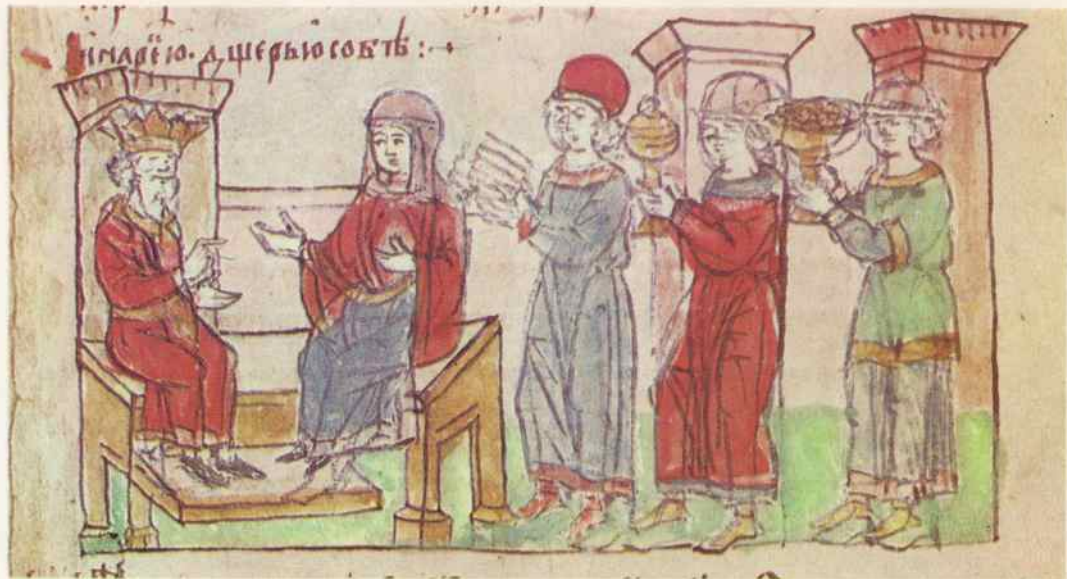
Великая княгиня Ольга в Византии