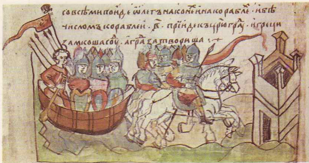
Поход Олега на Константинополь