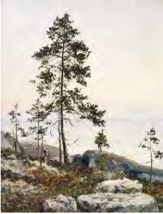
С.Г.Писахов. Берег Белого моря. Восход солнца. 1909.

"козулях" изображение... крылатого Солнца Египта, а на мезенских – лотосы Индии. Изумительное совпадение эмблем! Но этнографов это ничуть не заинтересовало, и коллекция погибла. П. публично дал пощёчину бюрократу, который допустил это варварство.