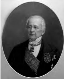
А.М.Горчаков, 1876 г.

(Так было и потом. А.П. встречал на своём пути много людей чистых, возвышенных, умных, порядочных, но – проходил равнодушно мимо. Это в лучшем случае. Чаше грязью поливал)