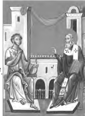
"Архим. Зинон (Теодор). Миниатюра (клеимо из жития) с иконы свт. Филарета, митр. Московского. Стихотворный диалог Пушкина и свт.Филарета" 53

Но удивляет, что православствующие почти двести лет пытаются уверить всех, что "А.П. простятся многие грехи" за то, что он "был искренне верующим". Зачем выдавать желаемое за действительное?