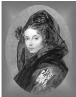
А.Г.Муравьева, 1825 г.

Н.Муравьев – жене: "Увы! Да, мой ангел, я виновен,– я один из руководителей только что раскрытого общества... Я причинил горе тебе и всей твоей семье. Все твои меня проклинаят... прости меня. Во всем мире у меня остались только мать и ты. Молись за меня Богу: твоя душа чиста и ты сможешь вернуть мне благосклонность неба".