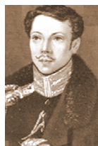
Бестужев- Марлинский А.А.

Прямым текстом призывал к ножу Рылеев, Бестужев-Марлинский пошёл дальше. Он свёл воедино подражание народным песням, прилипчивые ритмы, плебейский юмор, примитивные тексты и убийственное содержание куплетов. Все эти приемы были позаимствованы у Беранже, скопированы с песенок-куплетов французской революции. Он повторял те навязчивые пошлые песенки, которыми возбуждала себя на преступление чернь, и на фоне которых убийство начинало казаться веселой забавой, развлечением. В 1823–1825 гг. эти песенки расплозились по России. И были восприняты чернью и частью дворян. О содержании их, о каком-то литературном анализе не может быть речи: это не литература, а магия (позже, при большевиках, эти приёмы использовал Демьян Бедный (Ефим Придворов). В стихках-песенках Бестужева-Марлинского тоже призыв братья за ножи и с прихлопами и притопами идти на вельмож, на священников и на царя – с молитвой! (Без кошуинства не может обойтись ни один богоборец.)