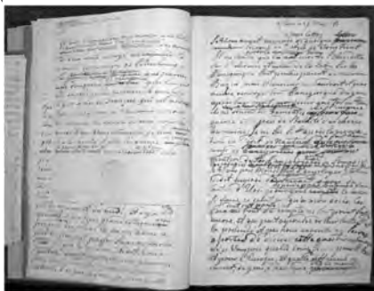
Письмо Екатерины Вольтеру, 26 мая 1767 г.

И стало по слову государыни. Они выросли, эти русские таланты, – на Вольтере. Их души питали иезуиты и масоны