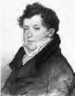
Тургенев А.И., 1816 г.

И ещё одна хроническая и неизлечимая шутка была в "Арзамасе": они ритуально "хоронили" членов "Беседы". Шутка плавно переходила, таким образом, в сатанинский ритуал . Похоже, был среди них (или рядом) кто-то постарше и поопытнее в таких делах. Тот, кто знал страшную силу мысли и слова, имел влияние в их кружке и направлял в определённое русло их молодое недомыслие и безрассудство. Направлял именно против "Беседы".