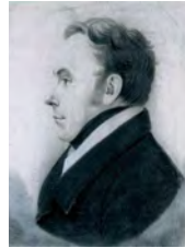
В.А.Жуковский, 1827 г.

Спасти его мог необычайный поэтический дар. Эту силу А.П. мог бы направить на служение Истине и Добру. Пытался помочь ему в этом В.А. Жуковский . Из писем его к А.П. (1824): "На всё, что с тобой случилось, и что ты сам на себя навёл, у меня один ответ: поэзия. Ты имеешь не дарование, а гений... У тебя есть средство быть выше несчастного несчастья и обратить в добро заслуженное; ты обязан иметь нравственное достоинство. Ты рождён быть великим поэтом; будь же этого достоин..." 57