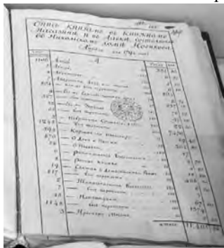
Опись конфискованных у Новикова книг

Императрица озабочена. Брюс получает указ все школы и больницы в Москве, за немногим исключением, подчинить Приказу Общественного Призрения. Ещё он должен осмотреть больницу, школы, училища, которыми управляют люди, попавшие под подозрение. Впредь училища должны быть только под ведением Приказа, чтобы в них "раскол, праздность и обман не скрывались". Запрещено печатание религиозных книг в светских типографиях.