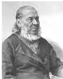
С.Т.Аксаков, 1850-е г.г.