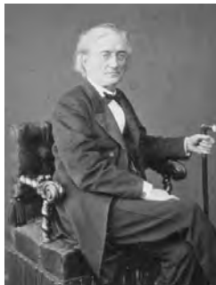
Ф.И.Тютчев, 1867 г.

На примере А.П. ясно видно, что если у человека нет притяжения к Истине, нет честности и благородства, то каким бы ни был его талант, это будет талант копииста, а не творца, и подлинники такой человек не сможет создавать. Именно для того, чтобы скрыть вторичность созданного Пушкиным, политические игроки и вынуждены были закрыть практически всю великую русскую литературу и начать отсчёт с А.П.: на фоне настоящих русских писателей он смотрелся бы очень бледно.