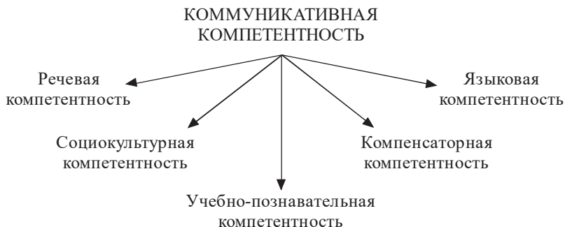
Рис. 8.1. Коммуникативная компетентность

3. Проанализируйте коммуникативную компетентность (рис. 8.1):