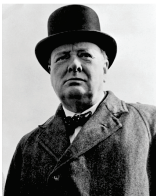
Уинстон Черчилль, Премьер-министр Великобритании в 1940–1945 и 1951–1955 годах

Среди известных дебатеров, такие знаменитости как: