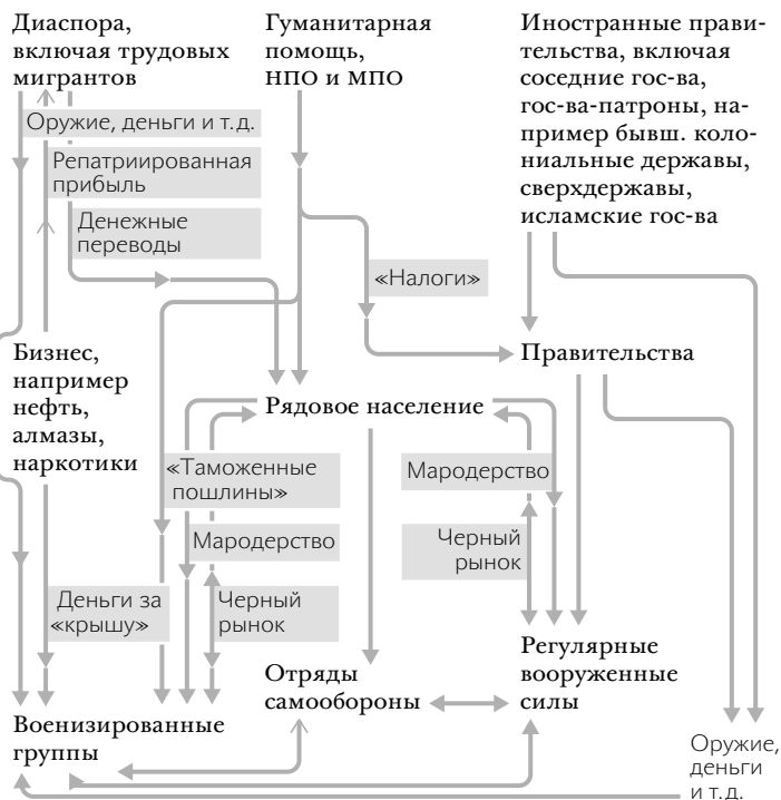
РИС. 5.2. Поток материальных средств в новых войнах

нитарной помощи. Прямая помощь от иностранных правительств, деньги за «крышу» от производителей сырьевых товаров и помощь от дияспоры увеличивают способность разнообразных боевых формирований извлекать из обычных людей еще больше материальных средств и таким образом поддерживать их военные усилия.