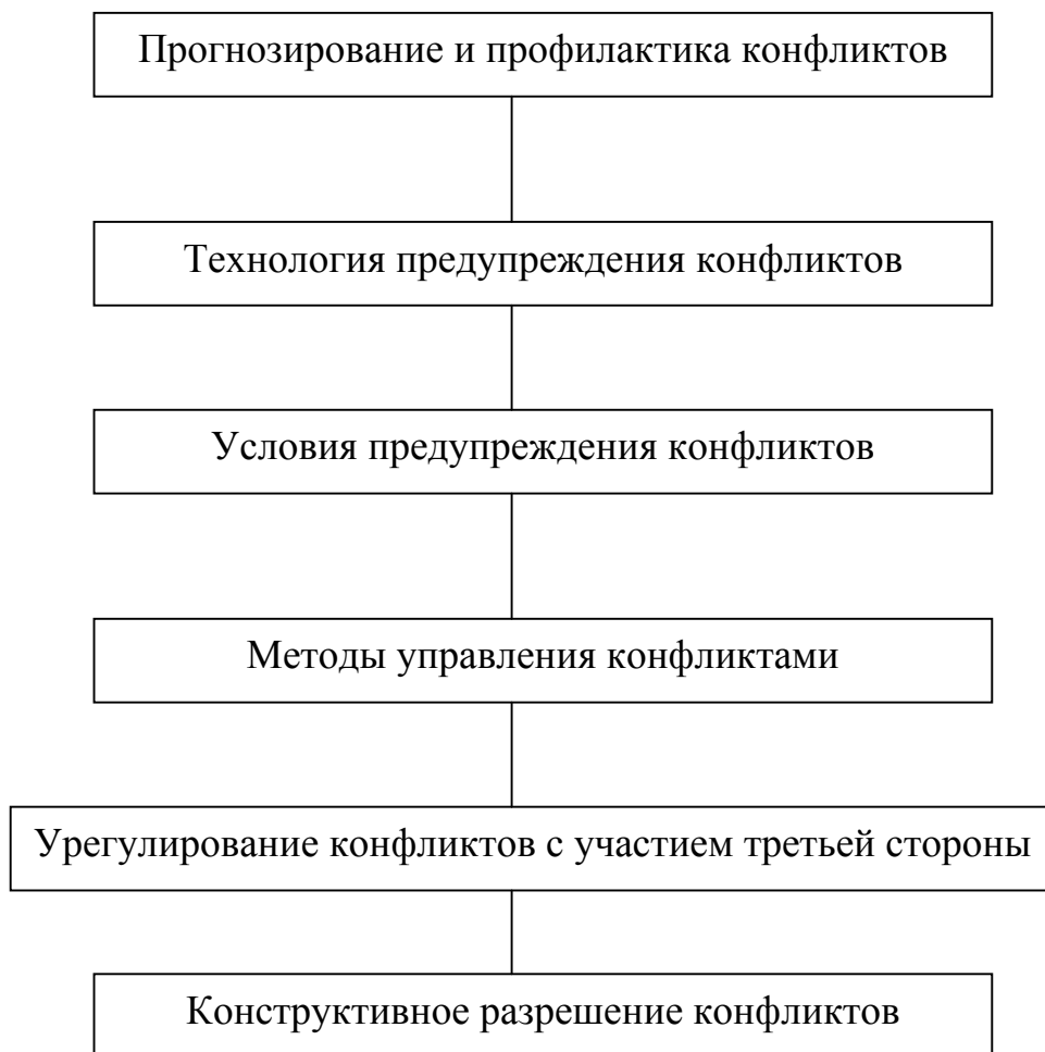
Рисунок 2 – Модуль 2