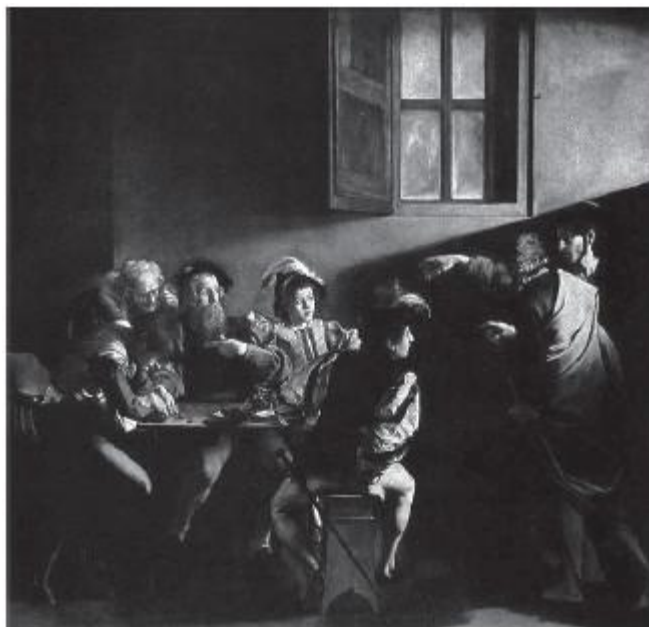
Караваджо «Призвание апостола Матфея»

внутреннего мира. Личность творца определяет выбор красок, и в зависимости от личностного развития изменяется манера рисования. Ранее источник творчества находился вовне, Караваджо же стал тем рубежом, когда источник творчества был открыт внутри. Колористика, освещение, композиция, техника стали средством выражения внутреннего самоощущения. Караваджо, как и Леонардо, оставил след в истории изобретением особенных технических приемов: тенебресо и чиароскуро. Иконописцы следовали утверждению, что икона нарисована не цветом, а светом. Художники Возрождения рисовали композицию, залитую светом. Караваджо отображал в картинах свое мироощущение: мир погружен во тьму, а источники света делают его видимым. Чиароскуро предполагает, что на любом освещаемом предмете всегда есть свет, тени, полутени, блики и рефлекссы, что позволяет увидеть форму предмета, его выпуклость, выразительность. Тенебресо – это контрастная светотень. Одна из знаменитейших работ Караваджо «Призвание апостола Матфея» открывает перед зрителем важность тьмы и падающего на предметы света. Она выполнена в темных тонах, доминирует мрак, в который сверху приходит луч света, – этот прием был назван «погребным светом», падающим извне, как будто кто-то открыл дверь в погреб.