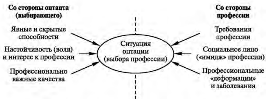
Рис. 2. Схема ситуации профессионального выбора

Темы для медитаций (активного воображения) могут быть самыми различными, но они непременно должны быть связаны с желаемой профессиональной деятельностью («Мой типичный рабочий день через 5 лет», «Моя работа и мои коллеги» и т. п.). Желаемость, воображаемое воплощение «того, о чем мечтается», — вот неперенное условие разворачивания картины возможных профессиональных успехов и достижений.