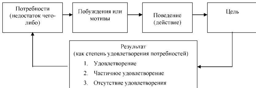
Рис. 1. Модель удовлетворения потребностей

торых удовлетворяются потребности, порождающие энергетическое обеспечение социально-экономической активности личности — ее мотивацию.