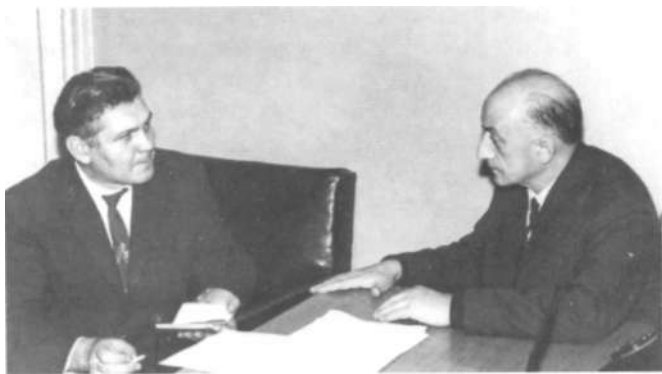
Б. Г. Ананьев и Б. Ф. Ломов