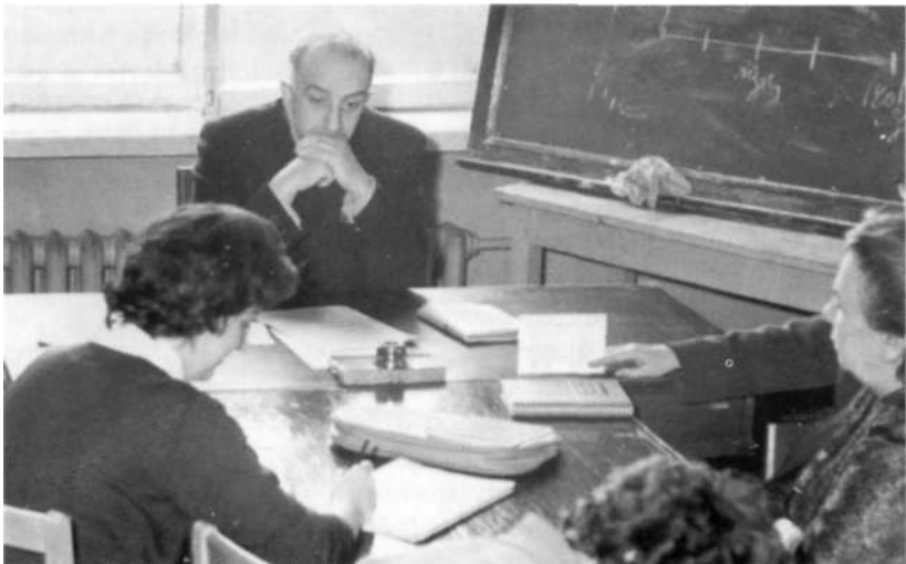
Заседание кафедры общей психологии (1964 год)