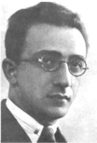
Б. Г. Ананьев (1937 год)