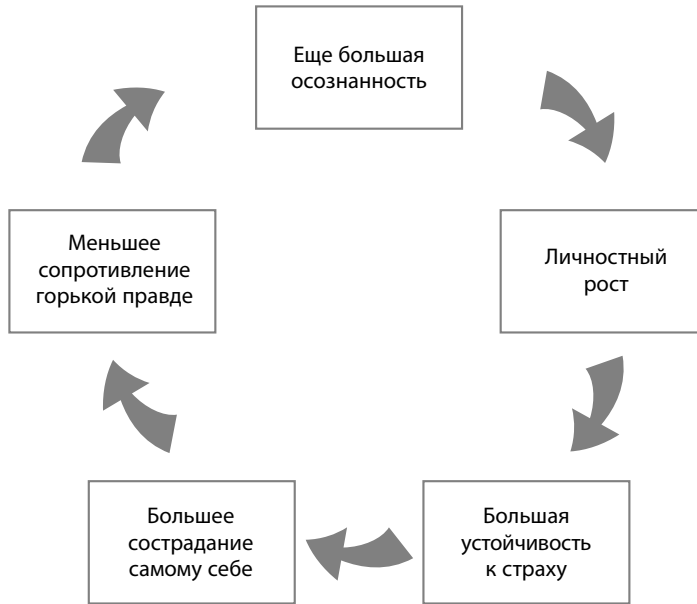
Рис. 1. Цикл осознанности

Рассмотрим пример Джека, который только что сделал открытие о самом себе: