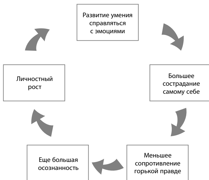
Рис. 2. Цикл осознанности