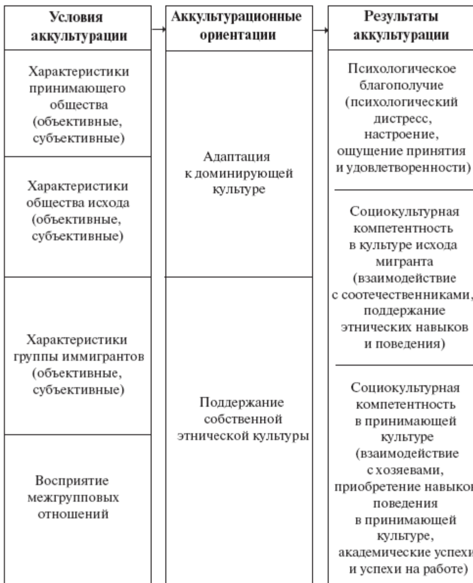
Рис. 3.1. Схематичное изображение переменных, описывающих аккультурацию (приводится по [Sam, Berry, 2006])

Условия аккультурации включают в себя характеристики принимающего общества, общества исхода группы иммигрантов и восприятие межгрупповых отношений. На индивидуальном уровне имеют значение личностные характеристики мигранта.