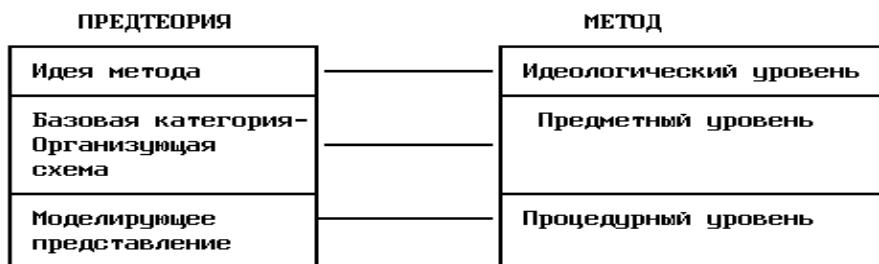
Рис. 1 Схема соотношения между компонентами предтеории и уровнями метода

Эмпирический метод выступает как зависимый от предтеории. В структуре предтеории представлена идея метода, которая, в свою очередь, определяется пониманием предмета науки. Если предмет науки – сознание или внутренний опыт, то идея метода, его принцип, определяется через внутреннее восприятие, самонаблюдение. Это означает, что если в данном исследовании будут использоваться другие методы, например, эксперимент, то они будут выступать исключительно в роли вспомогательных, дополнительных, лишь создающих оптимальные условия для внутреннего восприятия. Идеи метода недостаточно, чтобы охарактеризовать метод психологического исследования в целом. Одна и та же идея метода может воплощаться в существенно различающихся вариантах метода. Метод представляет собой сложное образование, имеет уровневую структуру, причем различные уровни связаны с различными компонентами предтеории. Схематически соотношение между компонентами предтеории и уровнями метода можно представить следующим образом (рис. 1).