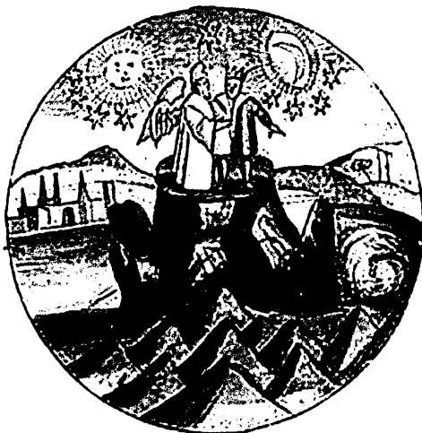
Рис. 2. Новорожденный Камень поднимается в гору и там встречается со звездами и их энергиями. Из «Книги Ламбспринга»

Духа-Хранителя. Занимаясь с Духом-Хранителем, вы также переживаете постоянное развитие. Даже если вашей целью является не ваш собственный рост, а того, кого вы любите, вы все равно, так или иначе, принимаете участие в этом.