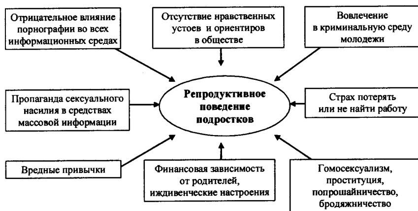
Рис. 2. Факторы, формирующие девиантное репродуктивное поведение подростков

Социальные, политические, экономические, культурные, религиозные факторы оказывают существенное влияние на репродуктивное здоровье и репродуктивное поведение подростков (рис. 2).