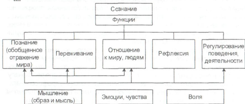
Рис. Функции, свойства сознания

Выделяют следующие свойства сознания: построение отношений, познание и переживание (рис.). Отсюда непосредственно следует включение мышления и эмоций в процессе сознания. Действительно, основной функцией мышления является выявление объективных отношений между явлениями внешнего мира, а основной функцией эмоции — формирование субъективного отношения человека к предметам, явлениям, людям. В структурах сознания синтезируются эти формы и виды отношений, и они определяют как организацию поведения, так и глубинные процессы самооценки и самосознания. Реально существуя в едином потоке сознания, образ и мысль могут, окрашиваясь эмоциями, становиться переживанием. «Осознание переживания — это всегда установление его объективной отнесенности к причинам его вызывающим, к объектам, на которые оно направлено, к действиям, которыми оно может быть реализовано» (С. Л. Рубинштейн) [4, с. 57—58].