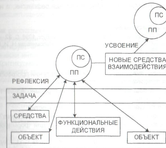
Рис. Механизм формирования профессионального самосознания. (ПП — профессиональная позиция; ПС — профессиональное самосознание)

Для появления новых средств и способов деятельности нужно, чтобы «сама деятельность стала предметом специальной обработки, чтобы на нее направилась бы новая, вторичная деятельность. Иначе говоря, должна появиться рефлексия по отношению к исходной деятельности» [2, с. 151].